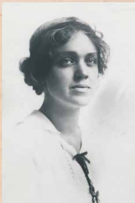
12. Agnes Smedley - Amerikos radikalė, revoliucionierė, rašytoja ir šnipė.