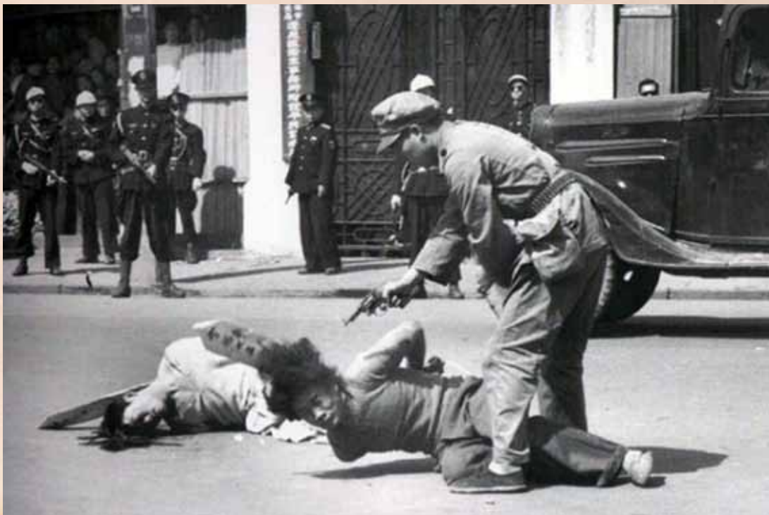
10. (viršuje) Kinijos komunistų sušaudymas per baltąjį terorą Šanchajuje, 1927.