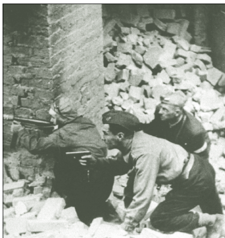
Viršuje: pasipriešinimo kovotojai iš lenkų Armijos Krajovos 1944 m. mūšyje per Varšuvos sukilimą.

Akivaizdu, kad priešintis buvo pavojinga. Žmones, kuriuos įtardavo dalyvaujant Pasipriešinimo judėjime, kankindavo ir, jei nepamerkdavo mirti, tai bent jau išsiųsdavo į koncentracijos stovyklas. Kasdien buvo vykdomos žiaurios masinės represijos prieš pasipriešinimo kovotojų bendruomenes. Todėl nenuostabu, kad imta gerokai aktyviau priešintis tik tada, kai jau beveik nebeliko abejonių, jog Vokietija pralaimės, be to, didžiausią aktyvumą tuo metu rodė nebūtinai tie, kurių nuopelnai judėjimui buvo didžiausi.