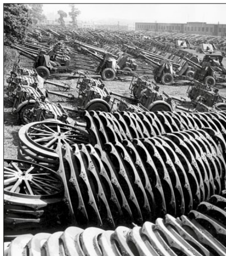
Viršuje: vienas didžiausių laikinųjų ginkluotės sandėlių Didžiojoje Britanijoje, kurį įrengė Sąjungininkai, ruošdamiesi D dienai.

Oro desanto divizijos užėmė daugumą numatytų objektų. Jos sugebėjo sužlugdyti galimas priešo kontratakas. „Omahos“ paplūdimyje, kur vokiečiai priešinosi įnirtingiausiai, Sąjungininkai patyrė daugiausia nuostolių. Kurį laiką atrodė, kad čia nepavyks išsilaipinti, tačiau dienai baigiantis paplūdimio ruožas buvo įveiktas. „Jutos“