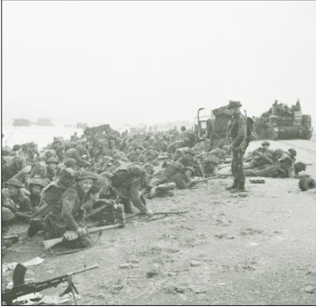
Viršuje: britų komandosų dalinys „Kardo“ paplūdimyje laukia įsakymo veržtis gilyn į žemyną.

Nors vokiečiai žinojo, kad Sąjungininkai ruošiasi išsilaipinti, neturėjo tikslios informacijos nei apie vietą, kur ketinama išsilaipinti, nei apie kovinę ir skaitinę išsilaipinšančių dalinių sudėtį. Feldmaršalas Ervinas Rommelis dabar vadavo Vokietijos pajėgoms Prancūzijos šiaurėje. Jis buvo įsitikinęs, kad liko vienintelė galimybė – nugalėti išiveržusias pajėgas, joms dar neišsilaipinus į krantą. Jis norėjo išdėstyti savo rezervus pakrantėje taip, kad jie galėtų iš karto atakuoti priešo desantą, nes suprato, jog dėl Sąjungininkų aviacijos bus gerokai sunkiau perdislokuoti šiek tiek labiau nutolusius dalinius.