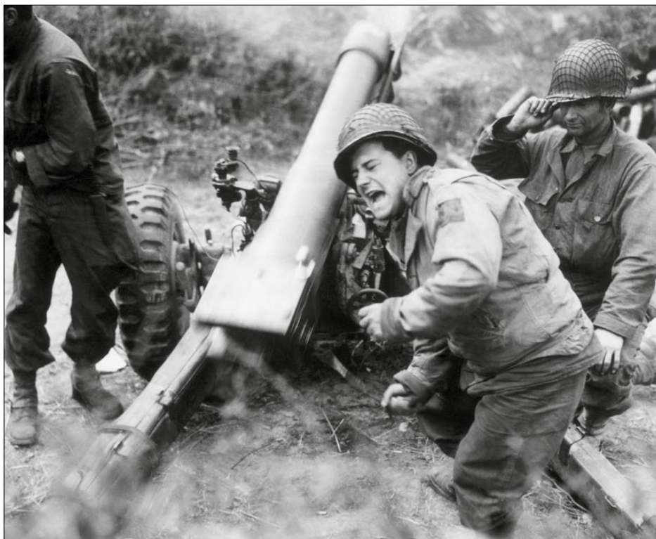
Viršuje: JAV lauko artilerijos skyrius mūšyje netoli Normandijos miesto Karantano 1944 m. liepą.

Visas Sąjungininkų sausumos pajėgas (britus, amerikiečius ir kanadiečius) kontroliavo generolo Montgomerio vadovaujama 21-oji armijų grupė. Montgomeris tikriausiai geriau nei bet kuris kitas Sąjungininkų generolas suprato, kad Normandijos operacija bus sėkminga tik tuo atveju, jei Sąjungininkai turės aiškų planą, kaip prasiveržti iš applūdimųjų į žemyno gilumą.