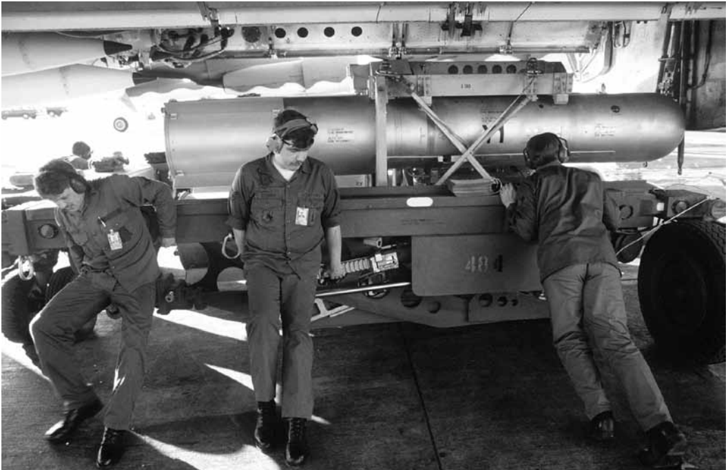
8 skyrius. Aptarnaujantys technikai iškrauna MK-28FI termobranduolinę bombą iš strateginio bombonešio B-52H Elsverto oro pajėgų bazėje, Pietų Dakotoje, 1984 m.