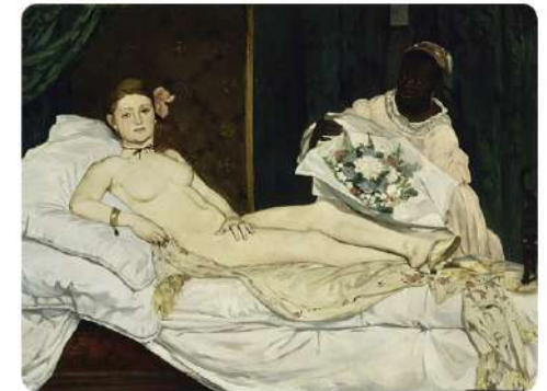
Eduaro Manė paveikslas „Olimpija“, 1863 m.

Olimpija. Aleksandras Makedonietis (Aleksandros Makedonikos, 356–323 m. pr. Kr.) buvo Makedonijos karaliaus Pilypo II (Philippos, apie 382–336 m. pr. Kr.) ir Epyro princesės Olimpiados (Olympias, apie 375–apie 316 m. pr. Kr.) sūnus. Jungtinių Amerikos Valstijų Vašingtono valstijos sostinė, įkurta 1859 m., dėl šiaurėje esančio Olimpo kalno pavadinta Olimpija. „Olimpija“ – vienas žymiausių prancūzų dailininko Eduaro Manė (Édouard Manet, 1832–1883) paveikslų, kuriame vaizduojama nuoga moteris. Šis paveikslas siejamas su italų Renesanso dailininko Ticiano (Tiziano, apie 1485–1490) „Urbino Venera“, tik E. Manė paveiksle Ticiano moters grožio idealą pakeitė Paryžiaus prostitute, ištikimybę simbolizuojantį šunį – nepriklausomumą simbolizuojančią katę, o tarnaites, besirausiančias kraičio skrynioje, – juodaode tarnaitę.