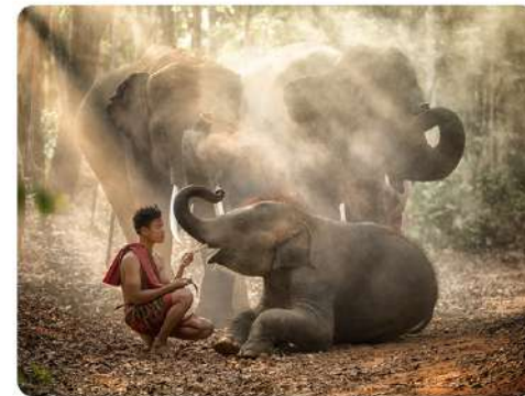
Mahutas ir drambliai

su šio gyvūno elgsena, priežiūra ir pan. Tokios gyvūno ir žmogaus draugystės įprastai trunka visą jų gyvenimą.