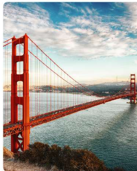
Auksinių Vartų tiltas, San Fransiskas, JAV

227 m. Spalva, kuria nudažytas šis statinys, pavadinta tarptautine oranžine. Ši egzistavo dar prieš jį pastatant ir iki šiol yra naudojama aviacijos, kosmoso pramonėje norint išskirti daiktus iš aplinkos. Šiek tiek panaši į saugos oranžinę, tačiau sodresnė ir rausvesnio tono.