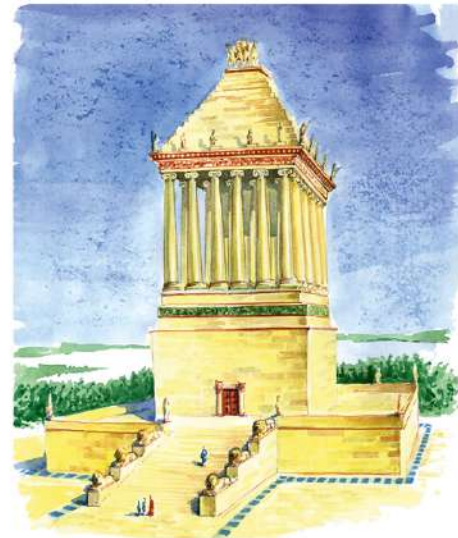
Nežinomo autoriaus piešinys „Mauzoliejus Halikarnase“

Mikelandželas (Michelangelo, 1475–1564) – italų Renesanso dailininkas, laikomas vienu iškiliausių visų laikų menininkų. Nutapyti freską „Paskutinis teismas“ užsakė popiežius Klemensas VII (Clemens VII, 1478–1534). Mikelandželas darbų ėmėsi 1534 ir baigė 1541 m., menininkui tuo metu buvo 67-eri. Freska Vatikano Siksto koplyčioje užima visą altorinę sieną. Tapydamas „Paskutinį teismą“ menininkas rėmėsi Šv. Jono pranašystėmis ir Dantės Aligjerio (Dante Alighieri, 1265–1321) „Dieviškosios komedijos“ vaidiniais. Freskoje vaizduojama krikščioniškoji pranašystė apie Paskutinio teismo dieną.