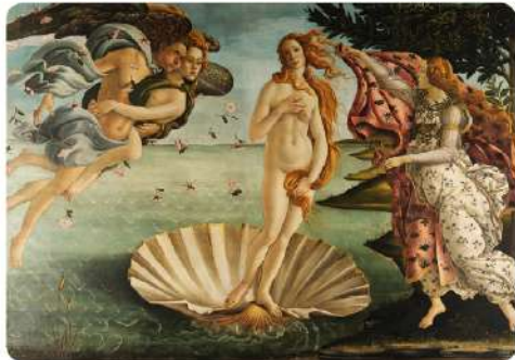
Sandro Botičelio paveikslas „Veneros gimimas“, apie 1485 m.

Ant jūros kriauklės. Italų Renesanso dailininko Sandro Botičelio (Sandro Botticelli, 1445–1510) paveikslas „Veneros gimimas“ yra vienas garsiausių kūrinių Vakarų meno istorijoje. Paveiksle vaizduojama, kaip jūroje gimusi Venera atplukdoma kriauklėje į Kipro salos krantą. Kriauklę į krantą atveja vėjai Zefyras ir Aura. Aplink Venerą krinta vėjų blaškomos gėlės. Savo nuogumą deivė prisidengia rankomis.