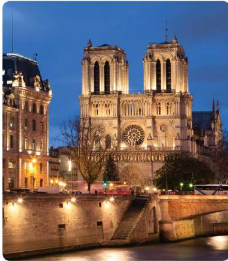
Paryžiaus Dievo Motinos katedra, Prancūzija

ir apylinkes kaip savo kūrinio veiksmo vietą pasirinko garsus prancūzų rašytojas Viktoras Hugo (Victor Hugo, 1802–1885). Jo aprašyta tragiška čigonų pagrobts ir išaugintos mergaitės Esmeraldos meilės istorija „Paryžiaus katedra“ buvo išleista 1831 m. Miuziklas „Paryžiaus katedra“ publikai pristatytas 1998 m.