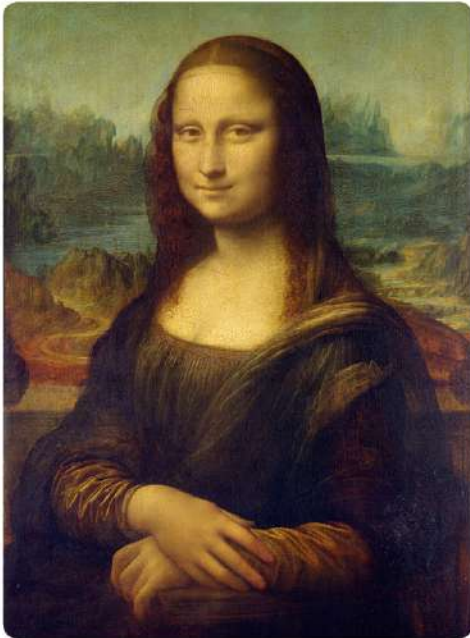
Leonardo da Vinčio „Mona Liza“, apie 1503–1506 m.

Paveikslas „Mona Liza“. Po vagystės iš Luvro muziejaus tūkstankiai prancūzų ir turistų plūdo su gelėmis, rašteliais prie tos vietos, kur kabėjo Renesanso genijaus Leonardo da Vinčio (Leonardo da Vinci, 1452–1519) nupytas portretas. Vagyste buvo įtariamas net Pablas Pikasas (Pablo Picasso, 1881–1973), nes jis ne kartą buvo pirkęs kitus iš Luvro pavogtus kūrinius ir pričiuptas. Tikrasis vagis paaiškėjo po 2 metų. Tai buvo Luvre dirbęs italas, kuris paveikslą išnešė paslėpęs po savo drabužiais. Kaip vagystės priežastį jis įvardijo norą grąžinti „Moną Lizą“ jos tėvynei Italijai.