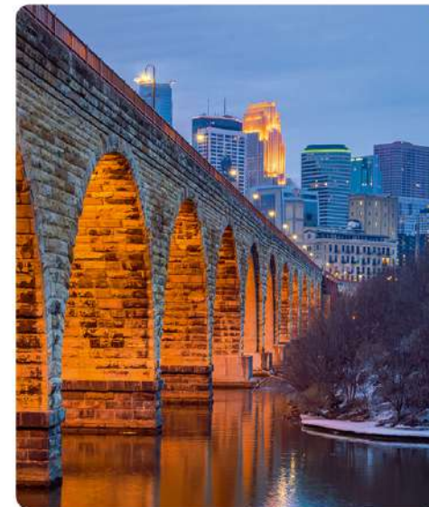
Mineapolio miesto panorama, Minesota, JAV

Mineapolis turi net 2 pravardes. Jis vadinamas Ežerų miestu, nes miesto teritorijoje šių vandens telkinių yra net 22. Vietiniai dėl panašumo į Niujorką Mineapolį dar vadina Mažuoju obuoliu. Tikrasis miesto pavadinimas kildinamas iš žodžių minne (išvertus iš Dakotos čiabuvių kalbos reiškia „vanduo“) ir polis (išvertus iš senovės graikų kalbos reiškia „miestas“).