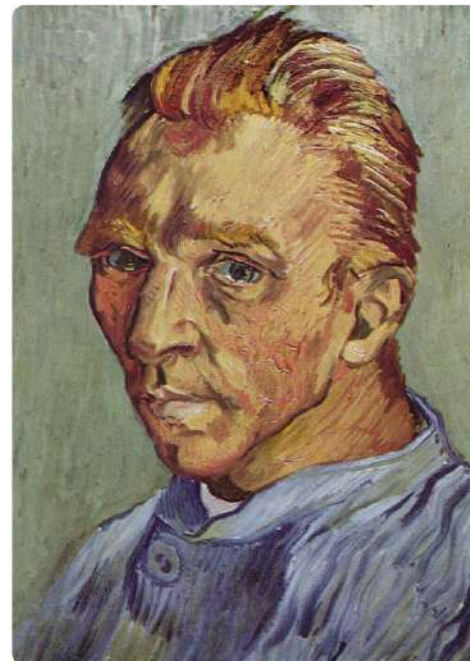
Vinsento van Gogo autoportretas, 1889 m.

Barzdos. Garsaus olandų postimpresionisto Vinsento van Gogo (Vincent van Gogh, 1853–1890) „Autoportretas be barzdos“ sukurtas 1889 m. Paveikslą autorius padovanojo motinai kaip gimtadienio dovaną. Šis autoportretas yra vienas brangiausių visų laikų paveikslų, 1998 m. Niujorke parduotas už 71,5 mln. JAV dolerių. Yra žinomi net 35 šio tapytojo autoportretai. Teigiama, kad dailininkas save dažnai tapė ne iš meilės sau, o stokodamas modelių ir norėdamas tobulinti žmogaus piešimo techniką.