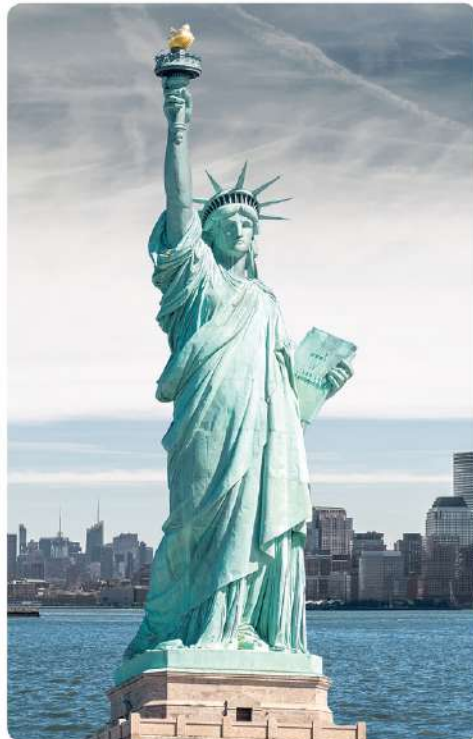
Laisvės statula, Niujorkas, JAV

Laisvės statula. Ji vaizduoja stolą (senovės romėnių drabužis) vilkinčią moterį su karūna. 7 karūnos spygliai simbolizuoja 7 jūras ir žemynus. Kairėje rankoje prie savo kūno moteris laiko lentelę, o dešinėje – iškeltą fakelą. Skulptūrą Jungtinėms Amerikos Valstijoms nepriklausomybės šimtmečio proga padovanojo Prancūzija. Niujorko Aukštutinėje įlankoje, Liberty saloje stovinti iš vario pagaminta statula yra 46 m, o kartu su postamentu jos aukštis 93 m. Jos dizainą sukūrė prancūzų skulptorius Frederikas Ogiustas Bartoldis (Frédéric-Auguste Bartholdi, 1834–1904), o vidaus karkasą – inžinierius ir architektas Giustavas Aleksandras Eifelis (Gustave Alexandre Eiffel, 1832–1923).