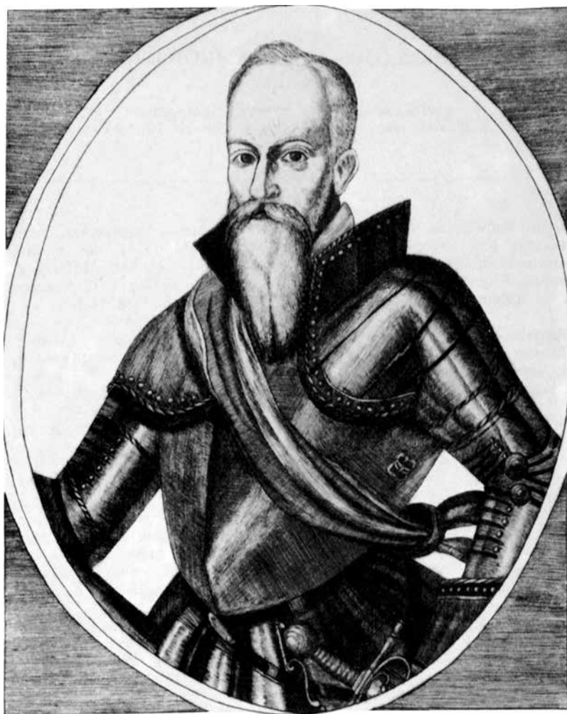
Mikalojus Radvila Rudasis