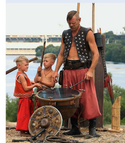
Berniukai noriai perima tėvų tradicijas

– Kazoką auklėja ne tik tobuli ginklai ir techninis pasiruošimas. Svarbu, ką jis turi širdy ir kokią žinią neša visiems: mes, kazokai, esame iš šios žemės, čia mūsų šaknys, namai, mūsų niekas nugalės!