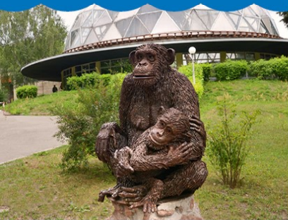
Kijevo zoologijos sodas