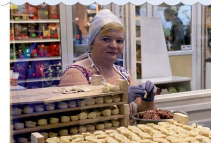
Tikri rankų darbo koldūnai, kurių gali nuspirti čia pat, turguje