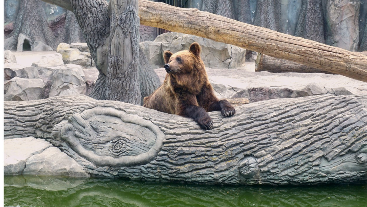
Rudosis meškos jaučiasi labai patogiai

klį, dar neturintį gražios, suaugusiems šios rūšies ropliams būdingos spalvų paletės. Ir balinis vėžliukas – tik mažas egzempliorius.