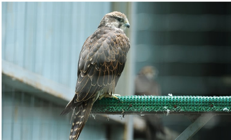
Kijevo zoologijos sode užaugęs taurasis sakalas

Pirmosiomis dienomis keliautojai matė žalčius – geltonskruosčius, kaip ir Lietuvoje. Zoologijos sode jie tikėjosi išsvysti visas Ukrainos roplių rūšis – raštuotąjį, eskulapo žalčius, dar vandeninį, stepinę angį... Deja, čia pavyko rasti tik raštuotojo žalčio jauni-