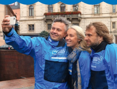
Ekspedicijos dalyviai linksmai nusiteikę traukia turgaus link

Sakoma: jei nori pajusti tautos charakterį, nueik į turgų. O nacionalinė ekspedicija visada domisi ne tik tautomis ir jų charakteriu, bet ir skoniais, susipažįsta su nacionalinėmis ir istorinėmis virtuvėmis, ragauja patiekalų, apie kuriuos galima sužinoti tik iš knygų. Taigi tokias patirtis nutarta tęsti ir Ukrainoje. O kur dar pažintys mezgasi geriau nei turguje?