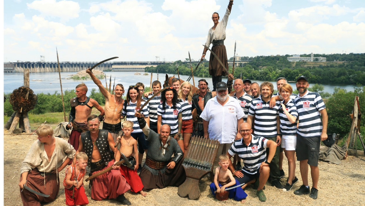
Ekspedicijos dalyviai kartu su Zaporožės kazokais