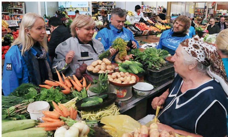
Lvovo turguje su džiaugsmu prie lašinių buvo pirkti agurkų, trešnių, abrikosų, voveraičių

Patyrę pirkimo džiaugsmą, keliautojai skuba į dar vieną Lvovo turgų – Krokuvos ( Krakowski ) ir čia atranda įdomią tendenciją – kainos čia žemesnės, bet... Vos išvydę