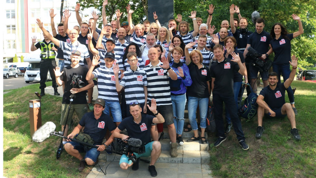
Nacionalinės ekspedicijos dalyviai pradeda kelionę iš Vilniaus