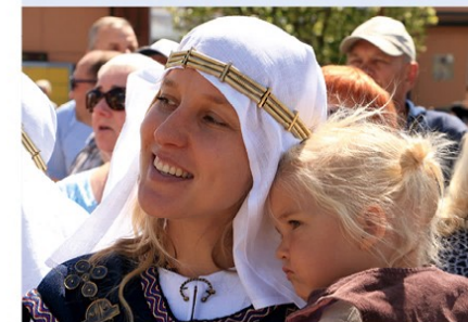
Lazdijuose juos išlydėjo tautiškai pasipuošę ir šventiškai nusiteikę gerbėjai