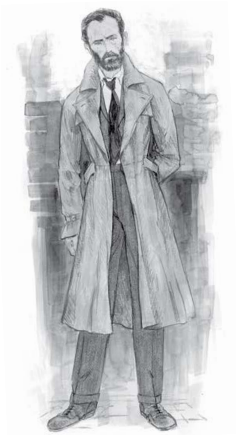
(viršuje) ALBO DUMBLDORO KOSTIUMO ESKIZAS (kitame puslapyje) PRELIMINARI ALBO DUMBLDORO BYLOS ILIISTRACIJA, PALIKTA VIETOS JUDANČIAI NUOTRAUKAI