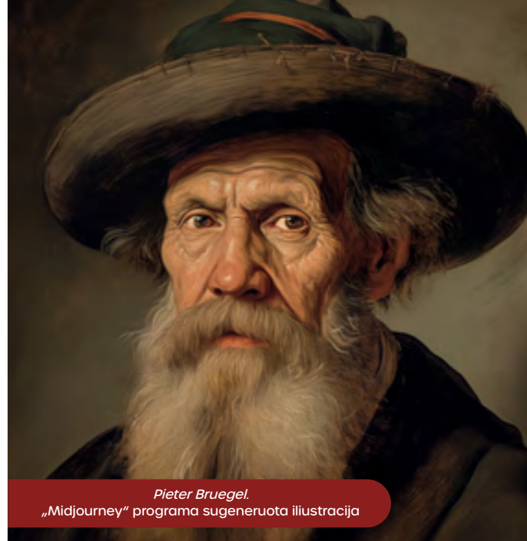
Pieter Bruegel. „Midjourney“ programa sugeneruota iliustracija

– Man šalta net žiūrėti į šitą vaizdą, – siurbtelėjęs maloniai gvazdikėliais kvėpiančio karšto vyno į susirinkusiuosius atsisuko juodai apsirengęs vyras. Priešais paveikslą jis stovėjo vienas, kiti pirklio svečiai stengėsi laikytis atokiau.