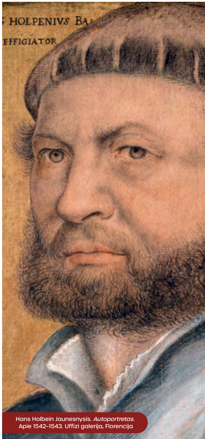
Hans Holbein Jaunesnysis. Autoportretas . Apie 1542–1543. Uffizi galerija, Florencija

Pranciškus I su Henriku VIII buvo ne tik varžovai, bet ir savotiški diplomatiniai bičiuliai – 1518 metais jie sutarė vienas pas kitą įkurti ambasadas. Todėl nenuostabu, kad kylant įtampai prancūzai Londone norėjo turėti akis ir ausis. 1531 metais Prancūzijos karaliaus ambasadoriumi Londone paskiriamas Jeanas de Dinteville'is,