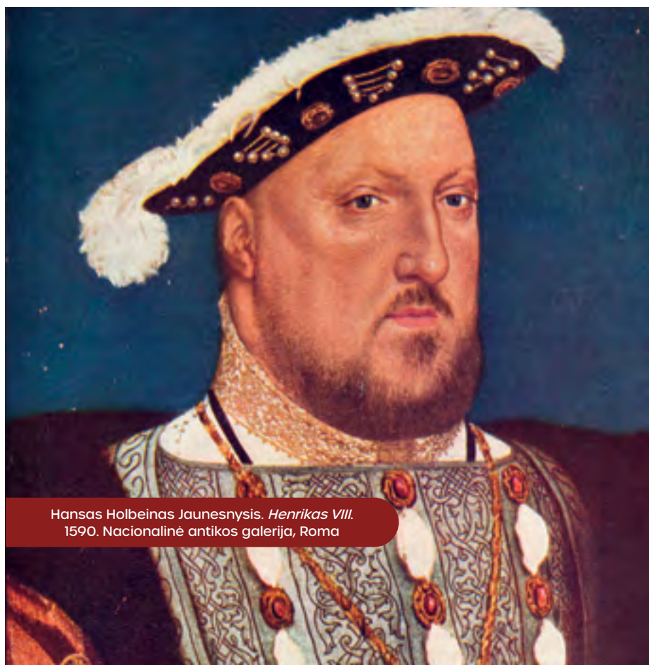
Hansas Holbeinas Jaunesnysis. Henrikas VIII . 1590. Nacionalinė antikos galerija, Roma

Henrikas VIII siunta, keičia patarėjus, kol pagaliau atsirenka tokius, kurie sako: „Jeigu taip, tai bala nematė.“ Jie ragina karalių ne tik mesti Aragonietę į šoną, bet ir apskritai atsiskirti nuo katalikų bažnyčios ir įkurti protestantišką Anglikonų Bažnyčią. Situaciją įdėmiai stebi ne tik Romos popiežius su imperatoriumi Karoliu V, bet ir Prancūzijos karalius Pranciškus I, kuriam irgi visiškai nesinori, kad protestantizmas įkeltų koją į Angliją arba kad nuo Romos nutrūkusi Anglija suartėtų su Prancūzijos priešu – imperatoriumi Karoliu V.