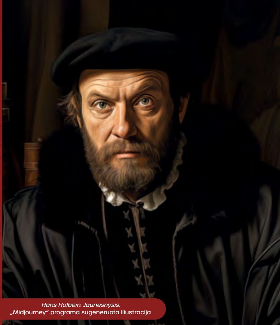
Hans Holbein. Jaunesnysis. „Midjourney“ programa sugeneruota iliustracija

Tai vienas įdomiausių XVI amžiaus darbų – 1533 metais Hanso Holbeino Jaunesniojo nutapytas paveikslas „Ambasadoriai“. Šis meno kūrinys kupinas keistų simbolių ir dviprasmybių, dėl kurių ir šiandien galvas laužo dailės istorikai. Paveikslas „Ambasadoriai“ eksponuojamas Nacionalinėje galerijoje Londone.