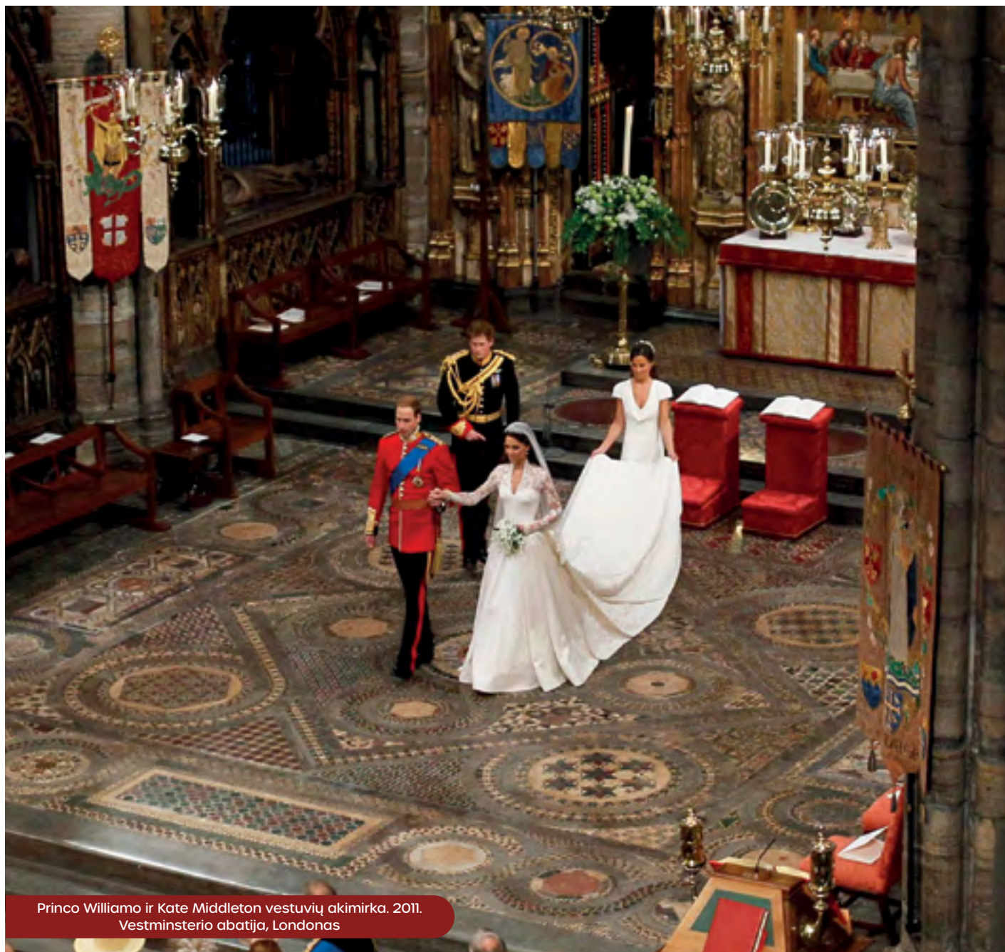
Princo Williama ir Kate Middleton vestuvių akimirka. 2011. Vestminsterio abatija, Londonas