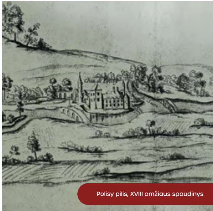
Polisy pilis, XVIII amžiaus spaudinys

Tačiau Renesanso laikais vyriška draugystė buvo suprantama kiek kitaip nei dabar. Intymūs pokalbiai, bučiniai ir miegojimas vienoje lovoje buvo suprantama kaip „kūno dovanos“. Toks homoerotizmas buvo visuotinai priimtinas, skirtingai nuo homoseksualumo stigmatos tais laikais. Portrete jiedu nedemonstruoja vienas kitam jokių šiltų jausmų. Tad šių vyrų tarpusavio ryšys lieka mįslė. Be to, paveiksle jie tarsi atstovauja skirtingiems dalykams.