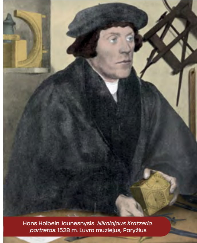
Hans Holbein Jaunesnysis. Nikolajaus Kratzerio portretas . 1528 m. Luvro muziejus, Paryžius

Taigi viršutinė daiktų eilė simbolizuoja dangiškąjį pradą. Tačiau tai dar ne viskas. Išstudijavę instrumentus mokslininkai teigia, kad jie tiesiogiai ar netiesiogiai rodo tą pačią datą – 1533 metų balandžio 11 dieną, o tai yra – koks netikėtumas – Didysis Penktadienis prieš Velykas.