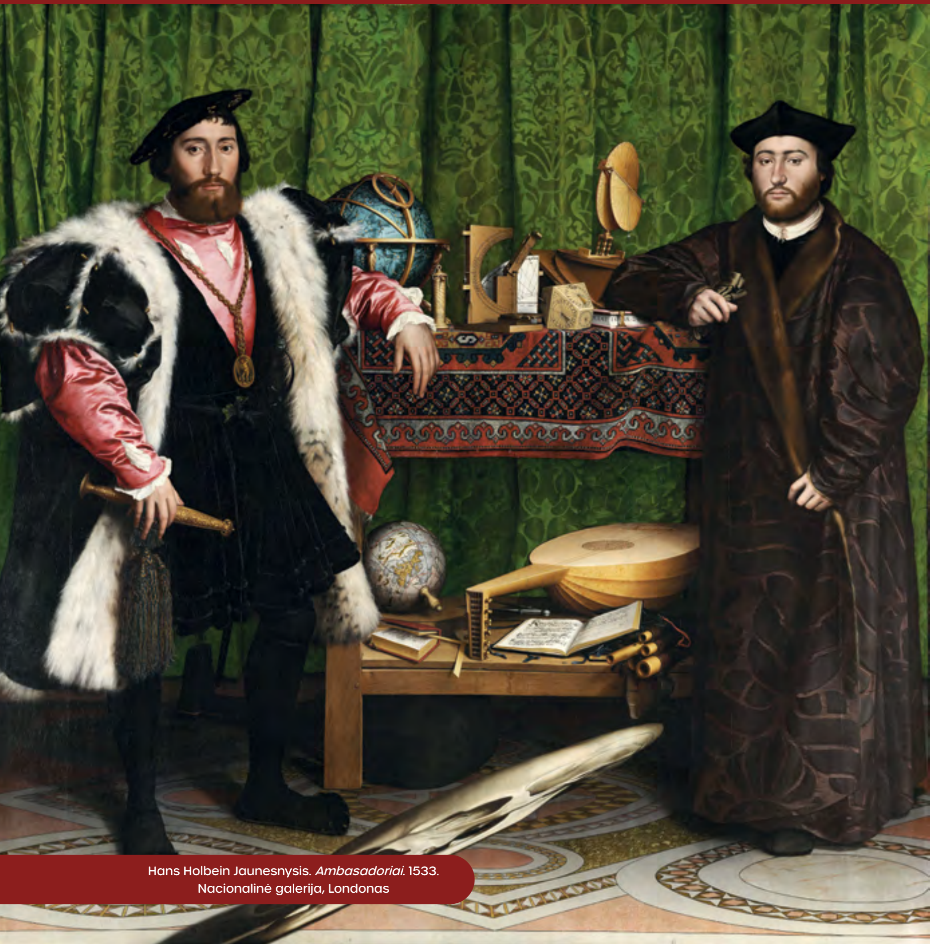
Hans Holbein Jaunesnysis. Ambasadoriai . 1533. Nacionālā galerija, Londonas