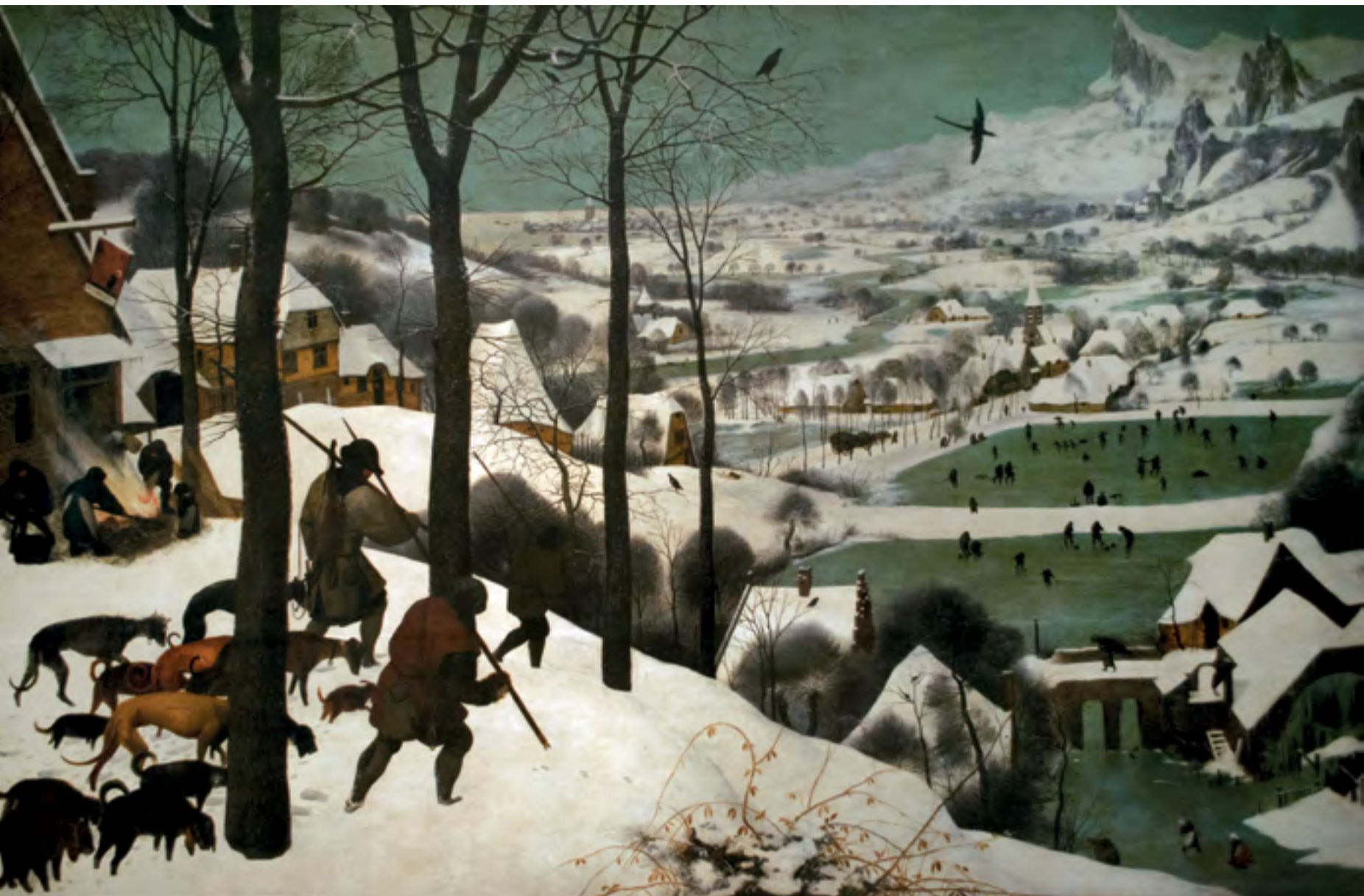
Pieter Bruegel (vyresnysis). Medžiotojai sniege / Žiema . 1565. Meno istorijos muziejus, Viena