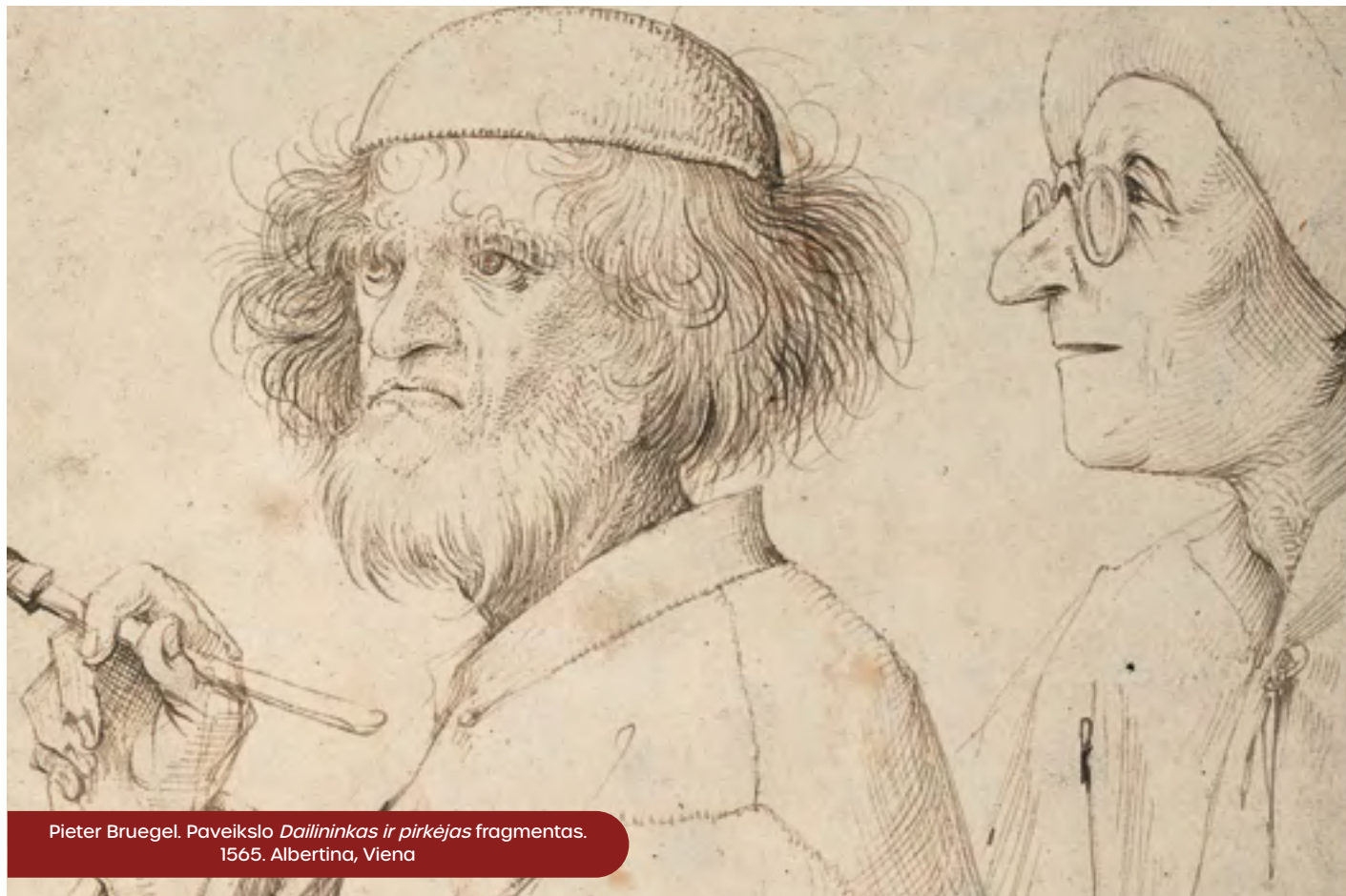
Pieter Bruegel. Paveikslas Dailininkas ir pirkėjas fragmentas. 1565. Albertina, Viena

Pieteris Bruegelis turėjo net kelias pravardes. Labiausiai prilipo „Valstietis Bruegelis“ dėl jo pomėgio tapyti valstiečių, į kuriuos tuo metu nei aristokratai, nei buržua nekreipė dėmesio, kasdienybę. Taip dailininkas atliko tam tikrą šviečiamąją misiją – rodyti savo klientams ir jų draugams, kad valstiečiai yra tokie pat žmonės, turintys tokių pačių džiaugsmų, vargų ir ritualų.