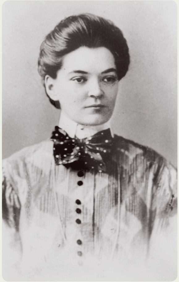
Šatrijos Ragana. Apie 1906 m.