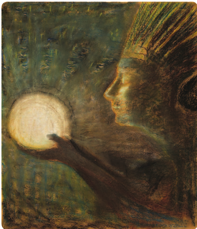
Mikalojus Konstantinas Čiurlionis. „Bičiulystė“, 1907 m.