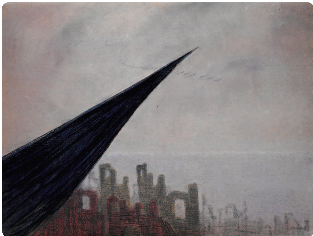
Mikalojus Konstantinas Čiurlionis. „Liūdesys“, 1907 m.

Pamėginkite sukurti galimą šio pasakojimo tęsinį. Pasvarstykite, kaip toliau galėtų elgtis Irka? Kaip dramatiškas sukrėtimas pakeičia jos gyvenimą ir požiūrį į pasaulį.