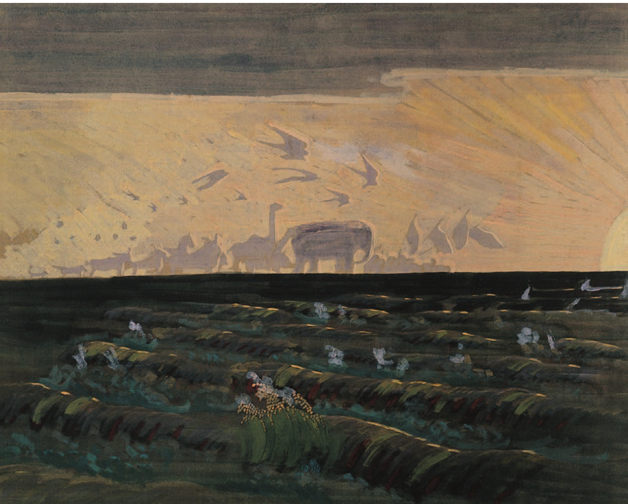
Mikalojus Konstantinas Čiurlionis. „Saulės pagarbinimas“, 1909 m.

Skaitysime seniai – 1924 metais – Šatrijos Raganos parašytą, to meto vaikams ir jaunimui skirtą kūrinį. Iš jo pažinsime XX amžiaus pradžios Lietuvos žmonių gyvenimą, jų jausmus ir mintis. Susitiksime su mergaite, kuri auga sename dvare, prižiūri ma tarnaitės, ir ilgisi Kaunė, tuometinėje Lietuvos sostinėje, gyvenančio tėvelio.