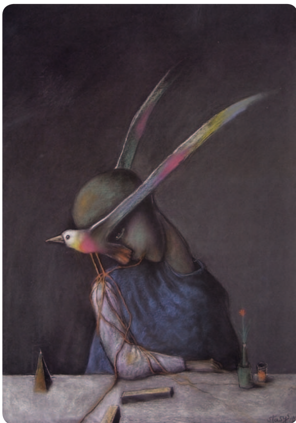
Stasys Eidrigėvičius. „Pakelti sparnai“, 1985 m.