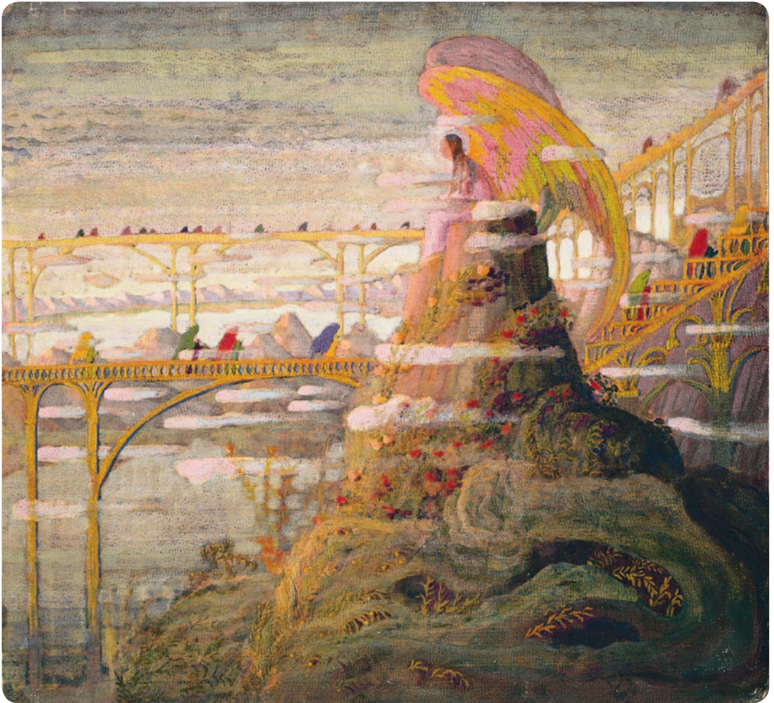
Mikalojus Konstantinas Čiurlionis. „Angelas“, 1909 m.