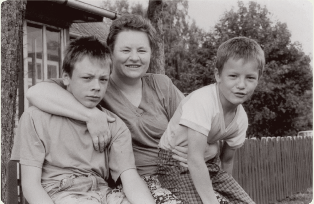
Vanda Juknaitė su sūnumis, 1992 m.

Vánda Juknáitė (g. 1949 m.) – žinoma lietuvių rašytoja, universiteto dėstytoja, išugdžiusi ne vieną būsimų mokytojų kartą, skyrusi daug dėmesio beglobiams Lietuvos vaikams.