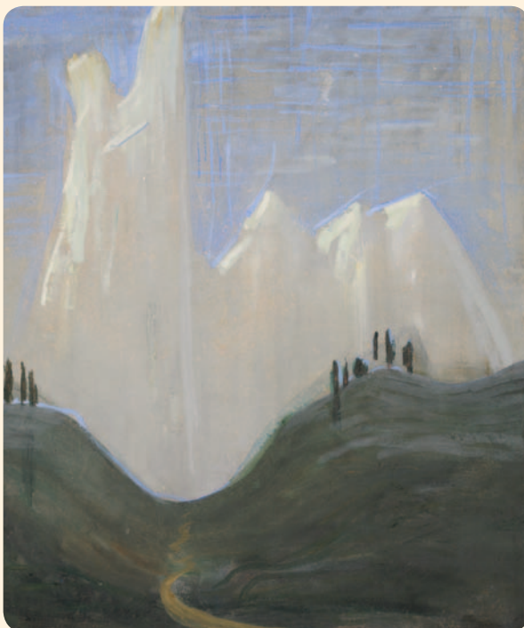
Mikalojus Konstantinas Čiurlionis. „Mano kelias“, 1907 m.

Aptarkite savo ir draugų rašinius grupėse.