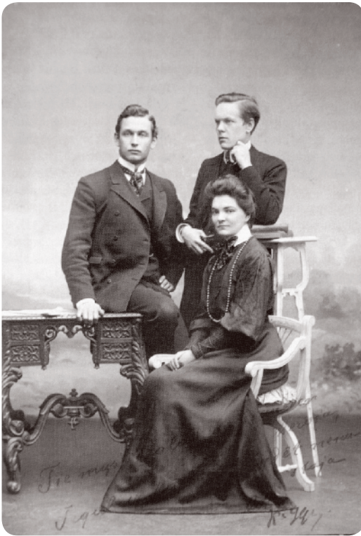
Šatrijos Ragana su mokslo draugas Šveicarijoje, apie 1906 m.

šeima, tėvui išvažiavus dirbti į užsienį. Šatrijos Ragana vaikams rašė ir apie Lietuvos praeitį. Jos „Lietuvės senovės istorijos pasakojimus“ daug dešimtmečių skaitė vaikai ir jaunimas.