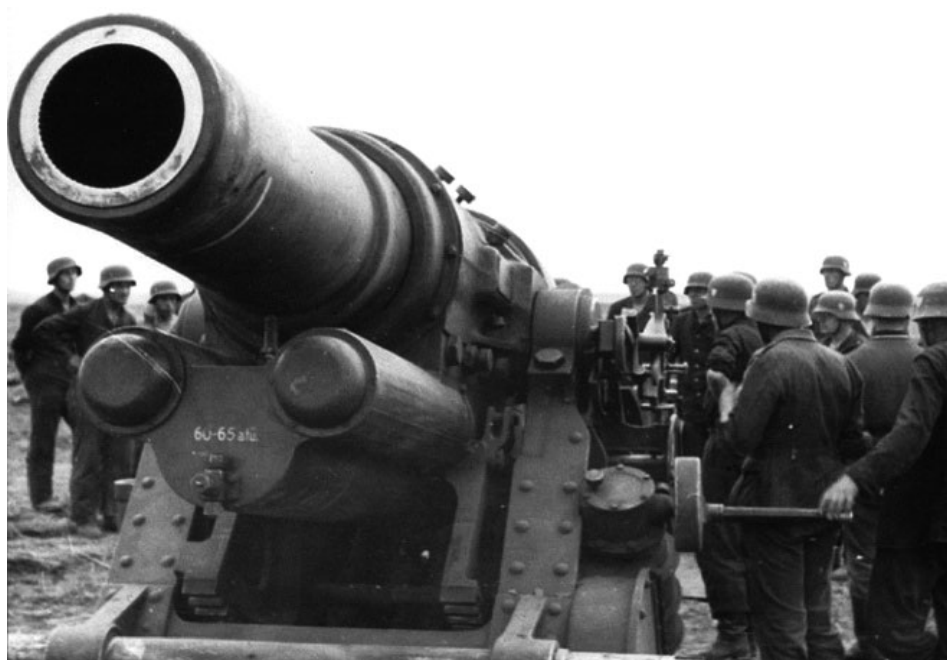
Vokiečių sunkioji artilerija Kryme.

Hitlerio nurodytų priežasčių, dėl kurių reikėjo ginti „Krymo tvirtovę“, nebuvo galima atmesti lengva ranka. Apie rugpjūčio vidurį jis