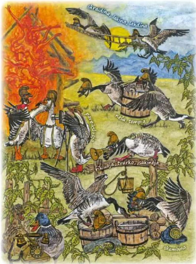
gaisrininkai žąsinai. – Ei! Skubėkite čionai! – iš aukštybių antims šaukia.