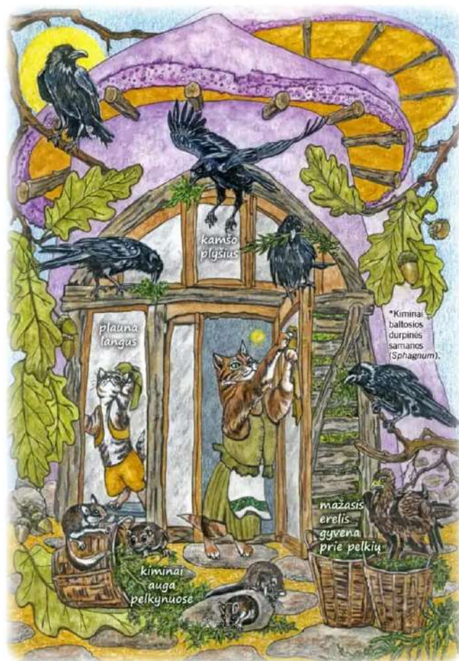
plyšius kiminiais* užkišo...