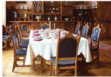
Rokiškio dvaro rūmų valgomas

Rokiškis rašytiniuose šaltiniuose pirmą kartą paminėtas 1499 m. Nepraėjęs nė 20 metų čia šeiminkauti ėmė didikai – iš pradžių kunigaikščių Krošinskių giminė, o vėliau, praėjus 200 metų, – ir grafai Tyzenhauzai. 1925 m. dokumentuose paminėta pieninė, kuri vėliau išaugo iki sūrio gamyklos ir iki pat šių dienų garsina Rokiškį.