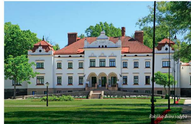
Rokiškio dvaro sodyba

Rokiškio Šv. apaštalo evangelisto Mato bažnyčios muziejuje-lobyne galima susipažinti su daugiau nei 150 brangių eksponatų, kuriuos per ilgus metus sukaupe Tyzenhauzų giminė. Visos lobyno vertybės yra įtrauktos į Kultūros vertybių registrą.