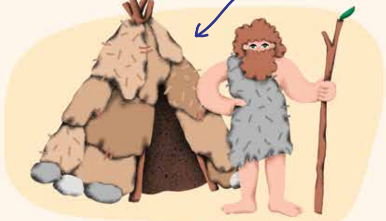
Pirmųjų gyventojų būstas

Ar gali įsivaizduoti, kaip Lietuva atrodė prieš maždaug 13 tūkstančių metų?