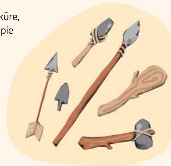
Pirmųjų gyventojų ginklai ir įrankiai

Gal domiesi archeologija? Suskaičiuok, kiek ir kokių daiktų turi turėti archeologai, ieškodami iškasenų.