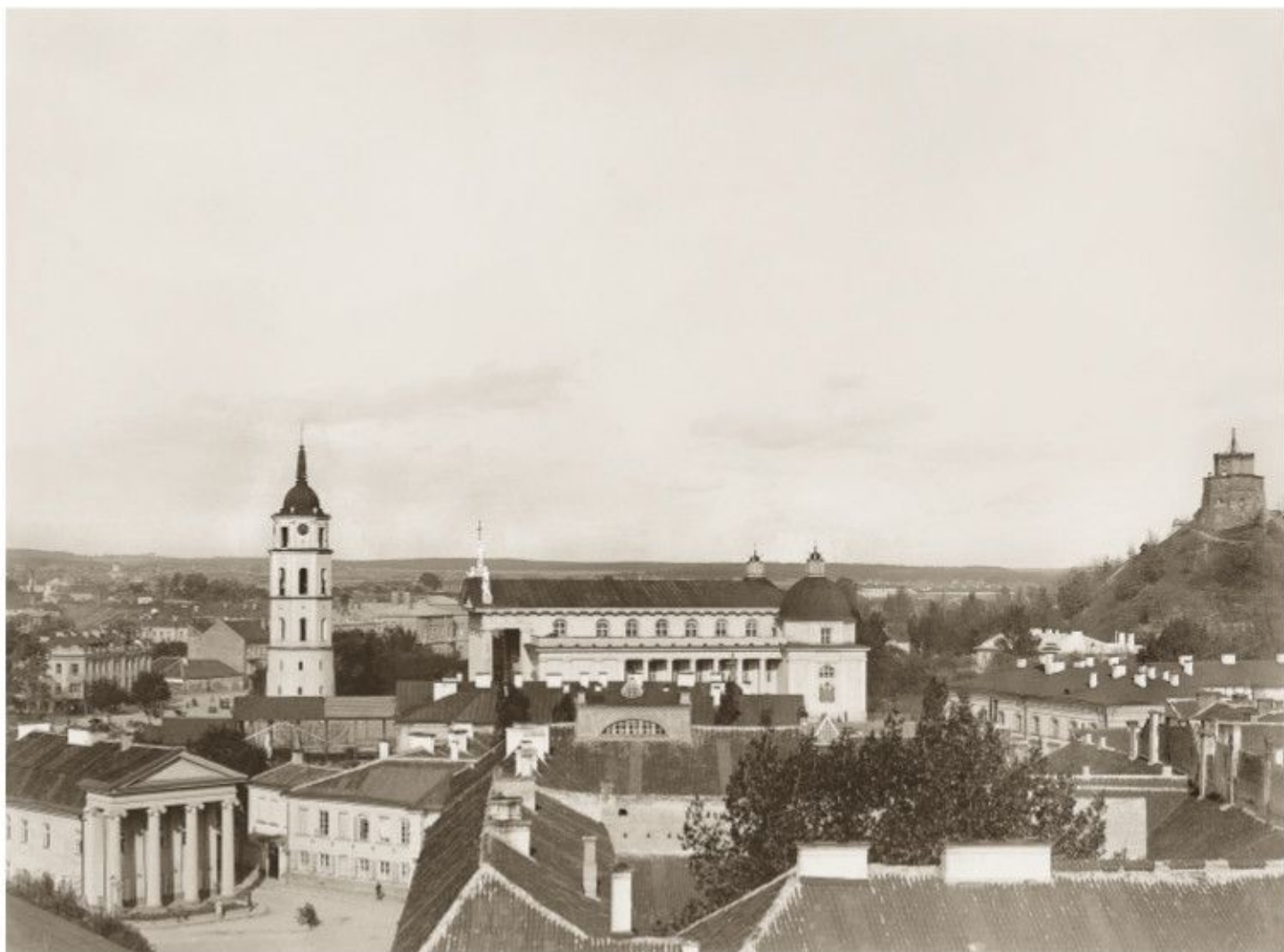
Vilnius panorama. XX a. pr.