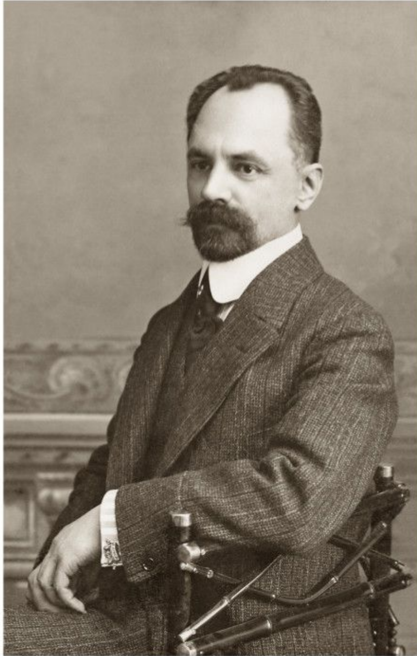
Donatas Malinauskas (1869–1942), visuomenės veikėjas, Lietuvos Nepriklausomybės Akto signataras. Apie 1910 m.