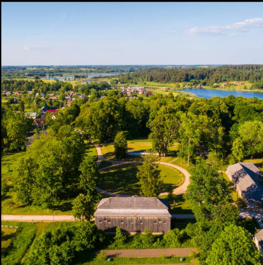
Kurtuvėnų dvaras. Kurtuvėnų dvaras daugiau nei 400 m. buvo regiono kultūrinis ir ekonominis centras. Dvaro pastatų ansamblyje vertingiausias išlikęs XVIII a. barokinis medinis svimas.

Kurtuvėnai Manor. Kurtuvėnai manor has been the cultural and economic centre of the region for more than 400 years. The most valuable of all the manor buildings in the ensemble is the 18th century baroque wooden barn.