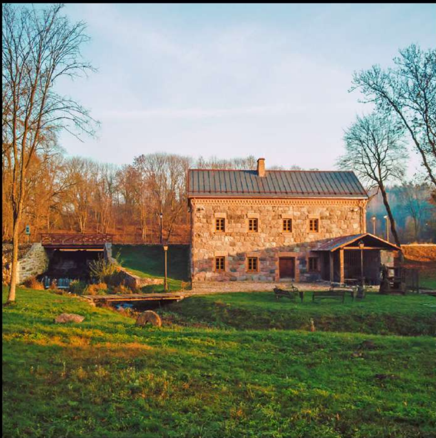
Liubavo dvaras. Tai vienas seniausių Lietuvos dvarų, minimas jau nuo XVI amžiaus. Restauruotame dvaro malūne-muziejuje galima išvysti tradicinę technologinę įrangą.

Liubavas Manor. This is one of the oldest manors in Lithuania, first mentioned in the 16th century. In the restored mill-museum of the manor, you can now see traditional technological equipment.