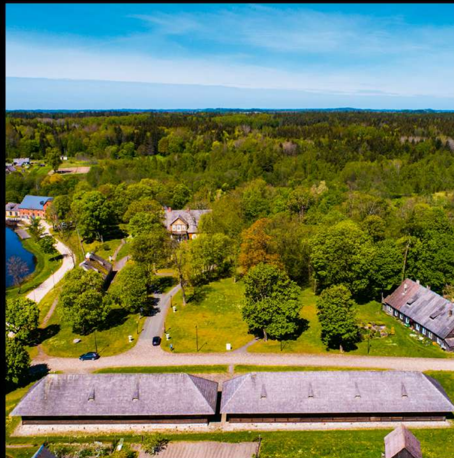
Biržuvėnų dvaras. Mediniame XVIII–XIX a. dvare įkurta muziejinė ekspozicija, vyksta parodos, renginiai. 2005 m. dvaro sodyboje buvo iškastas grafų Gorskųjų porcelianas.

Kurtuvėnai Manor. Kurtuvėnai manor has been the cultural and economic centre of the region for more than 400 years. The most valuable of all the manor buildings in the ensemble is the 18th century baroque wooden barn.