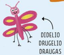
DIDELIO DRUGELIO DRAUGAS