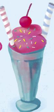
DANGIŠKAS DESERTAS DVIEM