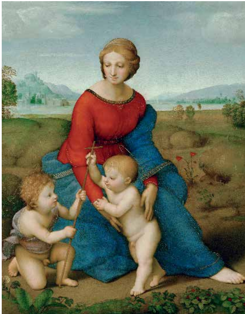
17 Rafaelis. Šv. Mergelė pievoje. 1505–1506. Lenta, aliejus; 113×88. Viena, Meno istorijos muziejus

dailininką. Jie jam buvo savaime suprantami. Bet jis daug kartų bandė deramai sukombinuoti figūras, taip jas išdėstyti, kad jos susijungtų į darnią visumą. Kairiajame kampe esančiame greitosiomis padarytame eskize jis bandė pavaizduoti Kūdikėlį Jėzų, žengiantį tolyn nuo motinos, bet pakėlusį ir pasukusį galvą, kad pažiūrėtų į ją. Dailininkas vienaip ir kitaip bandė pakreipti motinos galvą, norėdamas, kad jos judesys geriausiai atlieptų vaiko judesį. Paskui nusprendė apsukti vaiką, kad šis žvelgtų tiesiai į motiną. Pabandė komponuoti ir kitaip – nupiešė ir kūdikėlį šv. Joną, bet, užuot