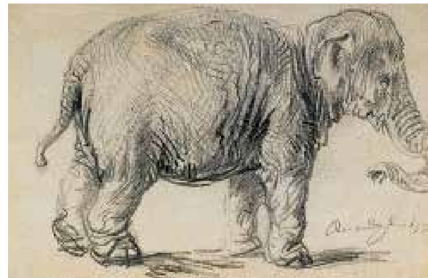
10 Rembrantas van Reinas. Dramblys . 1637. Popierius, juoda kreida; 23×34. Viena, Albertina

Tačiau ne eskiziškumas labiausiai kliūva žmonėms, kurie mėgsta „tikroviškus“ paveikslus. Juos labiau atstumia tie darbai, kurie jiems atrodo netaisyklingai nupiešti, ypač jeigu tai naujųjų laikų kūriniai, kai dailininkas turėjo „geriau mokėti“ piešti. O iš tiesų nieko paslaptinga nėra tuose natūros iškraipymuose, dėl kurių vis dar dejuojama modernaus meno aptarimuose. Tai puikiai supras kiekvienas, kas bent kartą yra matęs Disnėjaus (Disney) filmą ar komiksą. Jis žino, kad kartais geriau piešti daiktus kitaip, negu jie atrodo tikrovėje, geriau juos vienaip ar kitaip deformuoti. Peliukas Mikis nelabai panašus į tikrą pelę, bet žmonės nerašo laiškų, piktindamiesi jo uodegos ilgiu. Ižengę į užburėtą Disnėjaus pasaulį,