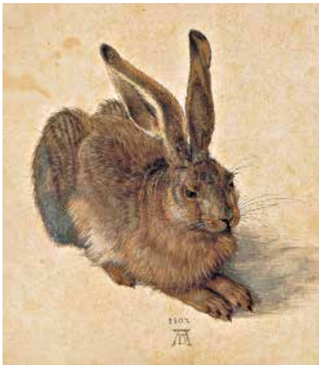
9 Albrechtas Diureris. Kiškis . 1502. Popierius, akvarelė ir guašas; 25×22,5. Viena, Albertina

kur žmonės nieko nežino apie Meną . Tačiau net jei mums ir patinka stipri jausmo išraiška, neturėtume nusigręžti nuo tų darbų, kuriuose ji ne tokia akivaizdi. Viduramžių italų tapytojas, nutapęs Nukryžiuotąjį (8 pav.), iš tiesų buvo taip pat nuoširdžiai įsijautęs į kančios temą kaip ir Renis, bet norėdami suvokti šio dailininko jausmus, iš pradžių turime išmokti suprasti jo vaizdavimo būdą. O kai jau suprasime šias skirtingas kalbas, mums gal net labiau patiks tie kūriniai, kuriuose išraiška nėra tokia akivaizdi kaip Renio paveiksle. Kaip vienus klausytojus patraukia žmonės, kurie kalba santūriai ir mažai gestikuliuoja, palikdami šį tą klausytojui atspėti, lygiai taip kai kuriems įdomesni tie paveikslai ir skulptūros, kurie leidžia žiūrovui spėlioti ir mąstyti. „Primityvesniais“ meno laikotarpiais dailininkai nebuvo taip įgudę vaizduoti žmonių veidus ir judesius kaip dabar, todėl juo labiau jaudina jų pastangos išreikšti norimą jausmą. Tačiau tiems, kurie ką tik atvyko į meno pasaulį, dažnai išskyla kitų klausimų. Jie nori gėrėtis tuo, kaip menininkas meistriškai vaizduoja aplinkoje regimus daiktus. Labiausiai jiems patinka paveikslai, kuriuose pavaizduoti dalykai atrodo „kaip tikri“. Aš kurį laiką neneigsiu, kad tai labai svarbu.