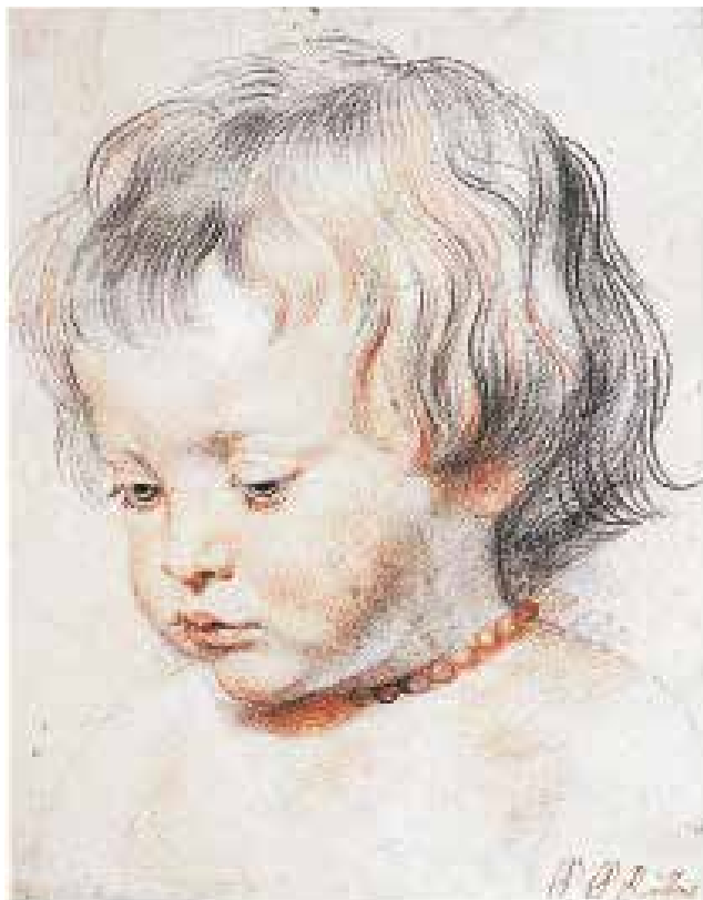
1 Piteris Paulius Rubensas. Sūnaus Nikolo portretas. Apie 1620. Popierius, juoda kreida ir sangina; 25,2×20,3. Viena, Albertina