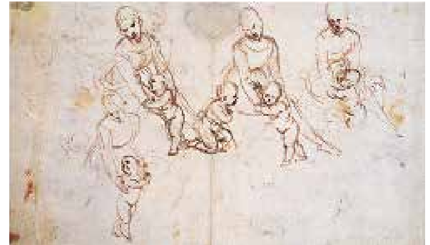
18 Rafaelis. Šv. Mergelės pievoje eskizai. 1505–1506. Lapas iš eskizų sąsiuvinio; popierius, tušas; 36,2×24,5. Viena, Albertina

dailininką. Jie jam buvo savaime suprantami. Bet jis daug kartų bandė deramai sukombinuoti figūras, taip jas išdėstyti, kad jos susijungtų į darnią visumą. Kairiajame kampe esančiame greitosiomis padarytame eskize jis bandė pavaizduoti Kūdikėlį Jėzų, žengiantį tolyn nuo motinos, bet pakėlusį ir pasukusį galvą, kad pažiūrėtų į ją. Dailininkas vienaip ir kitaip bandė pakreipti motinos galvą, norėdamas, kad jos judesys geriausiai atlieptų vaiko judesį. Paskui nusprendė apsukti vaiką, kad šis žvelgtų tiesiai į motiną. Pabandė komponuoti ir kitaip – nupiešė ir kūdikėlį šv. Joną, bet, užuot