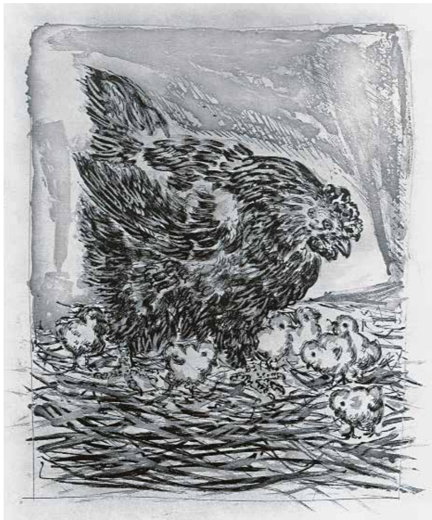
11 Pablas Pikasas. Višta su viščiukais. 1941–1942. Ofortas; 36×28. Iliustracija Biufono „Gamtos istorijai“

jie jau nesirūpina Menu didžiaja „M“ raide. Jie nežiūri jo filmų apsiginklavę tais prietaisais, kuriuos taip mėgsta pasiimti į modernios tapybos parodas. Jei šių dienų dailininkas nupiešia ką nors savitai, jis dažniausiai laikomas nemokša, geriau nė nesugebančiu. Tačiau kad ir ką manytume apie šių laikų dailininkus, galime nebūgštauti – jie turi pakankamai žinių ir galėtų nupiešti „taisyklingai“. Jei to nedaro, matyt, turi tam tikrų motyvų, panašių į Volto Disnėjaus (Walt Disney). 11 iliustracijoje matome įžymiojo modernaus meno pradininko Pikaso (Picasso) estampą iš iliustruotos „Gamtos istorijos“. Be abejonės, niekas nesurastų jokių trūkumų šiame žavingame vištos