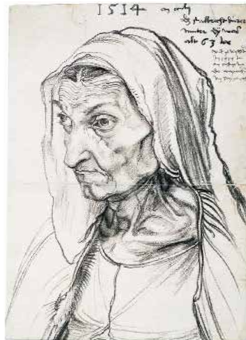
2 Albrechtas Diureris. Motinos portretas. 1514. Popierius, juoda kreida; 42,1×30,3. Berlynas, Valstybiniai muziejai, Grafikos kabinetas

taip gražius objektus. Galime neabejoti, kad didysis vokiečių dailininkas Albrechtas Diureris (Albrecht Dürer) savo motiną (2 pav.) piešė taip pat nuoširdžiai ir su tokia pačia meile, kokią Rubensas jautė savo putliam berniūkščiui. Iš pradžių mus gal ir pribloškia ši tikroviška rūpesčių išvargintos senutės studija ir mes nosisukame; tačiau jei įveiksime pradinį