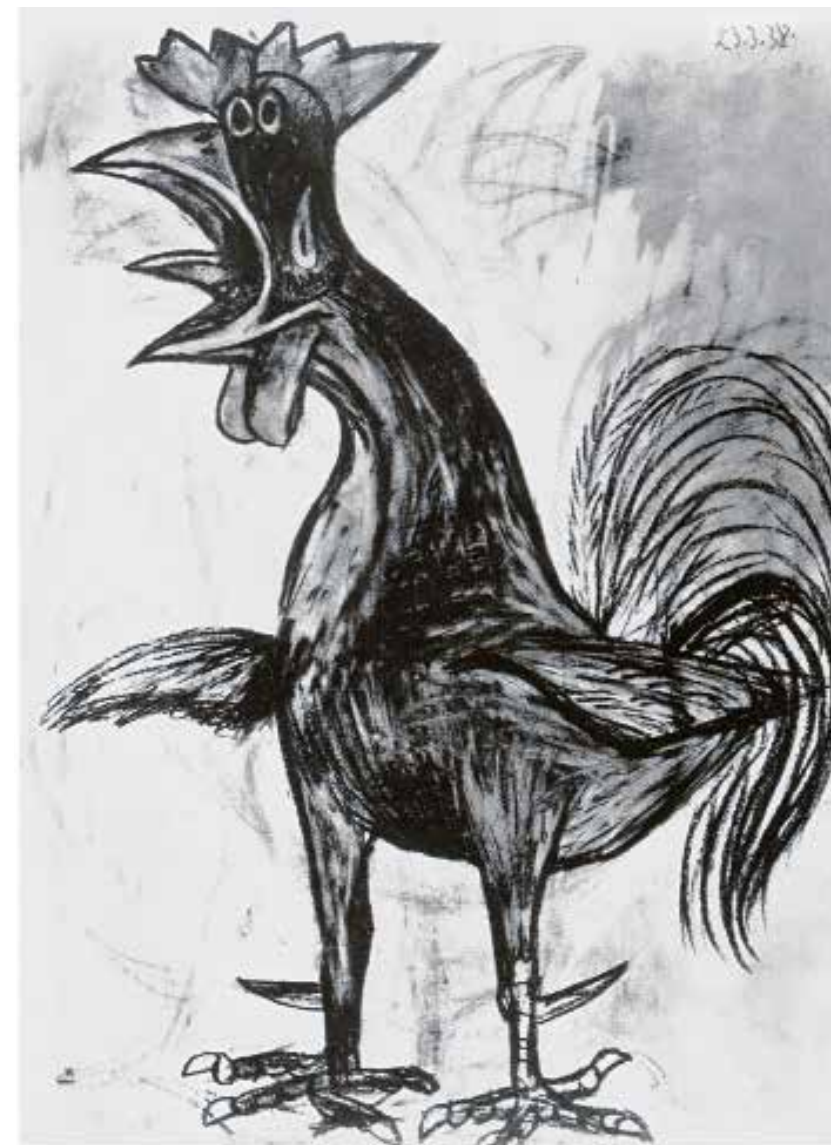
12 Pablas Pikasas. Gaidžiūkštis. 1938. Popierius, anglis; 76×55. Privati kolekcija

jie jau nesirūpina Menu didžiaja „M“ raide. Jie nežiūri jo filmų apsiginklavę tais prietaisais, kuriuos taip mėgsta pasiimti į modernios tapybos parodas. Jei šių dienų dailininkas nupiešia ką nors savitai, jis dažniausiai laikomas nemokša, geriau nė nesugebančiu. Tačiau kad ir ką manytume apie šių laikų dailininkus, galime nebūgštauti – jie turi pakankamai žinių ir galėtų nupiešti „taisyklingai“. Jei to nedaro, matyt, turi tam tikrų motyvų, panašių į Volto Disnėjaus (Walt Disney). 11 iliustracijoje matome įžymiojo modernaus meno pradininko Pikaso (Picasso) estampą iš iliustruotos „Gamtos istorijos“. Be abejonės, niekas nesurastų jokių trūkumų šiame žavingame vištos