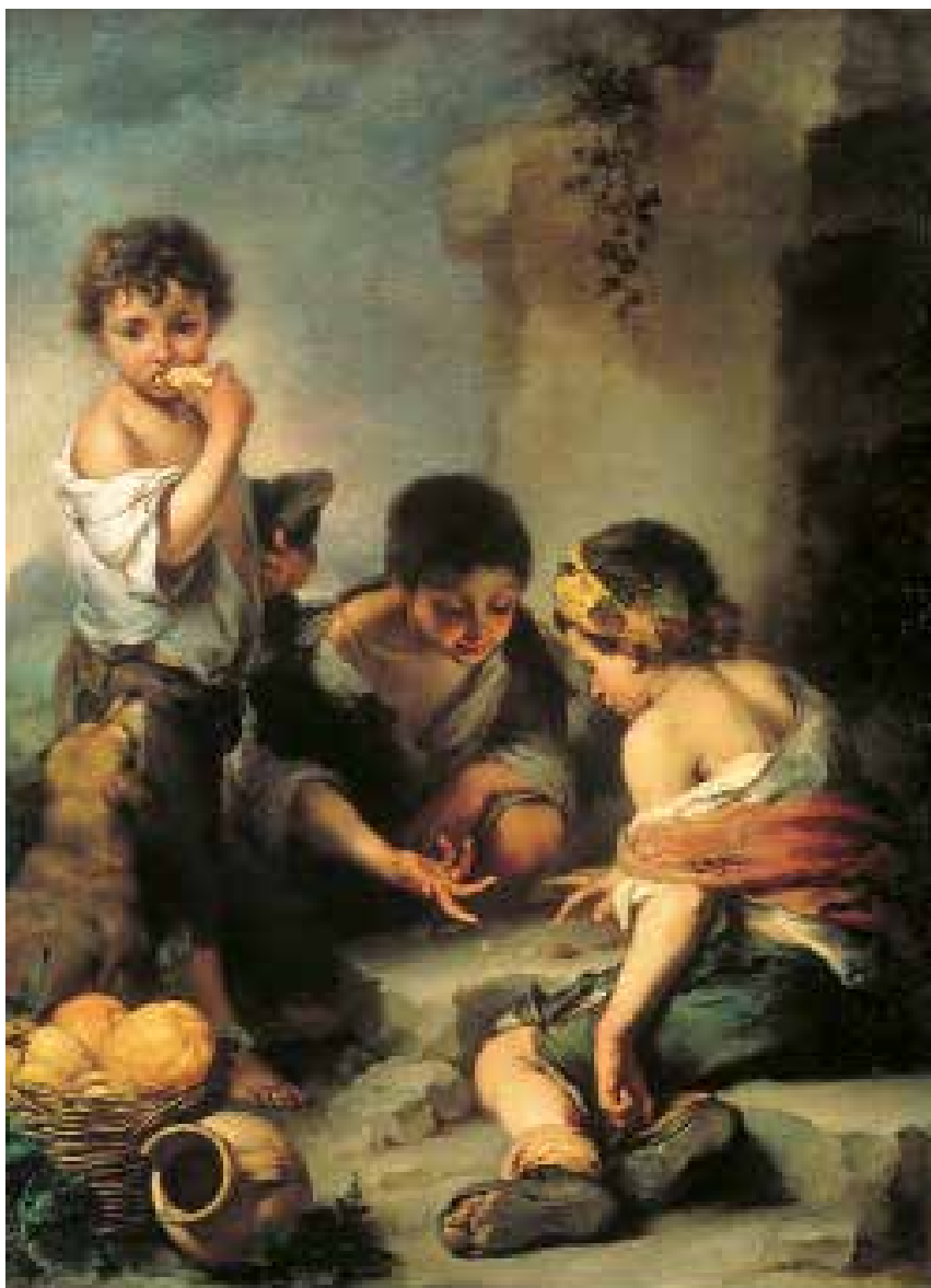
3 Bartolomė Estebanas Muriljas. Gatvės vaikai. Apie 1670–1675. Drobė, aliejus; 146×108. Miunchenas, Senoji pinakoteka