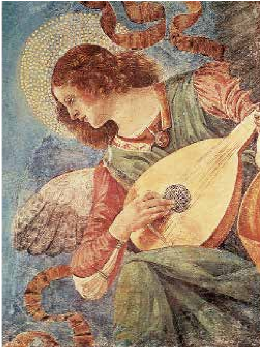
5 Melocas Forlietis. Angelas . Apie 1480. Freskos detalė. Vatikanas, Pinakoteka

drobėse jie tikrai žavūs. Antra vertus, daug kas pasakytų, kad nuostabiame olandiškame interjere Piterio de Hocho (Pieter de Hooch; 4 pav.) pavaizduotas vaikas nėra patrauklus, bet pats paveikslas vis tiek malonus.