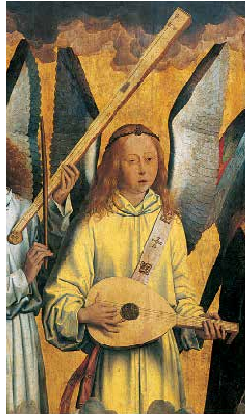
6 Hansas Memlingas. Angelai . Apie 1490. Altoriaus detalė; lenta, aliejus. Antverpenas, Karališkasis dailės muziejus

Visa kebeknė dėl grožio kyla todėl, kad skonis, kaip ir grožio kriterijai, labai įvairūs. Ir 5, ir 6 iliustracijoje pateikti paveikslai buvo nutapyti XV a. ir abiejuose vaizduojami liutnia grojantys angelai. Italo Meloco Forliečio