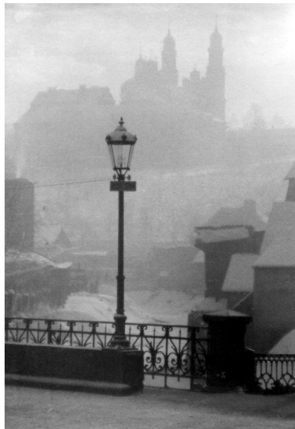
Tiltas per Vilnių Užupyje, 1939 m.