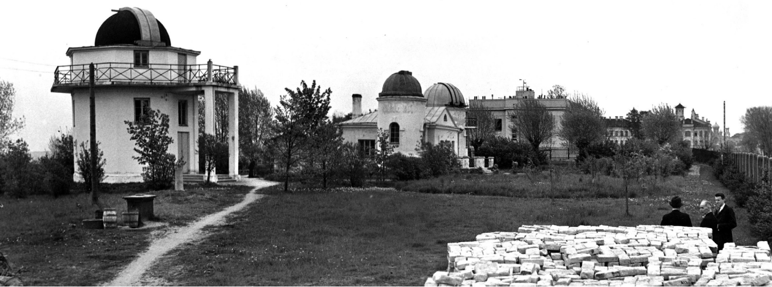
Stepono Batoro universiteto observatorija Zakręto (nuo 1939 m. M. K. Čiurlionio) gatvėje. Tolumoje matosi universiteto zoologijos ir botanikos skyrius. Tarpukaris.