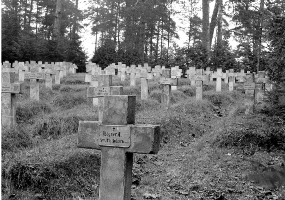
Vingio karių kapinės, 1934 m.