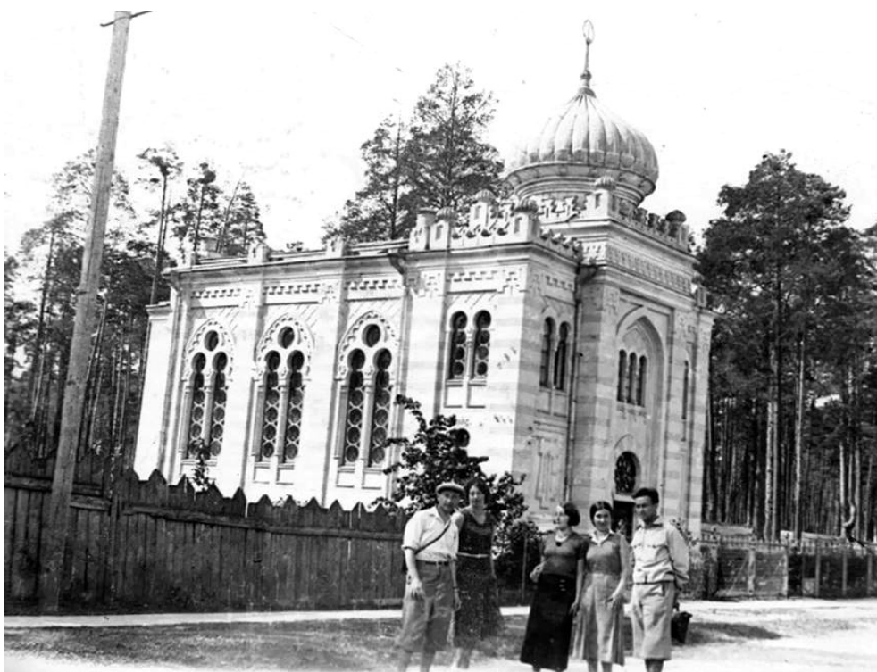
Karaimų kenesa tarpukariu.