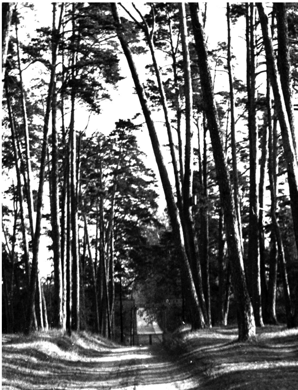
Īejimas Ķ Vingio parkā, 1958 m. VAA.