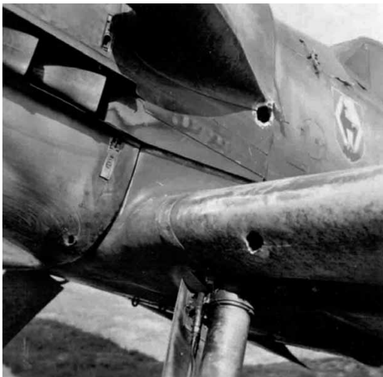
Kulkų išmuštos skylės „Messerschmitt 109“ korpuse.

– Gerasis Dieve! Man dar pasisekė. Truputį arčiau ir būčiau iškeliavęs į aną pasaulį. Iš kur ši tepalo dėmė? Variklis, atrodo, nepažeistas.