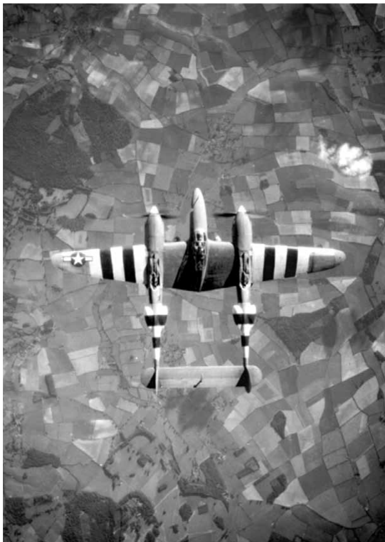
„Lockheed P-38 Lightning“ skrydis. Vaizdas iš viršaus.