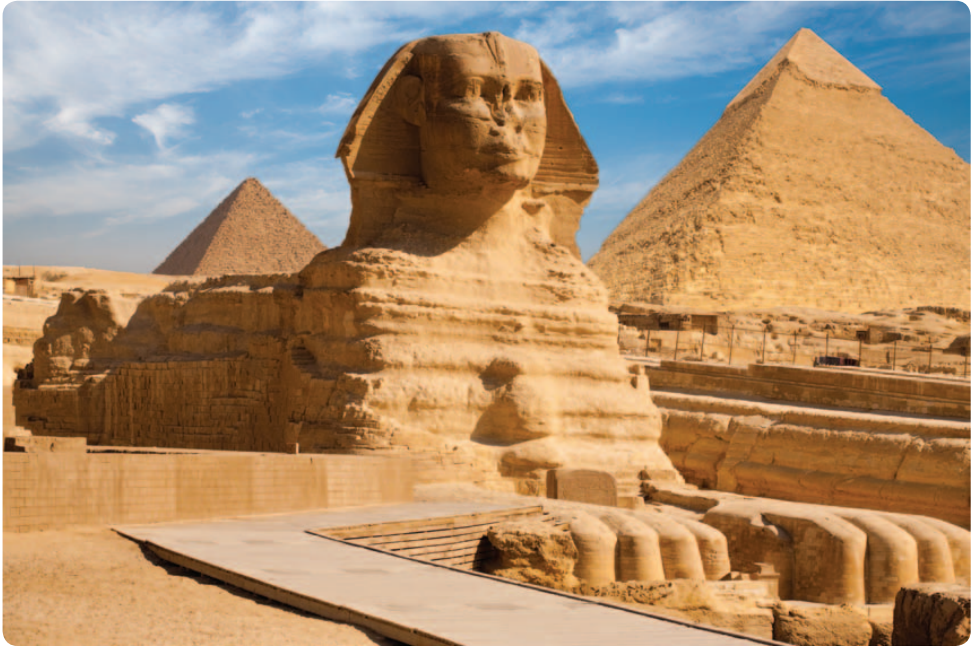
Didysis Gizos sfinksas ir piramidės