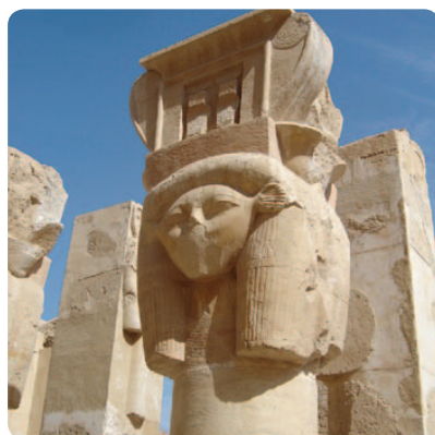
Hačepsutos šventyklos detalės

ekonomika, buvo išplėtoti prekybos keliai su kaimynais, sustiprėjo laivyba, suklestėjo architektūra. Bet jaunasis faraonas Tutmozis III augo ir stiprėjo, todėl taip pat panoro valdžios ir galybės. Beveik po 20 metų valdymo Hačepsuta paslaptinai dingo, buvo nužudytas ir ją išsimylėjęs architektas, kuris projektavo Chačepsut garbei statomą šventyklą ir prižiūrėjo darbus. Tapęs teisėtu valdovu, jaunasis faraonas viską, kur tik buvo koks įrašas ar atminimas apie jo žmoną-pamotę, griovė, naikino ir trynė. Paliko vienintelę taip ir nebaigtą statyti šventyklą, kaip simbolį ir pamoką nepaklusniesiems.