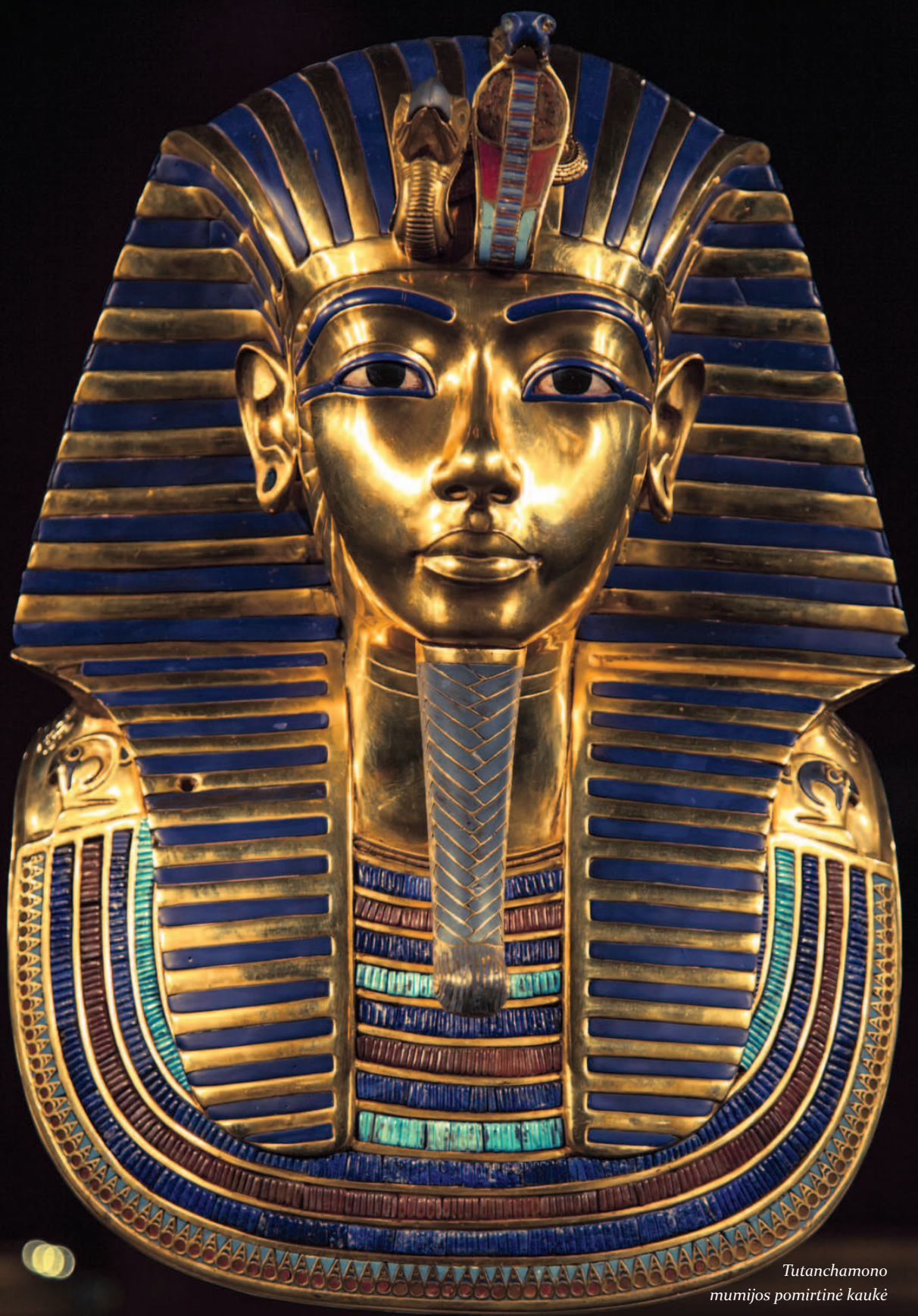
Tutanchamono mumijos pomirtinė kaukė