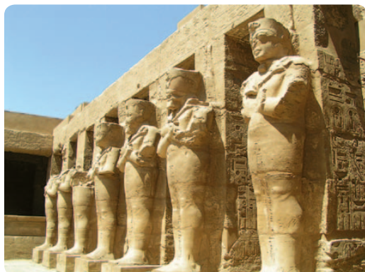
Karnako šventyklos detalės

Luksore, be tradicinio egiptiečių gyvenimo, galima išvysti didingų šventyklų, kurios buvo statomos šimtmečiais, o išliko dar ilgiau – tūkstantmečius, perėjo visas epochas, skirtingus amžius, matė Egipto klestėjimą, žlugimą, svetimšalių užkariavimus, savanorišką integraciją į kitą kultūrą bei papročius. Bet šventyklos liko tokios kaip ir buvo, nebent žemės drebėjimų apgriautos ar dykumos smėlynų užpustytos. Galima sakyti, kad jei nematei Karnako šventyklos – nematei Egipto. Daugeliui tai toks pats šalies simbolis kaip ir piramidės.