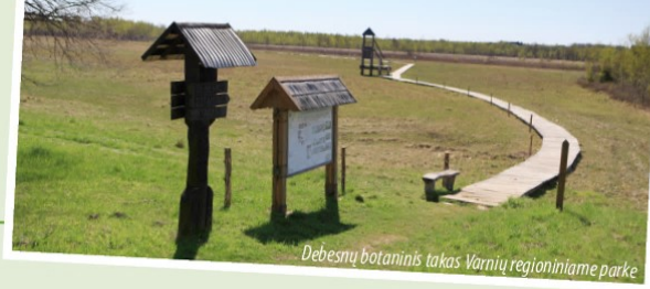
Debesnų botaninis takas Varnių regioniniame parke

nuo II a. prieš Kristų. Nuo 228 m virš jūros lygio iškilusio piliakalnio atsi-veria neapėriami kalvotos žemės toliai, pamatysime ne tik netoliese stūksančius milžinus Girgždūtę, Moteraitį, Sprūdę, bet ir už 35 km esantį Medvėgalį! Gerai įsižiūrėję pastebėsime toluomoje baltuojančiuose Telšių katedros bokštus.