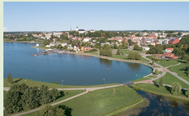
Masčio ežeras Telsiuose