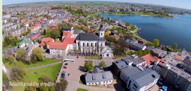
Telšiai iš paukščio skrydžio

Štai kaip greitai prabėgo pirmoji kelionės diena. Kad galėtume tęsti kelionę, turime pailsėti, tiesa? Plateliuose apstokime nakčiai. Miestelyje ar jo apylinkėse nakvėnės vietą rasti tikrai nebus sunku. Įsikūrę kaimo turizmo sodyboje, galime ramiai pavaikštinėti Platelių ežero pakrante. Vakariniėje ežero dalyje, netoli kranto, išvysime Pilies salą – čia kažkada stovėjusi Lietuvos kunigaikščių pilis.