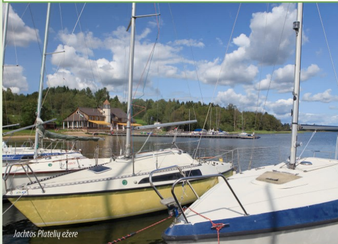
Jachtos Platelių ežere