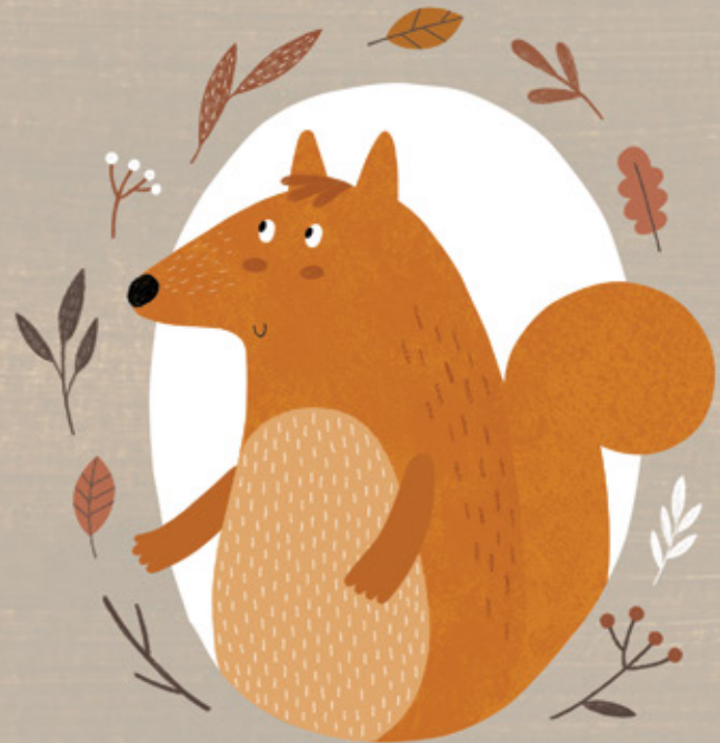
VŪVERIUKAS TIKLIS (be keleto puslapių 5 metai)

Mėgsta: skraidyti padebesiais užsimerkęs. Nemėgsta: neprisirpusių vyšnių. Šios knygos autoriui dovanojo vieną savo plunksną, kuria jis ir užrašė pasakojimą.