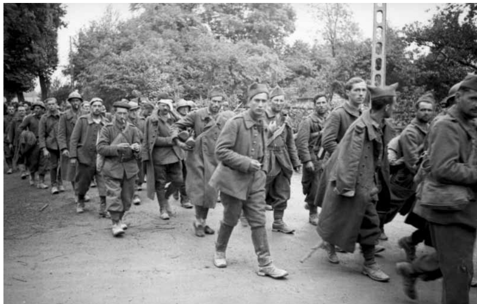
Prancūzų belaisvių kolona keliauja į vokiečių užnugarį. 1940 m.

Beaurains, 4 kilometrai į pietus nuo Araso). Tačiau motorizuotasis šaulių pulkas nepasiekė paskui priešakinį tanką, kaip buvo sumanyta, tad Rommelis šarvuotu automobiliu nuskubėjo atgal jų paraginti greičiau judėti pirmyn, bet staiga pastebėjo, kad prancūzai jį atkirto nuo ryšio su vokiečių daliniais. Keletą valandų jis išbuvo lyg išpraustas į kampą, bet su artilerija atvykęs pėstininkų pulkas pašalino kliūtis. Paskui tiems daliniams patikėta gintis nuo priešų išpuolių piečiau Araso, nes gauta žinių, jog miesto priegose sutelkta daug prancūzų ir britų divizijų.