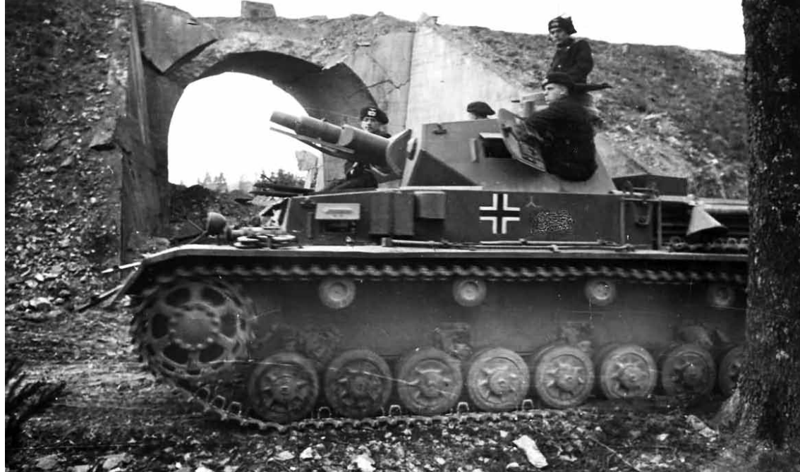
Vokiečių vidutinis tankas „Pz IV“ ir jo įgula. 1940 m.