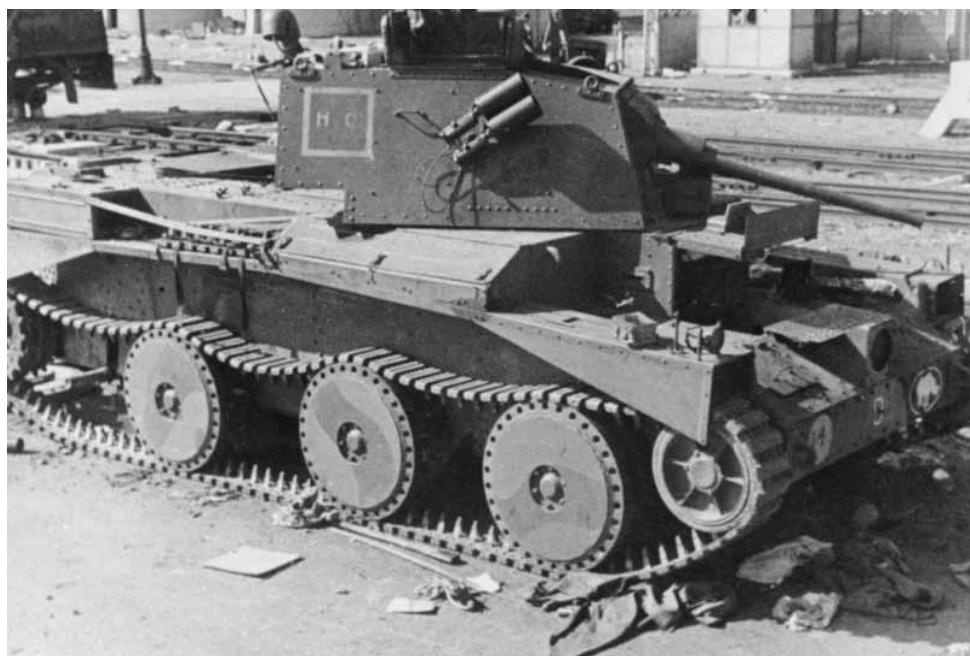
Mūšyje dėl Prancūzijos sunaikintas britų tankas „Cruiser Mk III“.

Nepriklausomai nuo visų realių rezultatų psichologinis ir moralinis poveikis, padarytas vokiečių aukščiausiai karinei vadovybei, buvo labai stiprus. Feldmaršalas von Rundstedtas, po karo aptardamas 1940 metų kampaniją, pasakė: „Kritinis puolimo momentas atėjo tada, kai mano pajėgos pasiekė Lamanšą. Priežastis – gegužės 21 d. britų kontrsmūgis pietų kryptimi nuo Araso. Kurį laiką atrodė, kad mūsų tankų divizijos bus atkirstos dar prieš pėstininkų divizijoms atvykstant jų paremti. Jokia prancūzų kontrataka nekėlė tokios rimtos grėsmės kaip tas kontrsmūgis.“ Ypač smarkiai paveikti buvo von Klugė ir von Kleistas. Klugė net buvo linkęs, kol padėtis nepaaiškės, stabdyti bet koki tolesnį puolimą į vakarus nuo Araso. Kleistas taip pat gerokai būgštavo. Štai kodėl, kai Guderianas gegužės 22 d. pasuko į šiaurę nuo Abvilio pulti Bulonės, Kalė ir Diunkerko link, puolimas buvo sulėtintas, nes jam trukdė von Kleisto įsakymai, apribojantys tolesnius veiksmus.