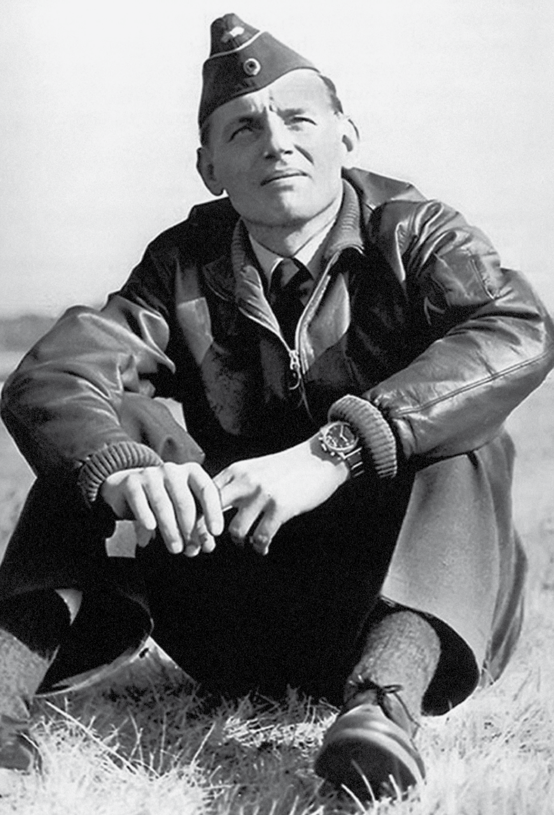
Liufvafės asas Erichas Hartmanas ( Erich Hartmann ).