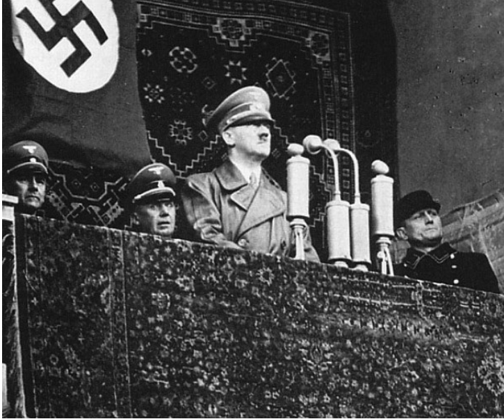
A. Hitleris kreipiasi į susirinkusiuosius iš Klaipėdos teatro balkono. 1939 m. kovo 23 d.