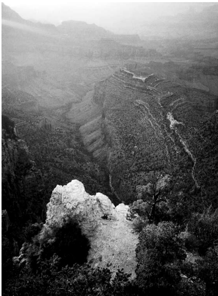
Žemės tarpsnis