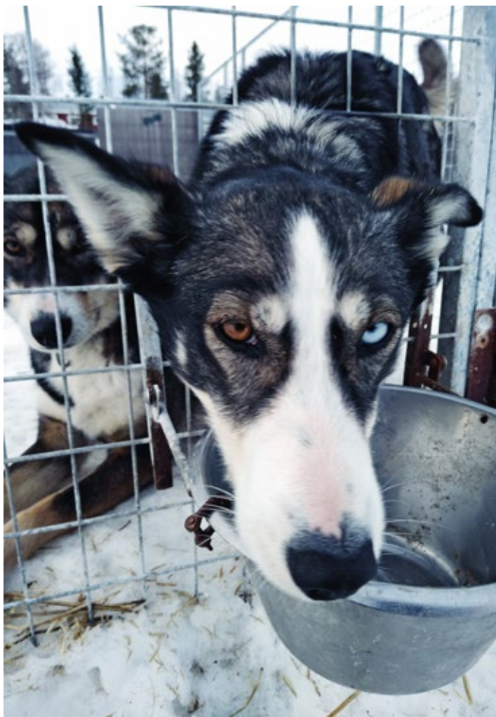
Tara gali didžiulis skirtingų spalvų akimis