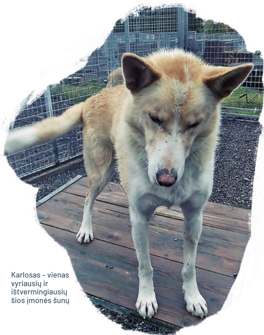
Karlosas - vienas vyriausių ir ištvermingiausių šios įmonės šunų