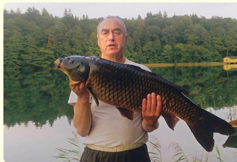
...o jame gali sugauti ir visai nemenką laimikį...