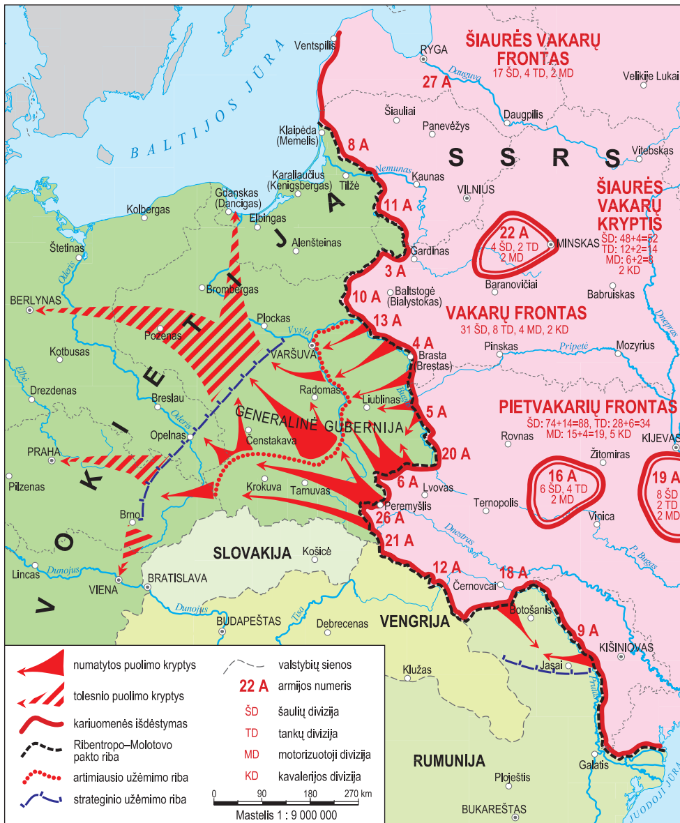
2. Raudonosios armijos strateginio puolimo operacijos planas 1941 metų pavasarį.