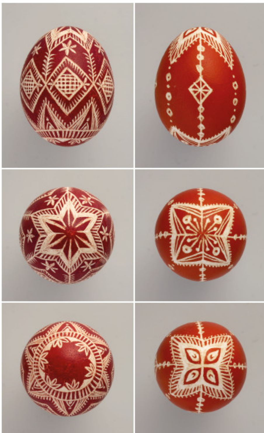
Vienaspalviai skutinėti margučiai