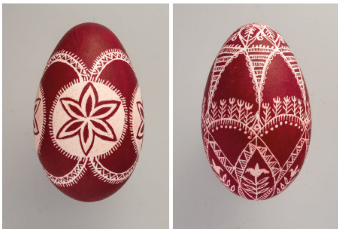
Venspalvāi skutinēti margučāi