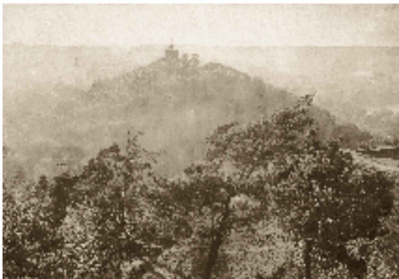
7 Pilies kalnas 1912–1915