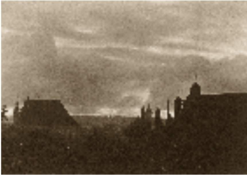
Vilniaus bažnyčios nuo Užupio. 1912