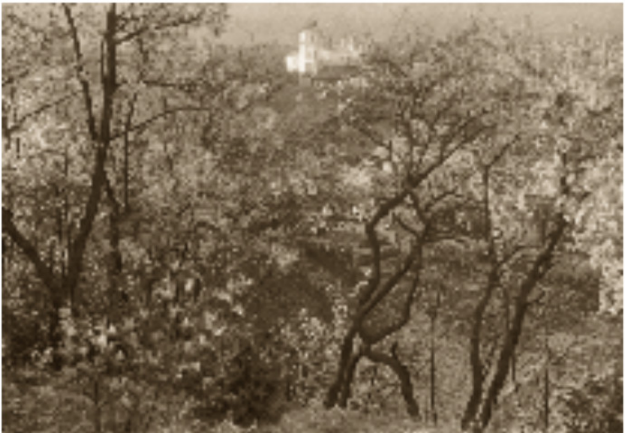
4 Popinės priemiesčio sodai Apie 1916