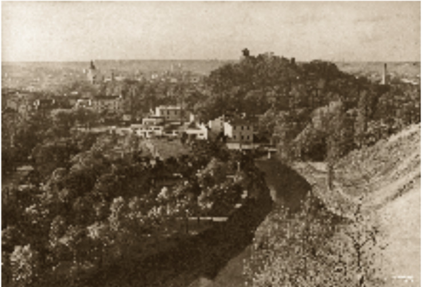
6 Pilies kalnas ir Bernardinų sodas nuo Užupio 1928–1929