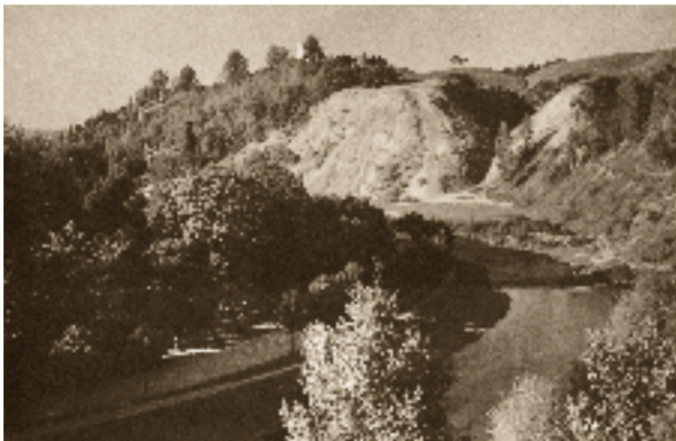
25 Vilnia ir Bernardinų sodas Trijų Kryžių kalno papėdėje Apie 1916