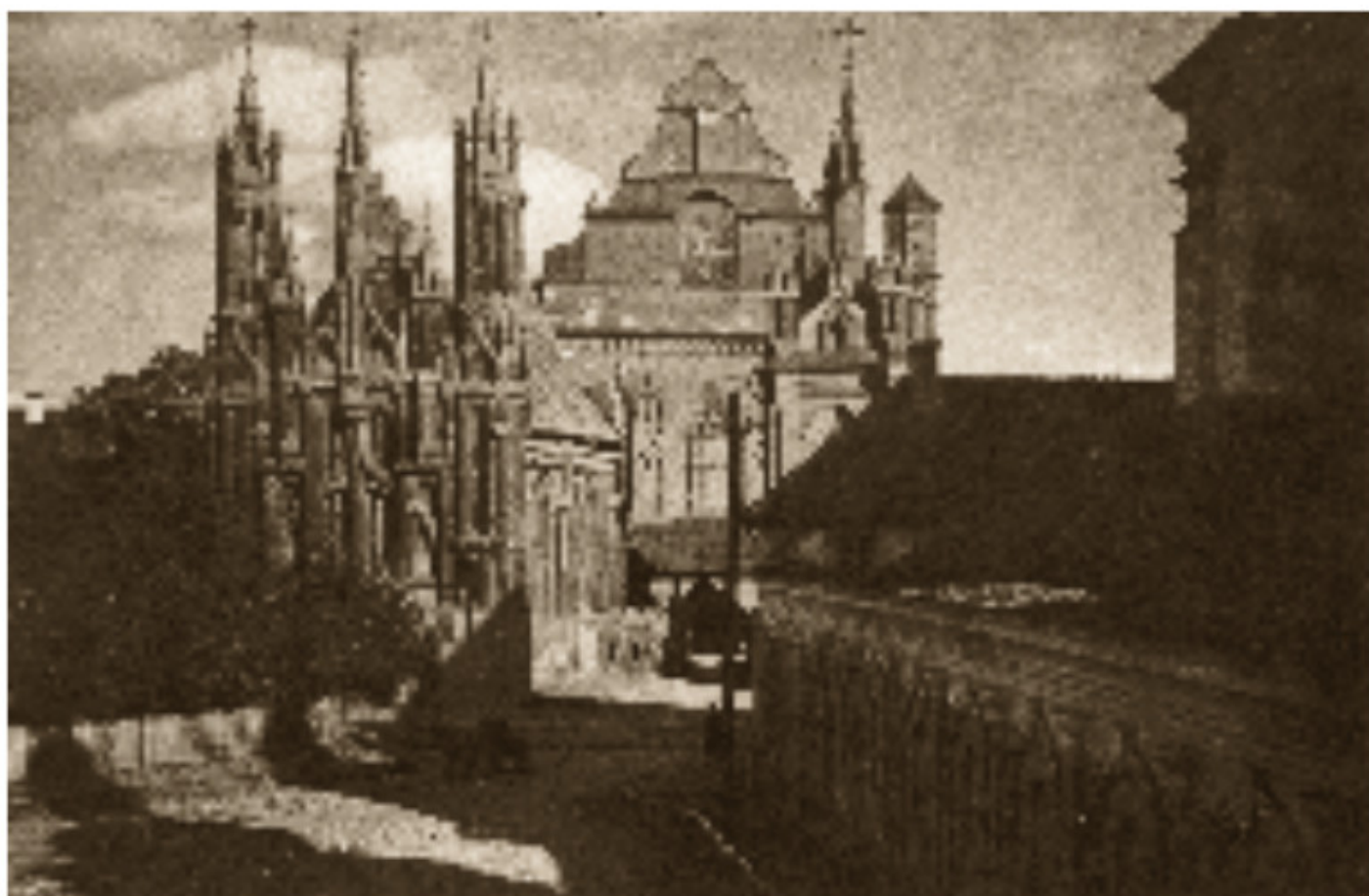
94–95 Šv. Onos ir Šv. Pranciškaus ir Bernardino bažnyčios 1912–1915