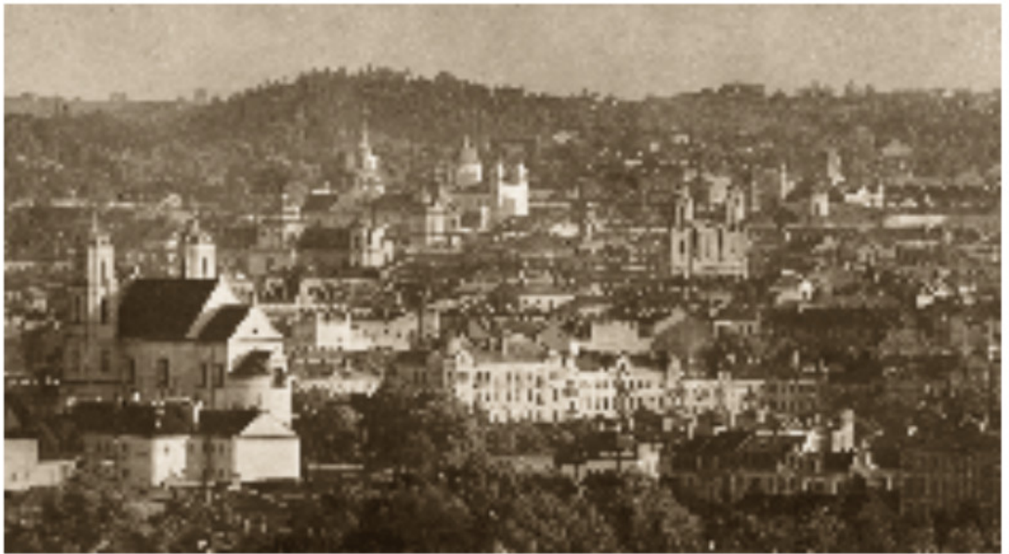
1-2 Vilniaus panorama nuo Šeškinės kalvų Apie 1925