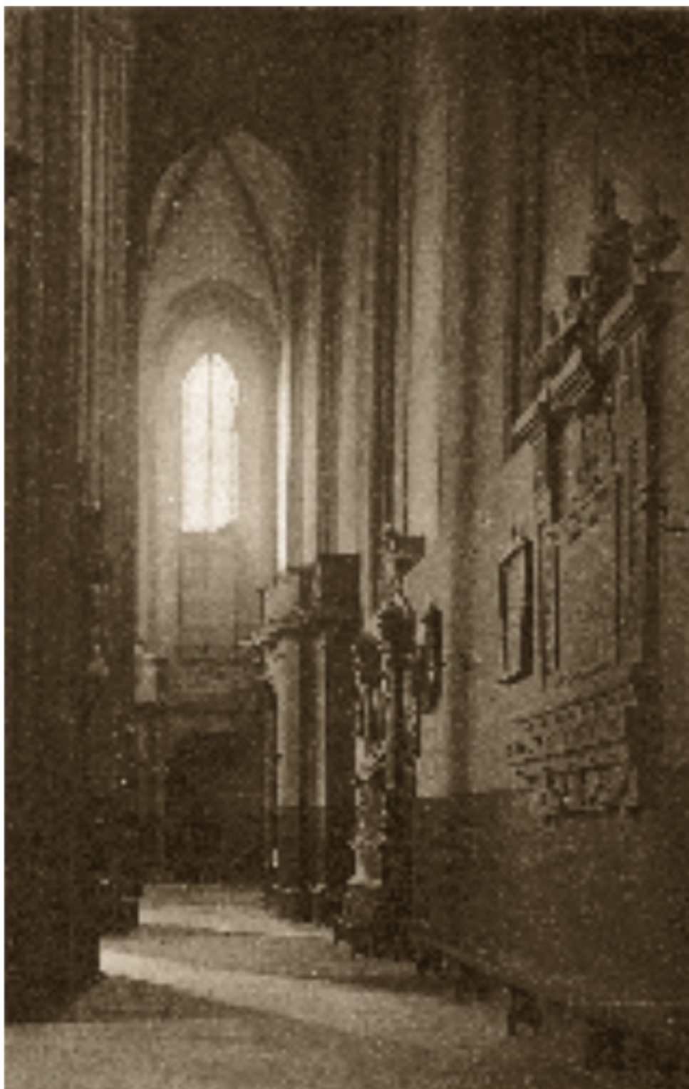
115 Šv. Pranciškaus ir Bernardino bažnyčios šiaurinė nava Apie 1913