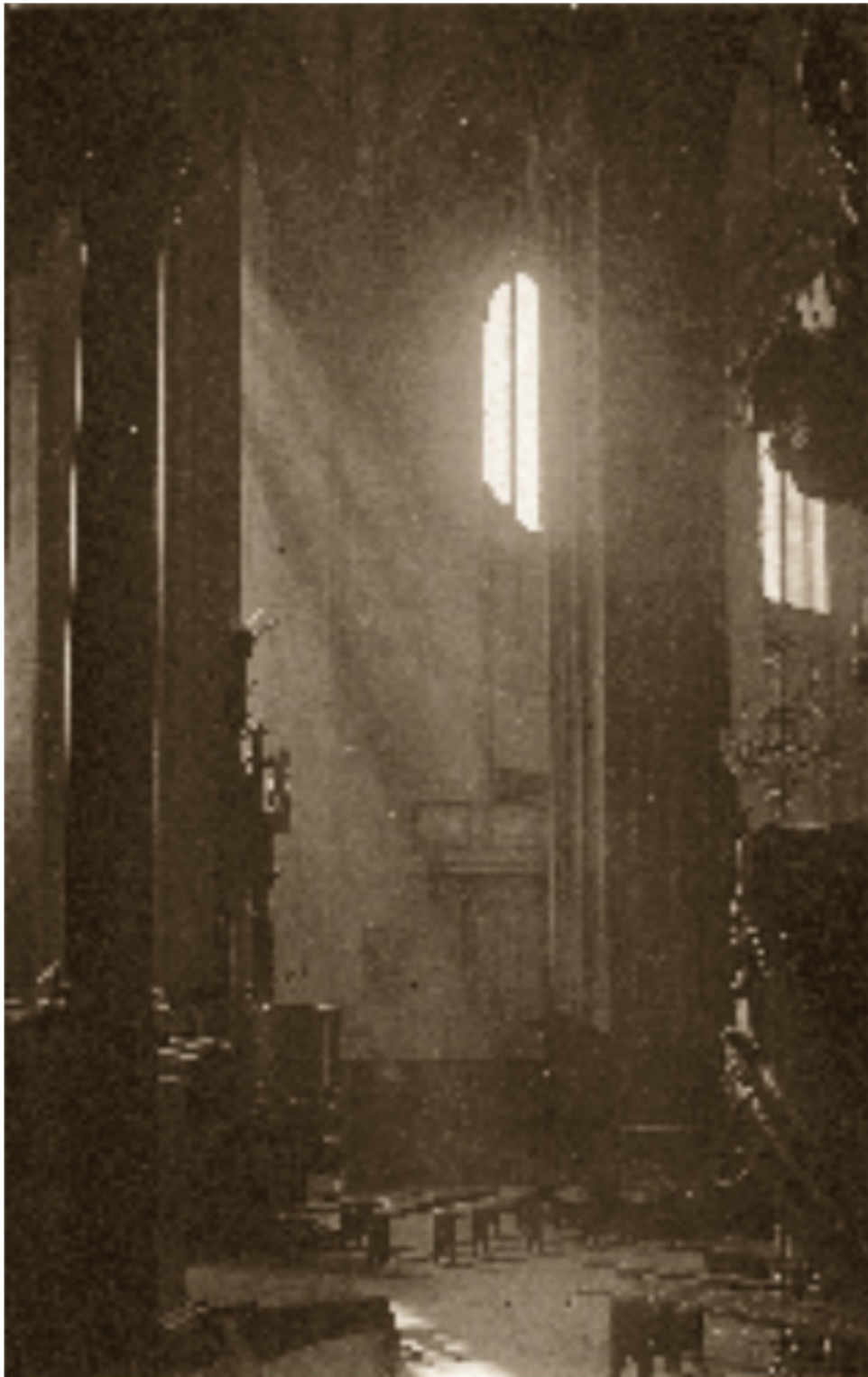
114 Šv. Pranciškaus ir Bernardino bažnyčios interjeras Apie 1913