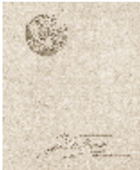
Jano Bulhako fotostudijos emblema. Dail. Ferdynandas Ruszczycas. 1912

grafikos spausdinimo centrus – susipažinti su tuometiniais fotografijos pasiekimais ir naujausiomis jos techninėmis galimybėmis 16 .