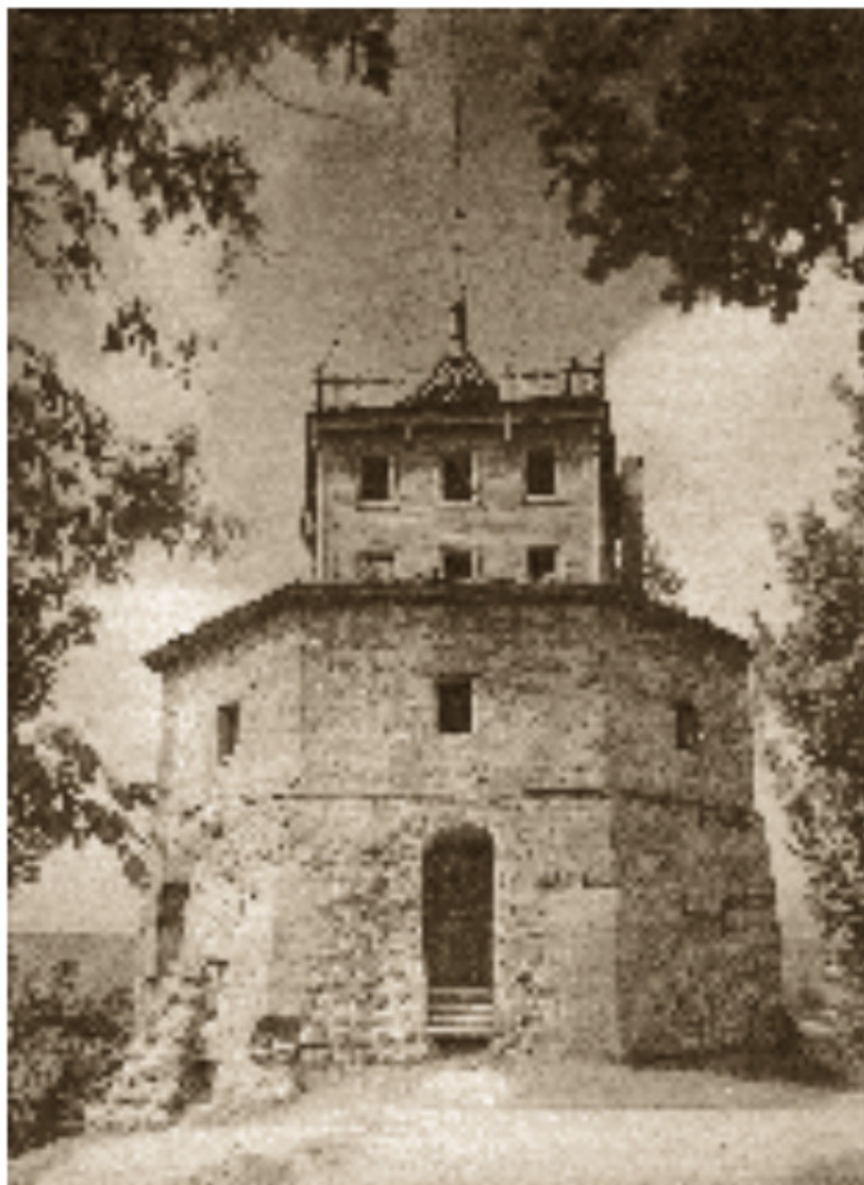
8 Aukštutinės pilies bokštas Apie 1916