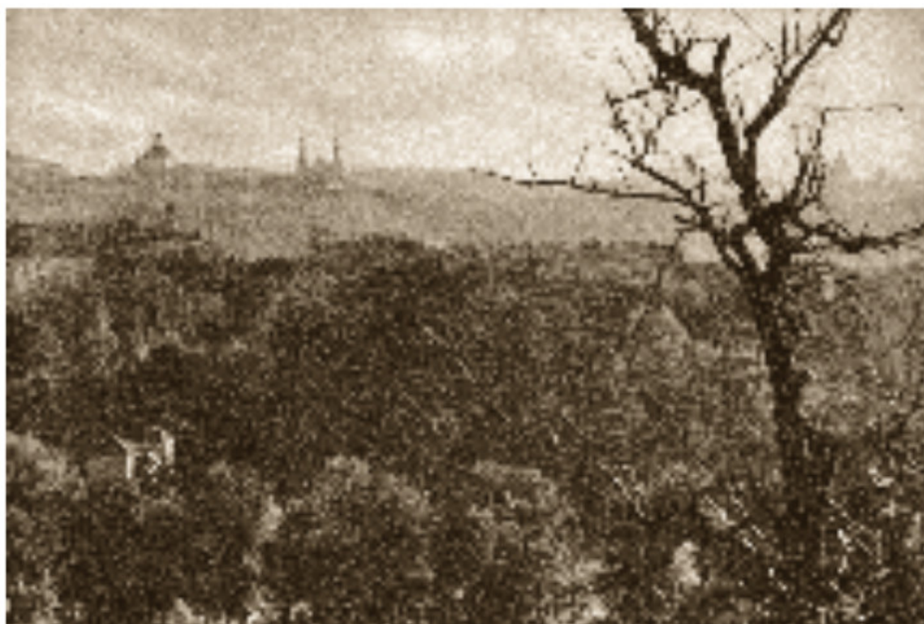
3 Vilniaus peizažas nuo Trijų Kryžių kalno Apie 1916