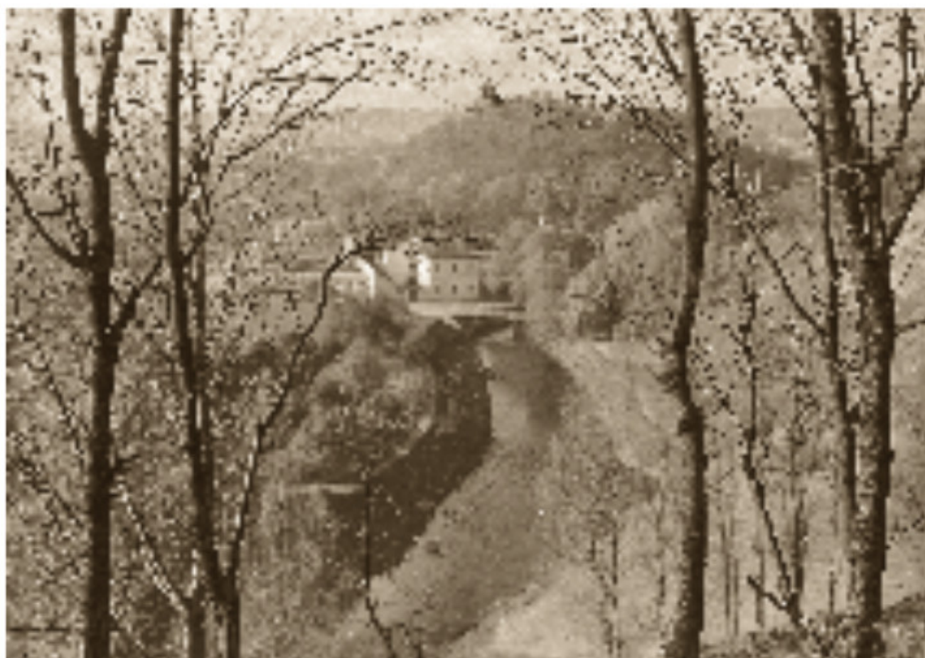
5 Vilnia ir Pilies kalnas nuo Užupio 1928–1929