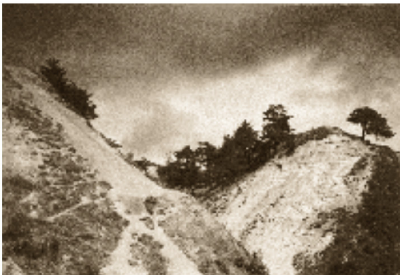
26–27 Trijų Kryžių kalno ir Bekešo kalvos raguva 1913