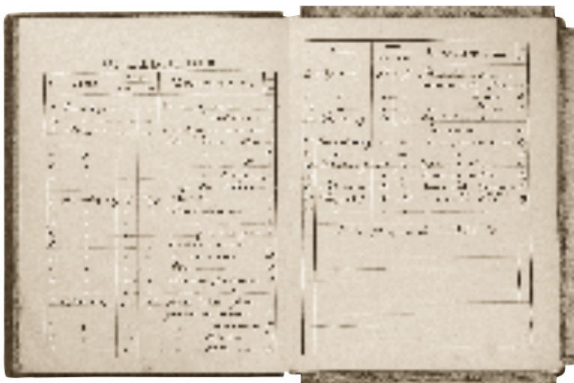
Jano Bulhako fotografijų rinkinio Фотографический архивъ I tomo viršelis, antraštinis lapas ir turinys. 1912