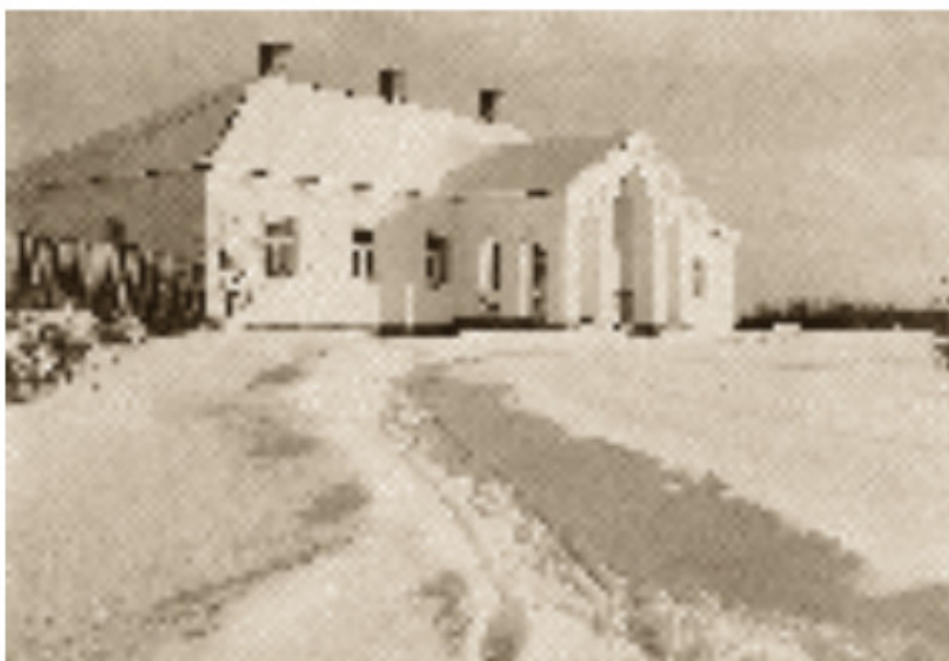
Persekos dvaras. 1911