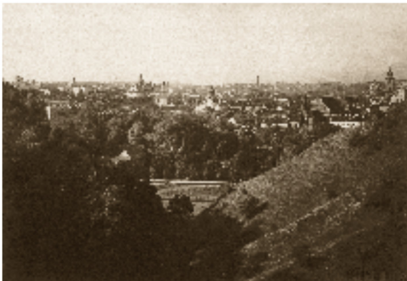
24 Bernardinų sodas ir Užupio panorama 1915–1916