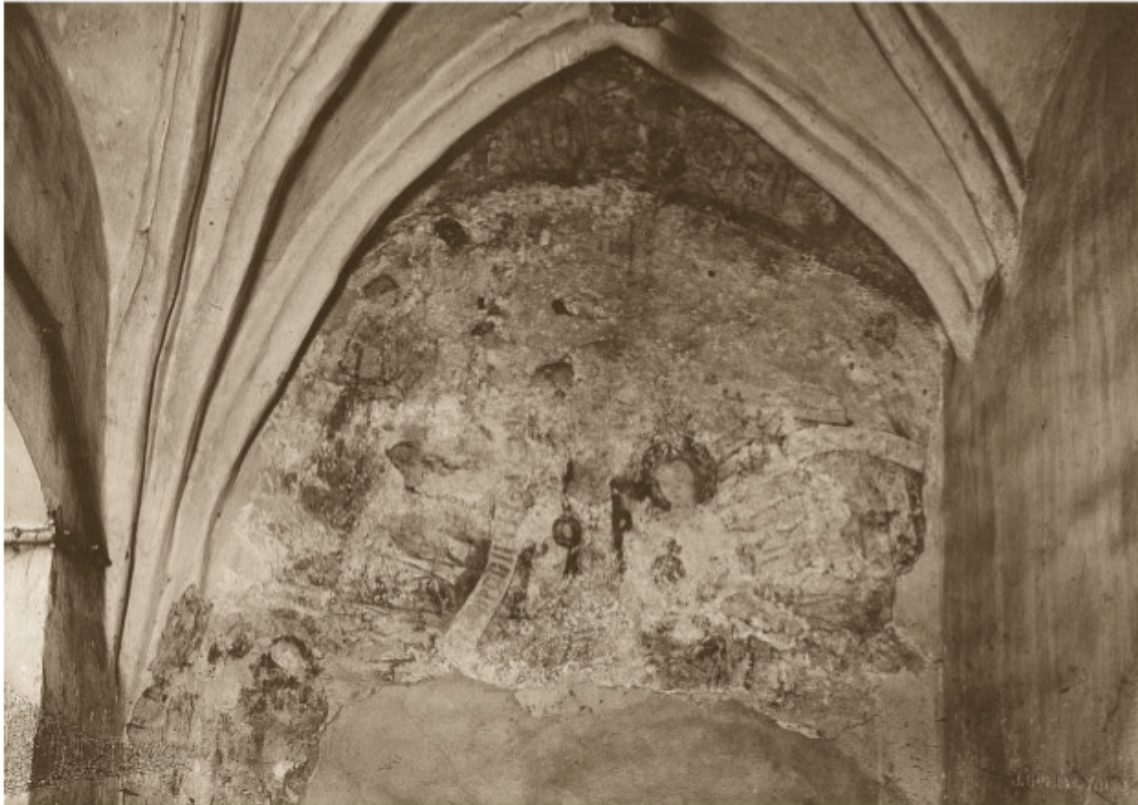
Bernardinų vienuolyno freskos, vaizduojančios Švč. Mergelę Mariją su Kūdikieliu Jėzumi, fragmentas. 1928