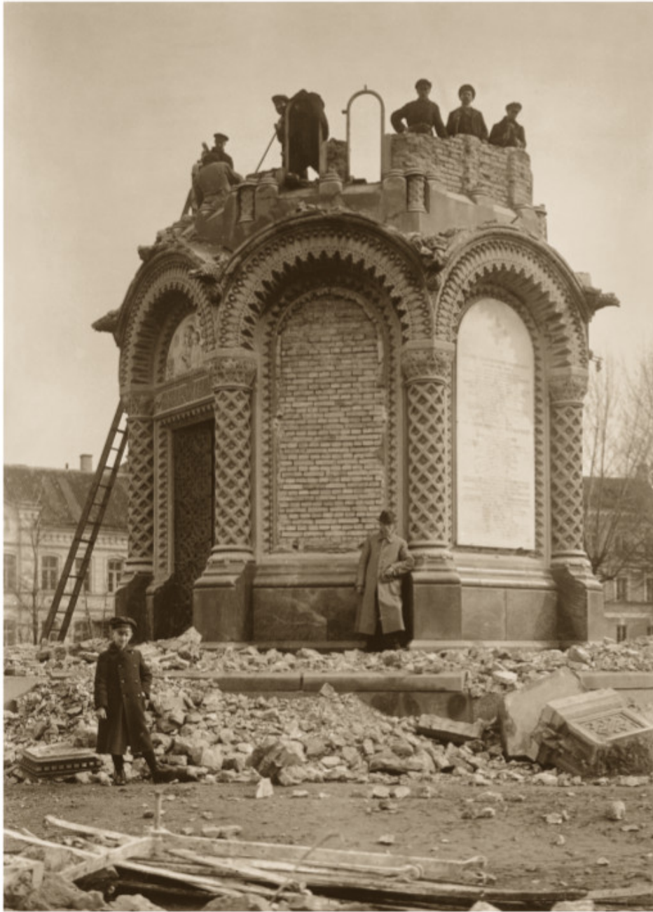
17 Griaunama Aleksandro Nevskio koplyčia, pastatyta 1865 m. Šv. Jurgio prospekto skvere (dabar V. Kudirkos aikštė) 1919