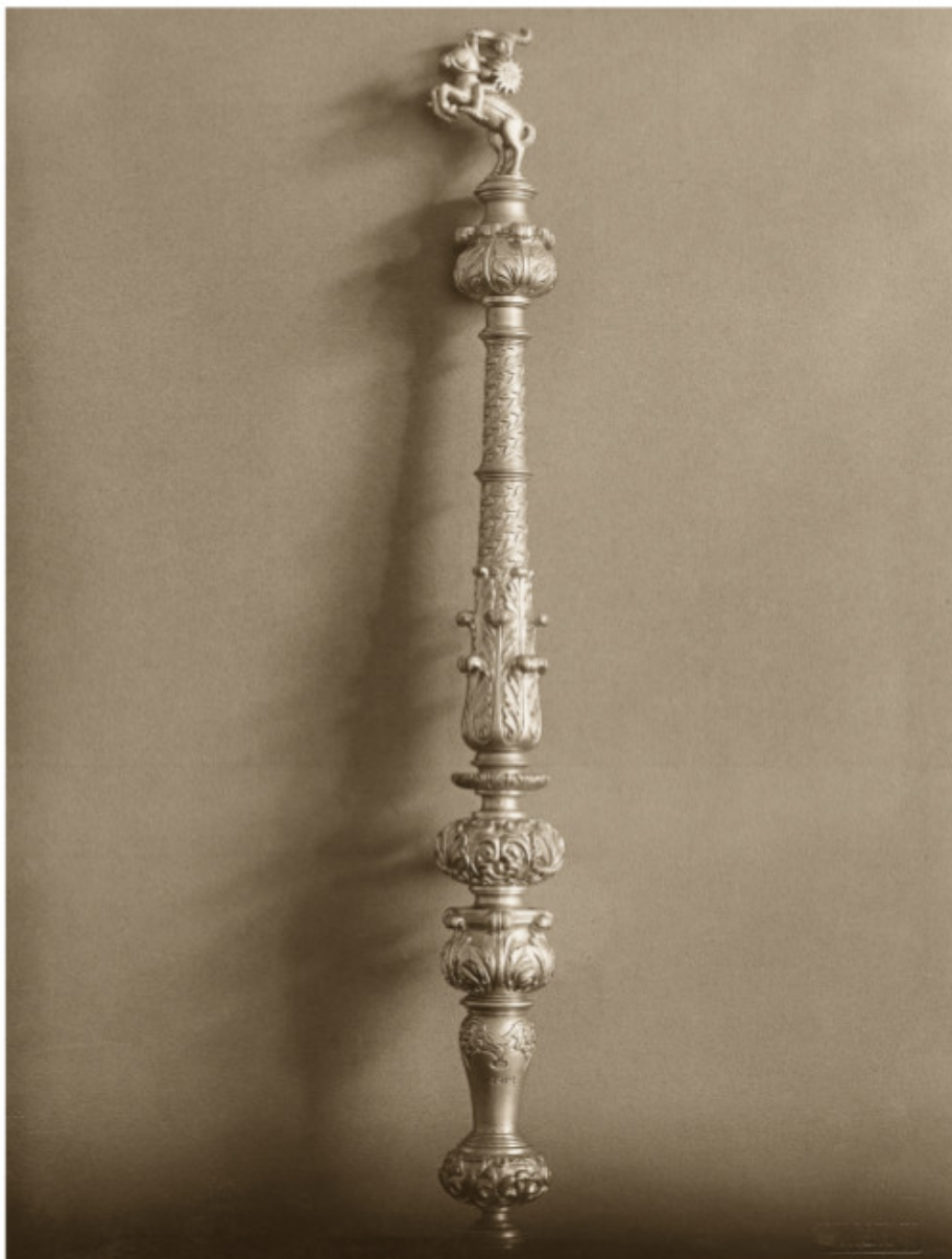
76 Senojo, XVII a. pradžios, Vilniaus universiteto rektoriaus skeptro kopija 1919