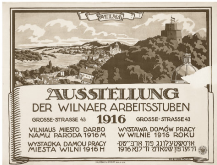
Vilniaus miesto darbo namų parodos plakatas. 1916