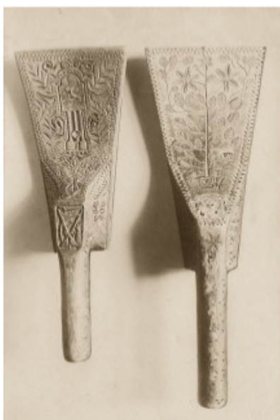
Kultuvės. XIX a. pab.–XX a. pr. Lietuvių dailės draugijos rinkinys. 1912–1914