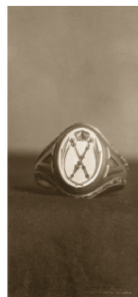
77 Stepono Batoro universiteto rektoriaus žiedas 1919