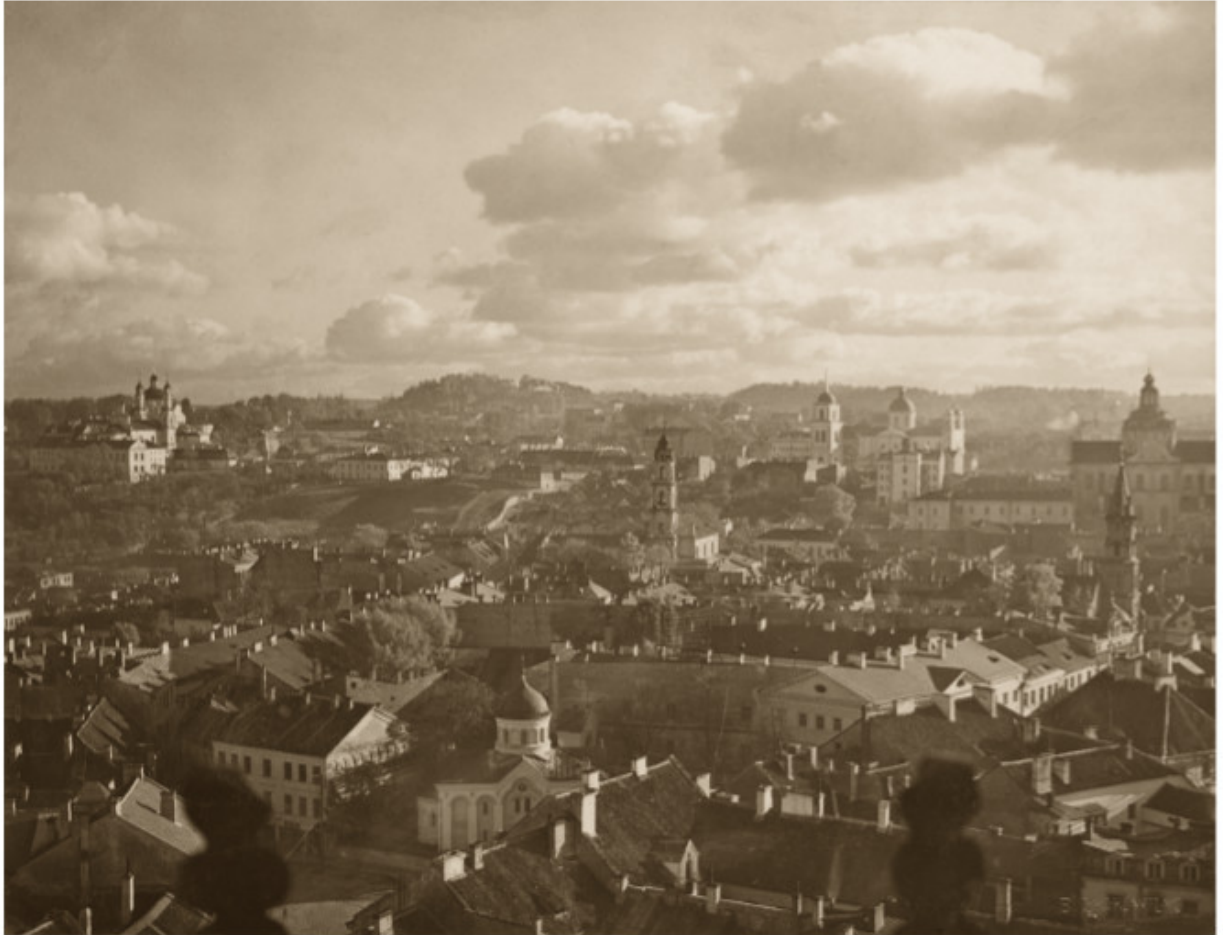
Vilniaus senamiestis iš Šv. Jono bažnyčios varpinės. 1912–1915