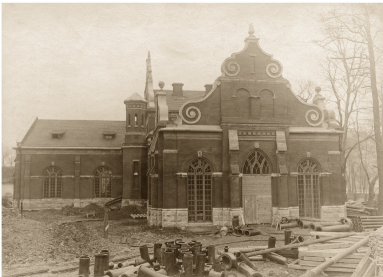
1-2 Vilniaus vandentiekio siurblių stotis Bernardinų sode 1914