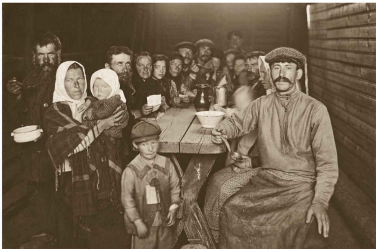
33 Liaudies virtuvė Vilniuje 1916