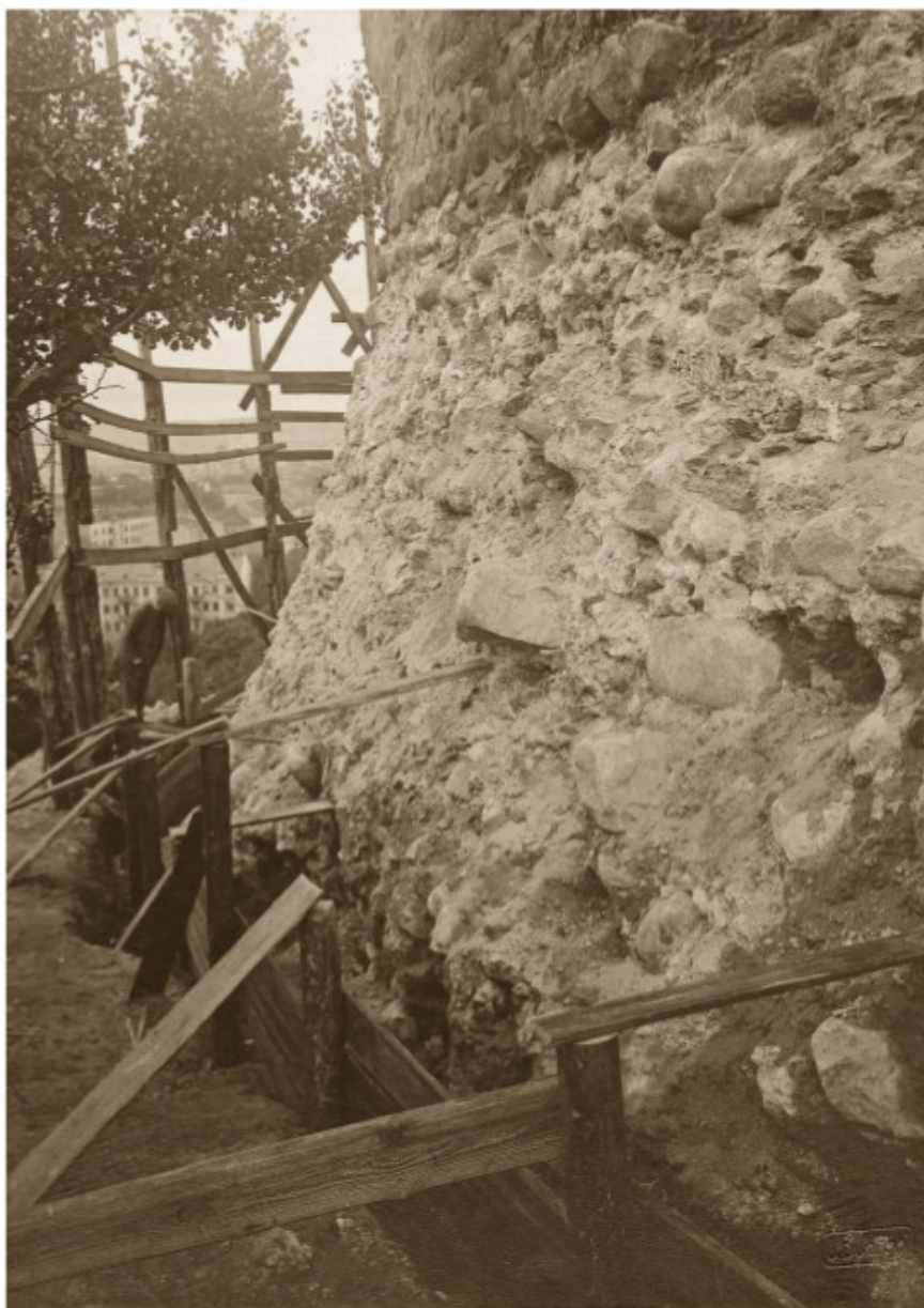
Restauruojamas Pilies kalno bokštas. 1914

Petro Vileišio leidimas ir Bulhako parašas. Fotografas taip pat talkino ir Lietuvių dailės draugijai. Jis fotografavo draugijos rinkinio muziejinius eksponatus, dailininkų paveikslus. Draugijos ir fotografo bendradarbiavimą liudija 1912–1914 m. Bulhako fotostudijos firminiai kvitai, kuriuose nurodytos ir autoriaus parašu patvirtintos pinigų sumos, sumokėtos jam už tam tikrą padarytų fotografijų ir foto-reprodukcijų skaičių 21 .