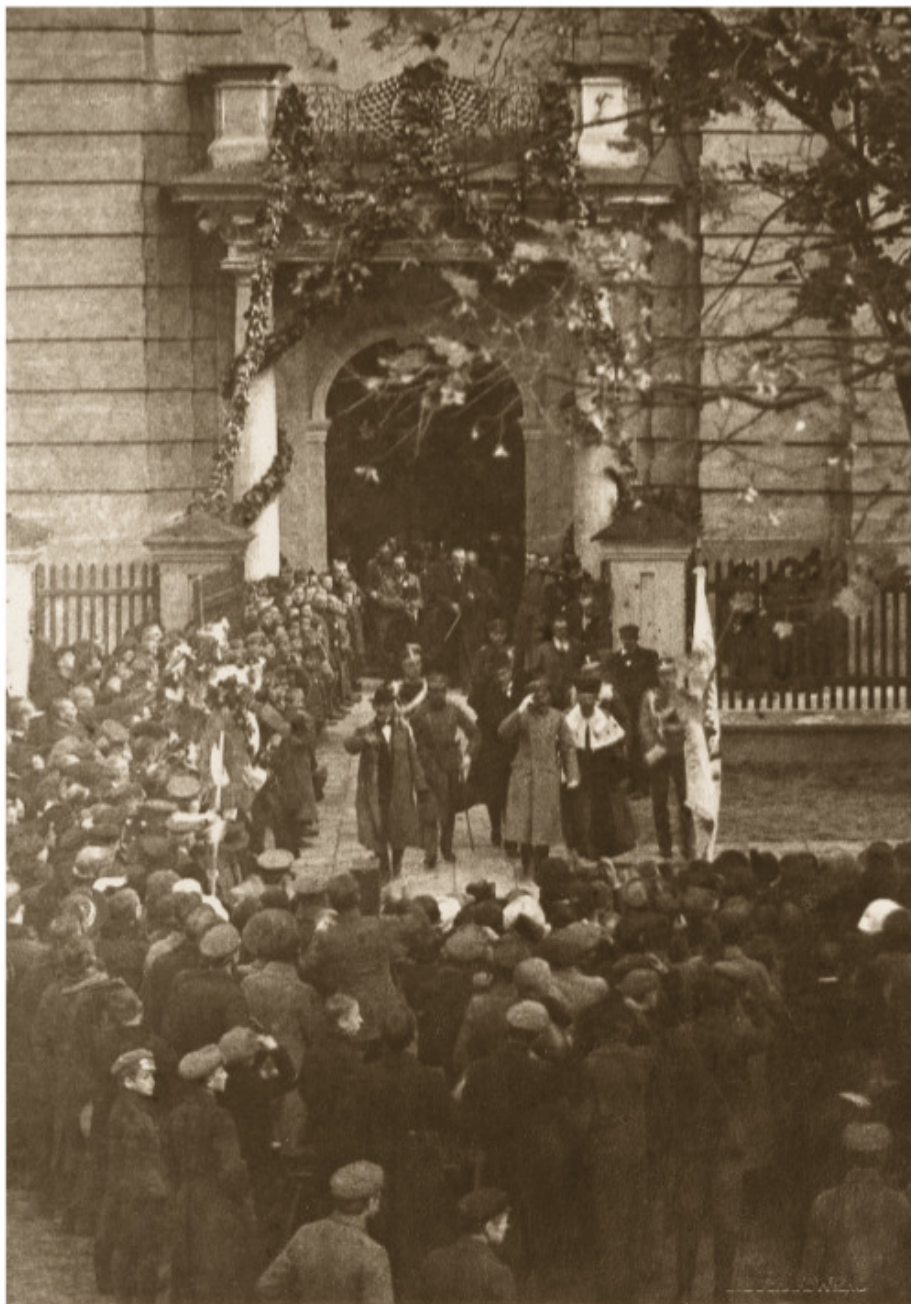
75 Atkurtojo Vilniaus Stepono Batoro universiteto inauguracijos iškilmės prie Šv. Jono bažnyčios 1919 spalio 11