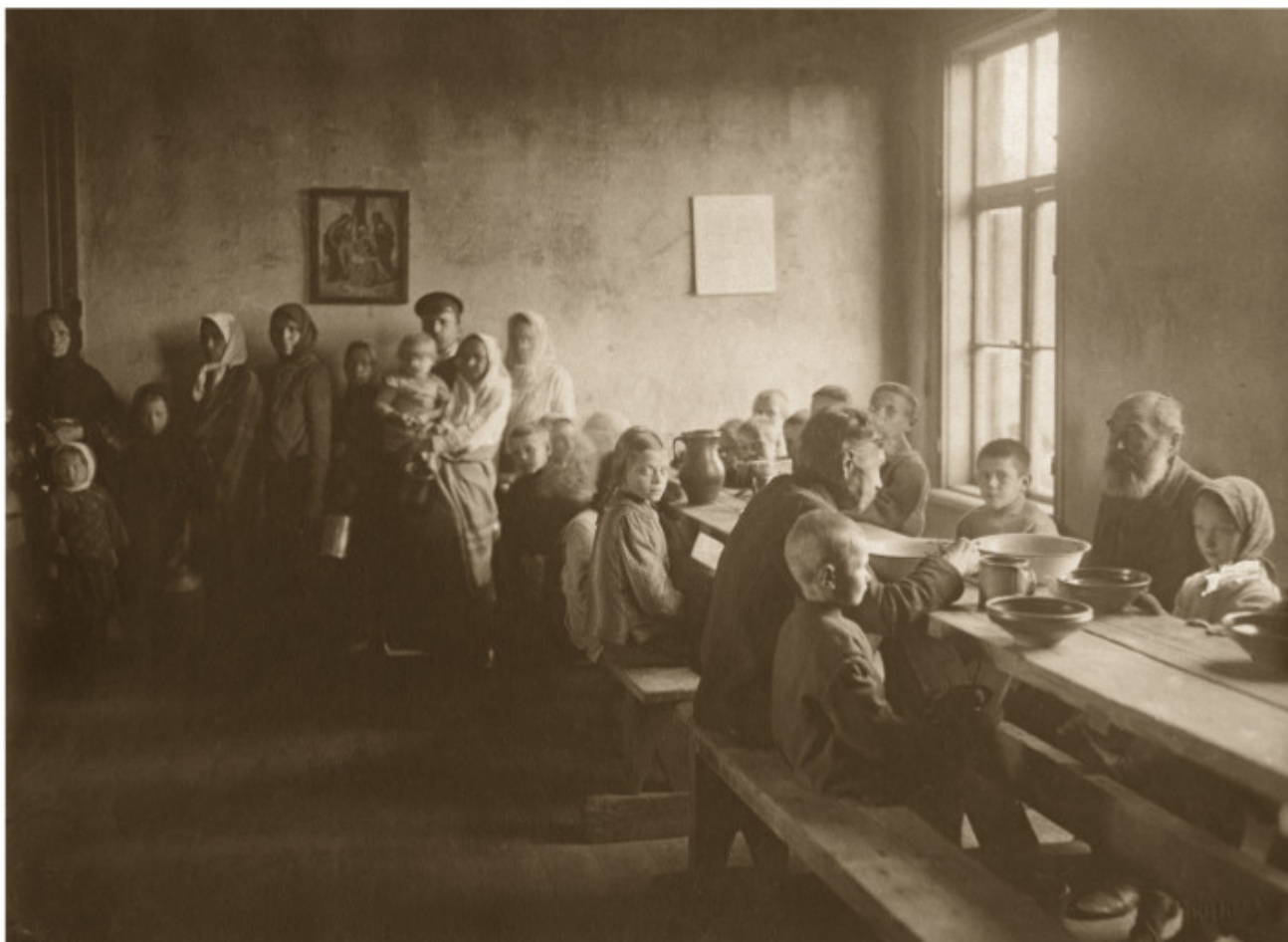
34 Liaudies virtuvė Skapo gatvėje 1916