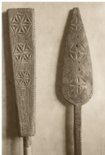
Verpstės. XIX a. pab.–XX a. pr. Lietuvių dailės draugijos rinkinys. 1912–1914