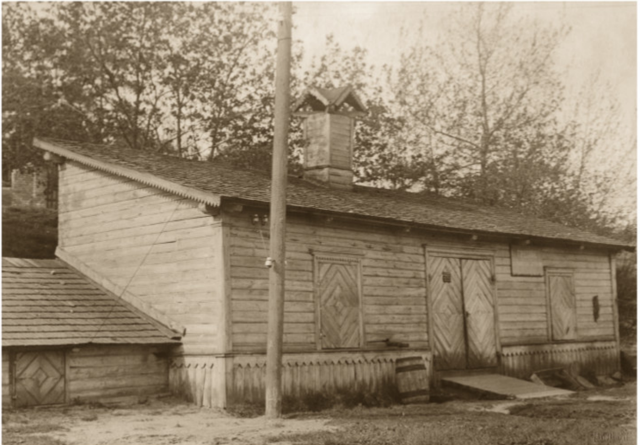
3 Aušros vartų šaltinių vandentiekis 1916