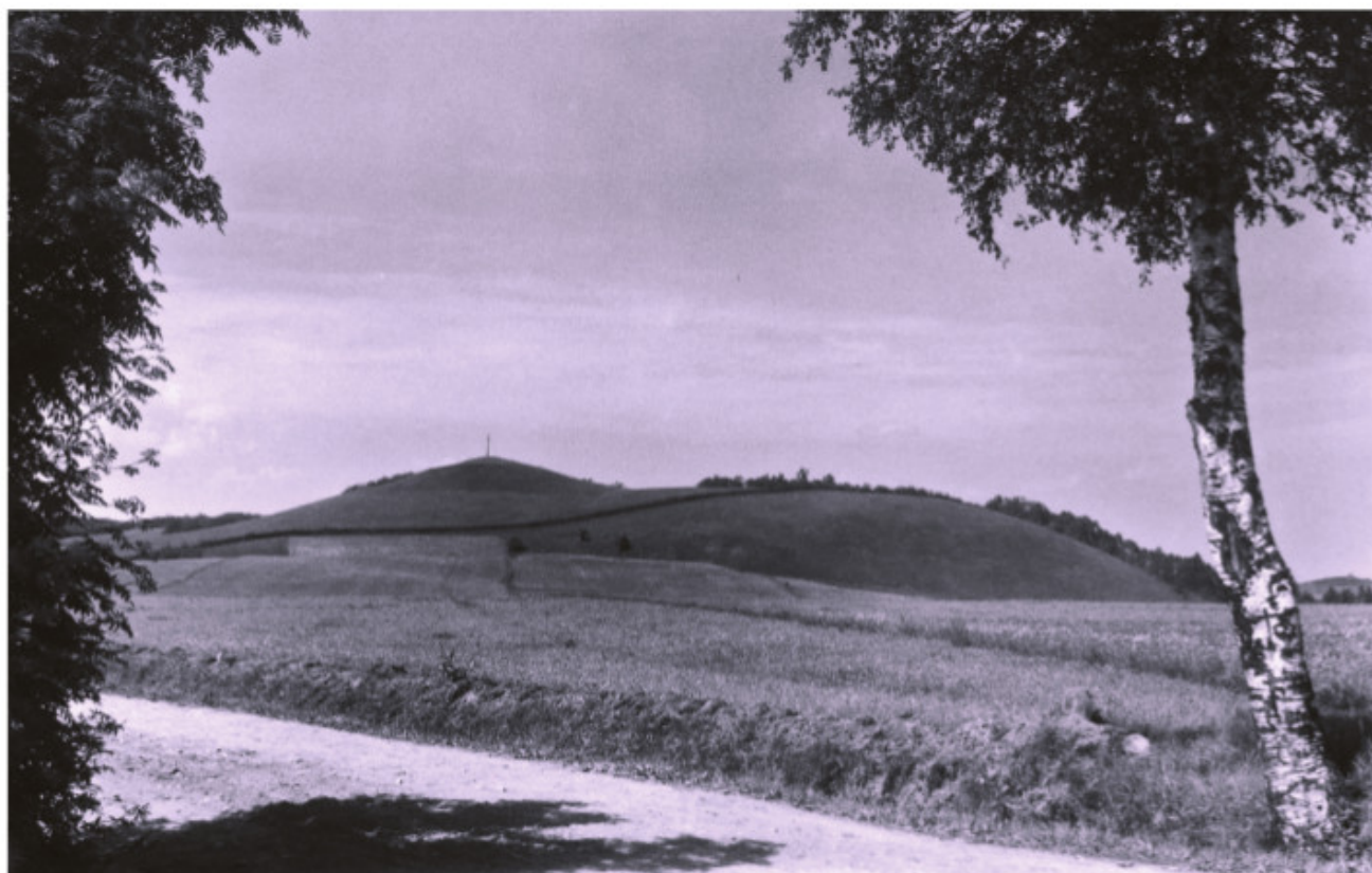
Didžiųjų Burbiškių piliakalnis iš pietryčių pusės

Kiti pavadinimai: Moteraitis, Pavandenės piliakalnis