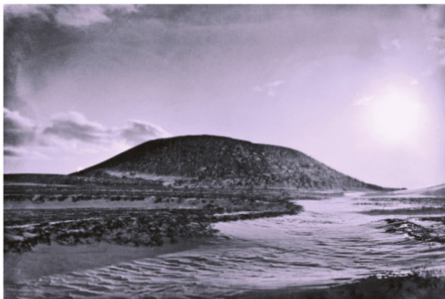
Žuvininkų piliakalnis iš šiaurės pusės

Kitur išsiardavo milžinų kaulų, paslėptų pinigų, puodų šukių, anglių.