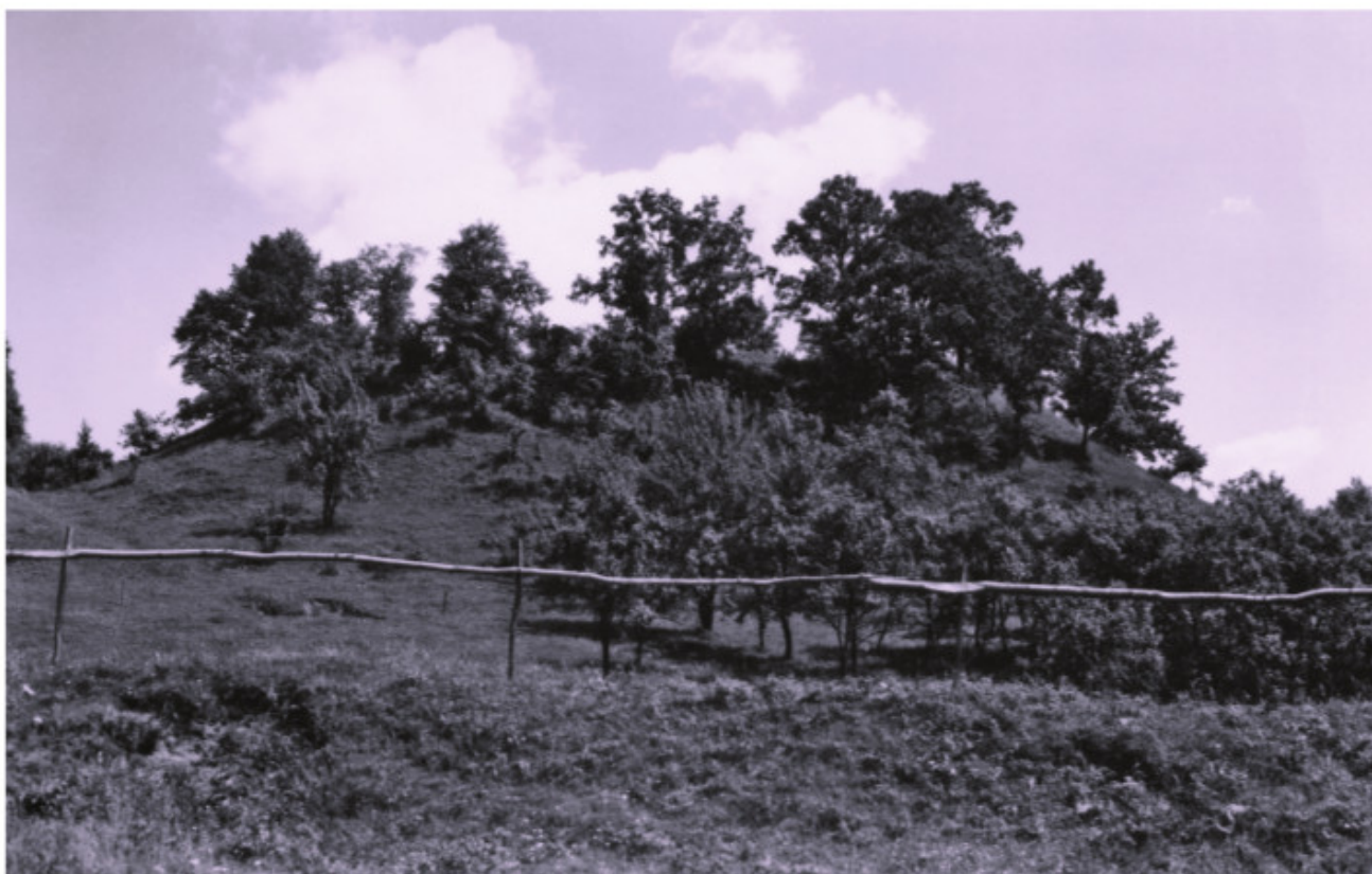
Alytaus piliakalnio dalis: Alyčio kalnas iš pietvakarių pusės