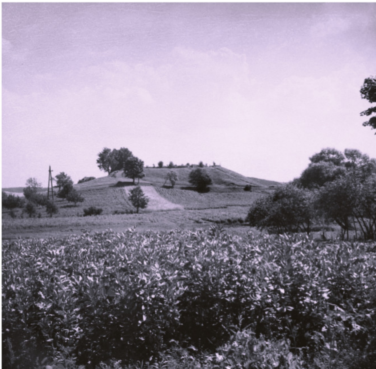
Daugailių piliakalnis iš šiaurės vakarų pusės 1961 m. liepos 15 d. VDKM (BBN 7226)