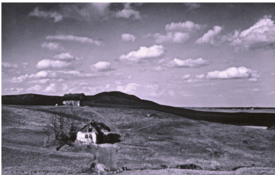
Žuvininkų piliakalnis iš pietryčių pusės