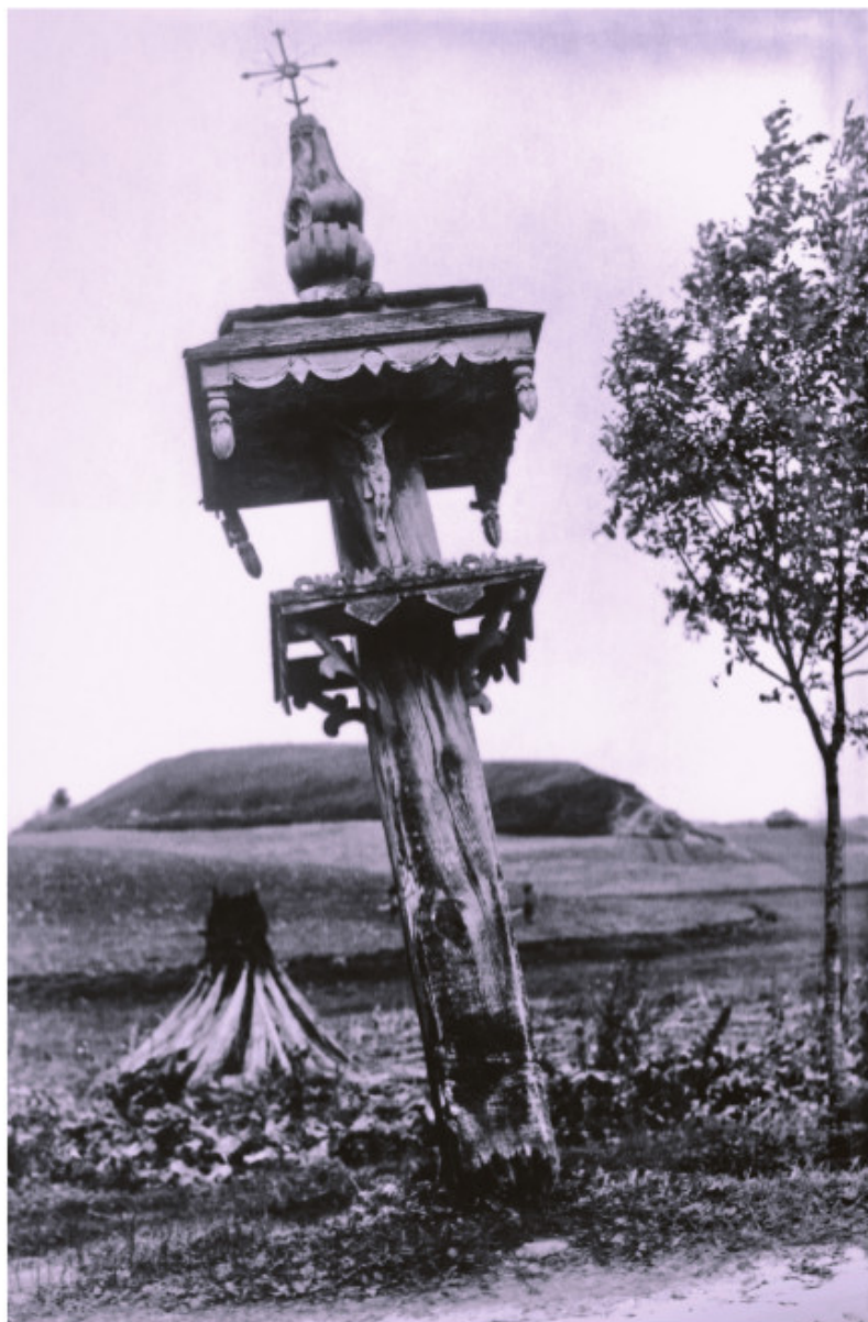
Daugailių piliakalnis 1936 m. liepos 7 d. KPC