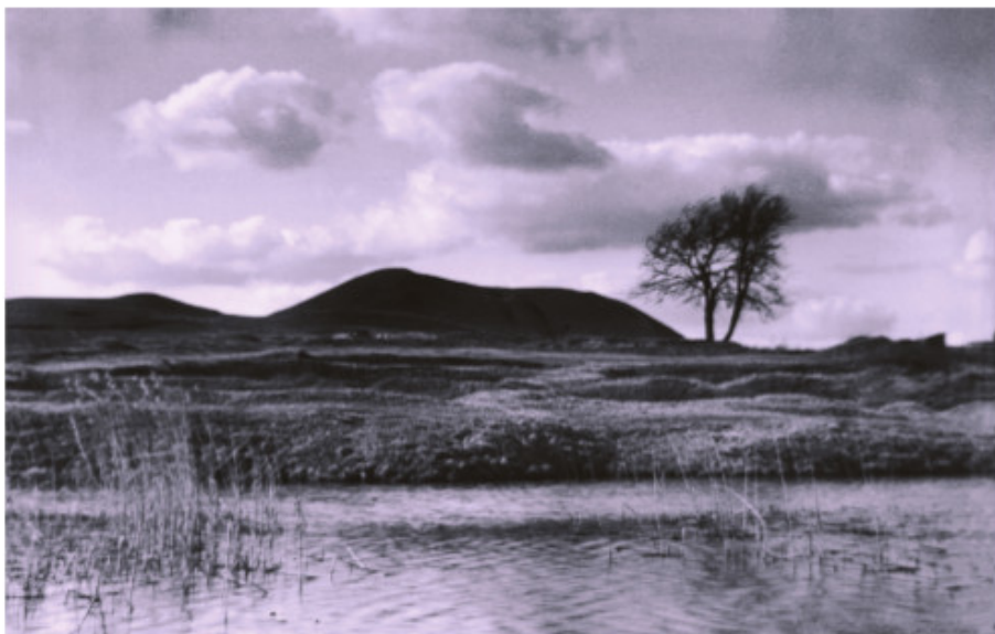
Žuvininkų piliakalnis iš pietų pusės