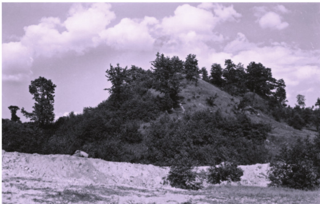
Alytaus piliakalnis iš vakarų pusės: priekyje Migrausėlės, toliau Alyčio kalnas 1961 m. birželio 5 d. LNM (BBN 7115)