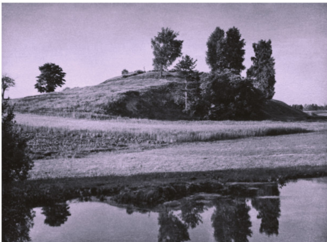
Daugailių piliakalnis iš šiaurės pusės