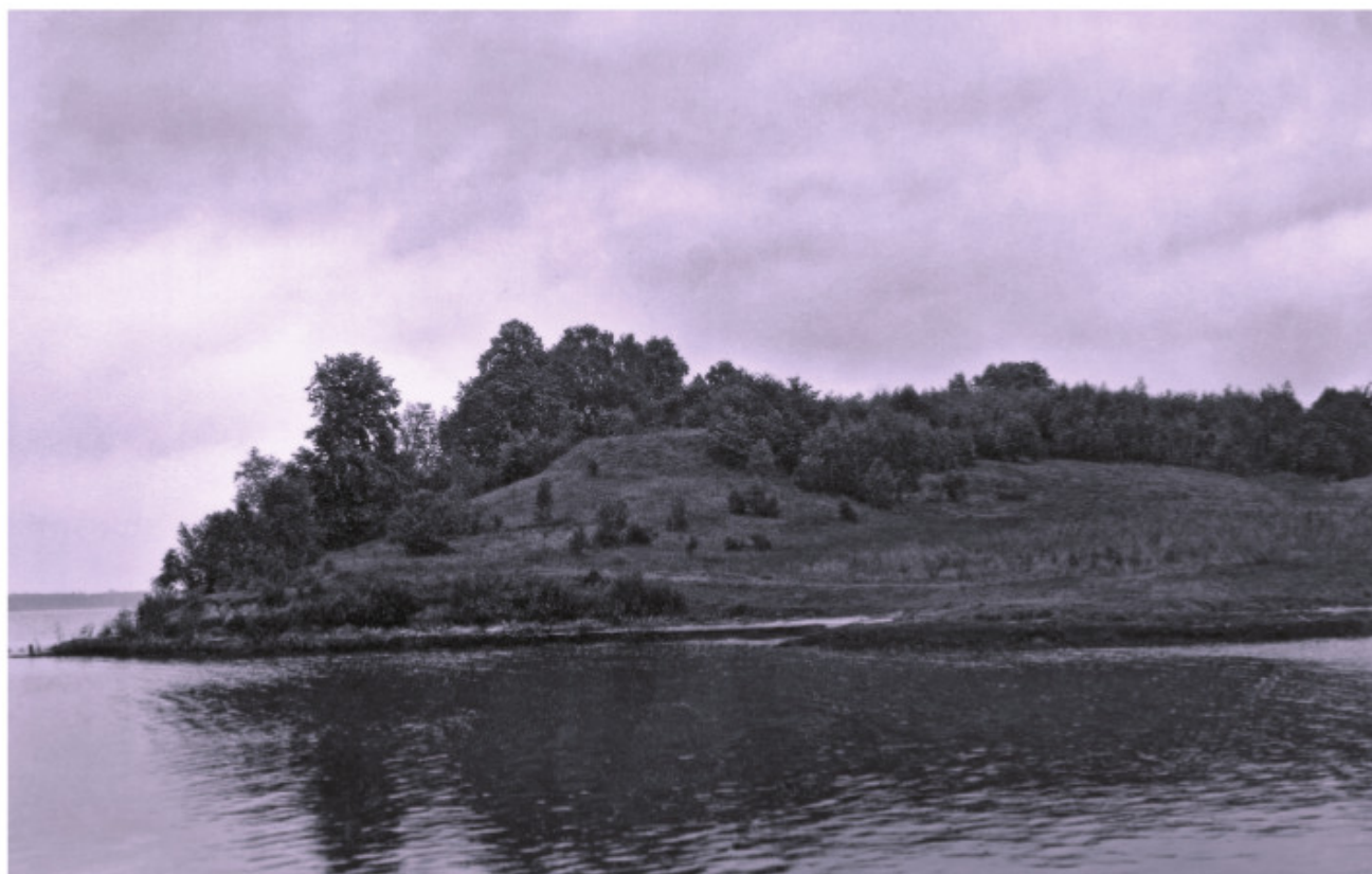
Žiegždrių piliakalnis iš pietvakarių pusės