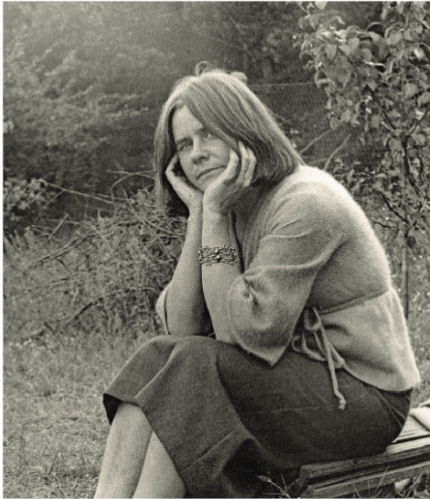
Aliuose, baigus triptiką „Kovos su kryžiuočiais“. 1981