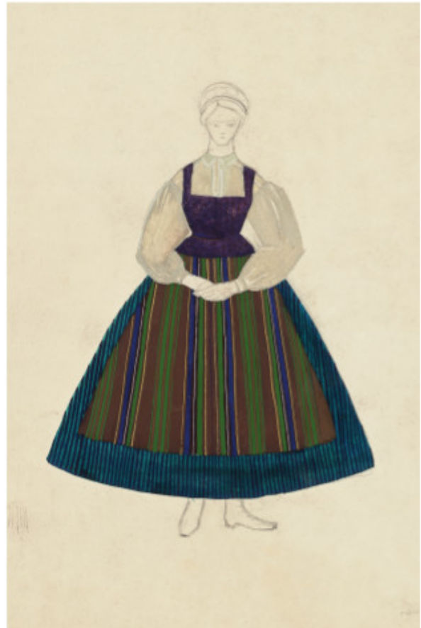
Klaipėdietės tautiniai drabužiai. 1958 Popierius, tempera, 30 x 25