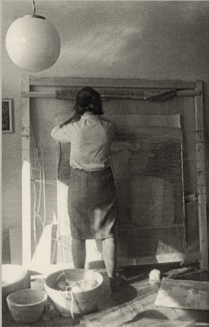
Audžiant „Karvutes“, 1967