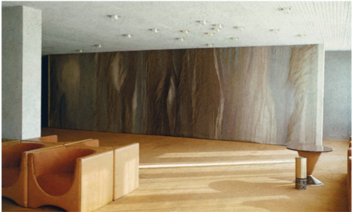
Gobelenas „Miškas“ restorano „Erfurtas“ vestibulyje. Interjero architektas Juozas Algirdas Zinkevičius. Vilnius, 1972

Miškas. Fragmentas. 1971–1972 Gobeleno technika. Vilna, linas, sizalis, 250 x 900