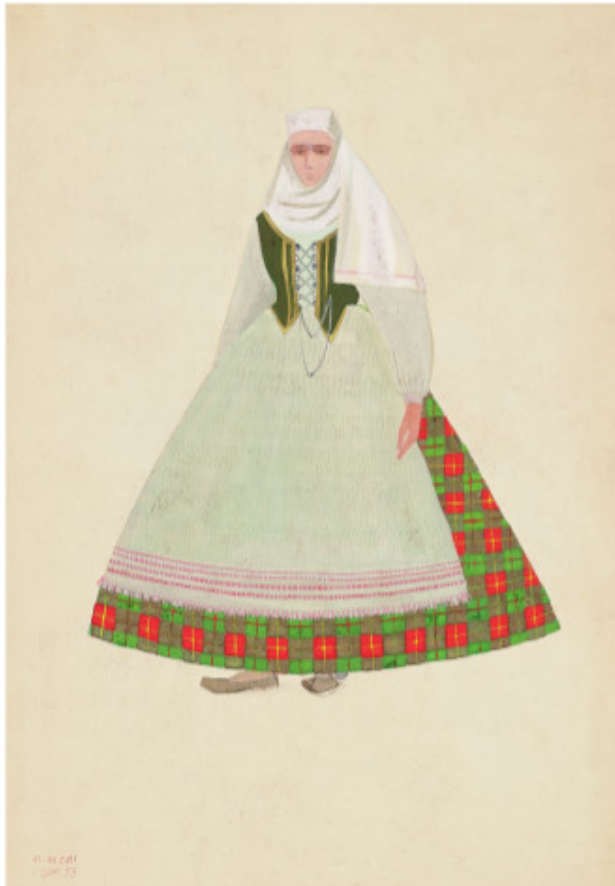
Aukštaitės tautiniai drabužiai. 1958 Popierius, tempera, 30 x 25