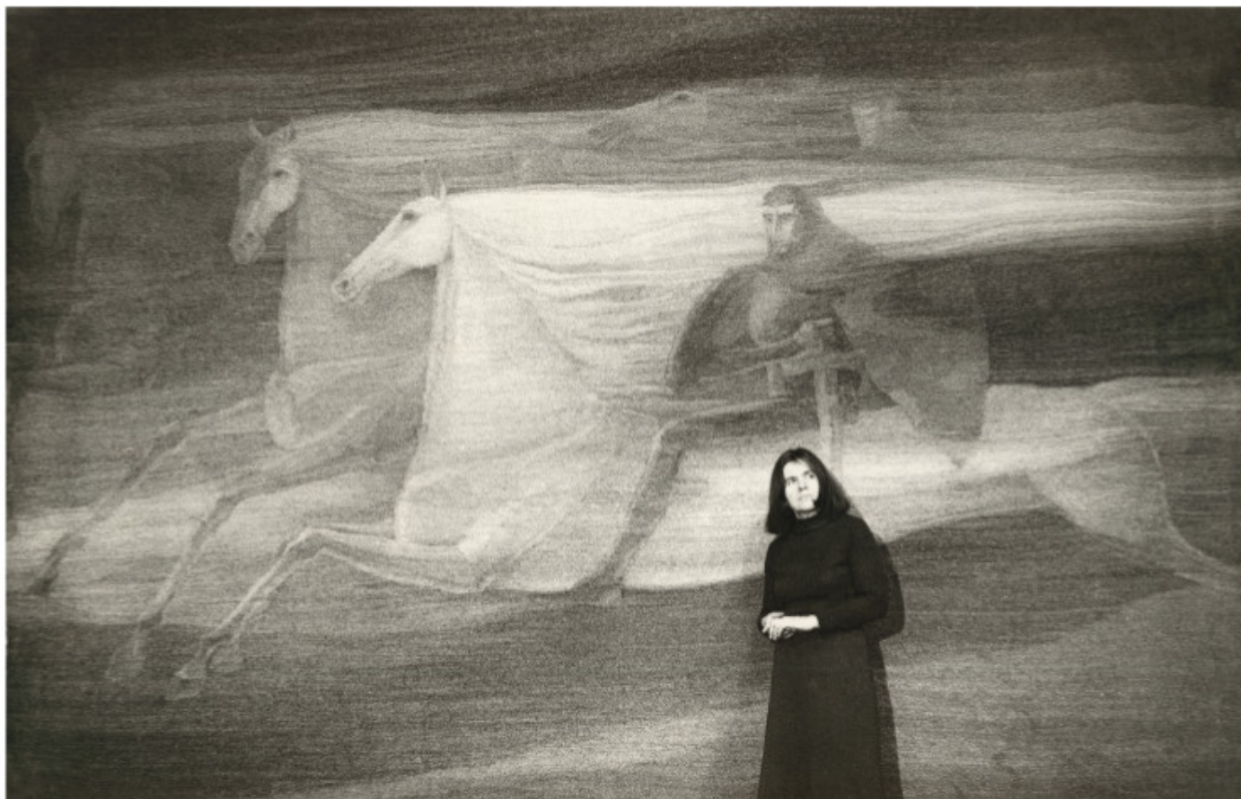
Prie gobeleno „Broleliai“. 1976