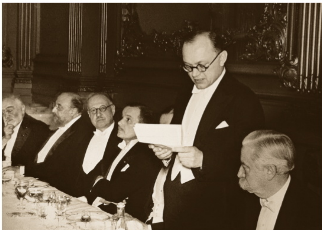
Atnaujinto Prancūzų-baltų komiteto šventiniai pietūs. Iš kairės: pirmas istorikas Henris Hauseris, ketvirtas diplomatas Robertas Coulondre, šeštas Petras Klimas, septintas diplomatas Josephas Noulensas. Paryžius, 1935 m. gegužės 31 d.