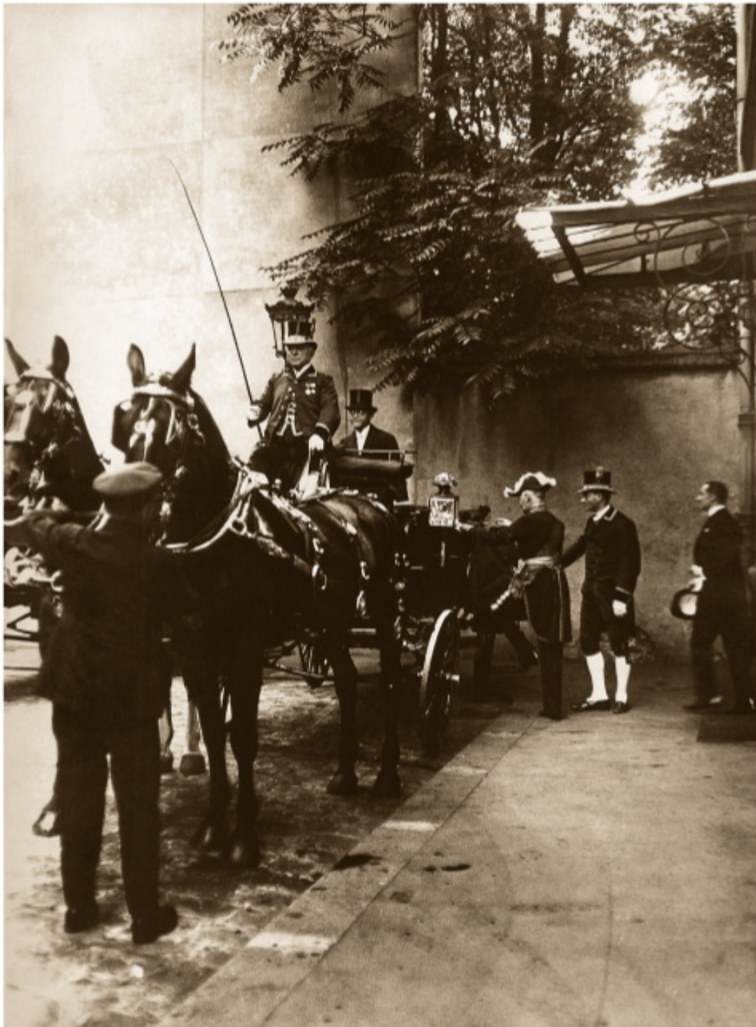
Petras Klimas (karietoje) vyksta į iškilmingą pasiuntinio kredenčių įteikimo Prancūzijos prezidentui Gastonui Doumergui ceremoniją. Paryžius, 1925 m. liepos 17 d.