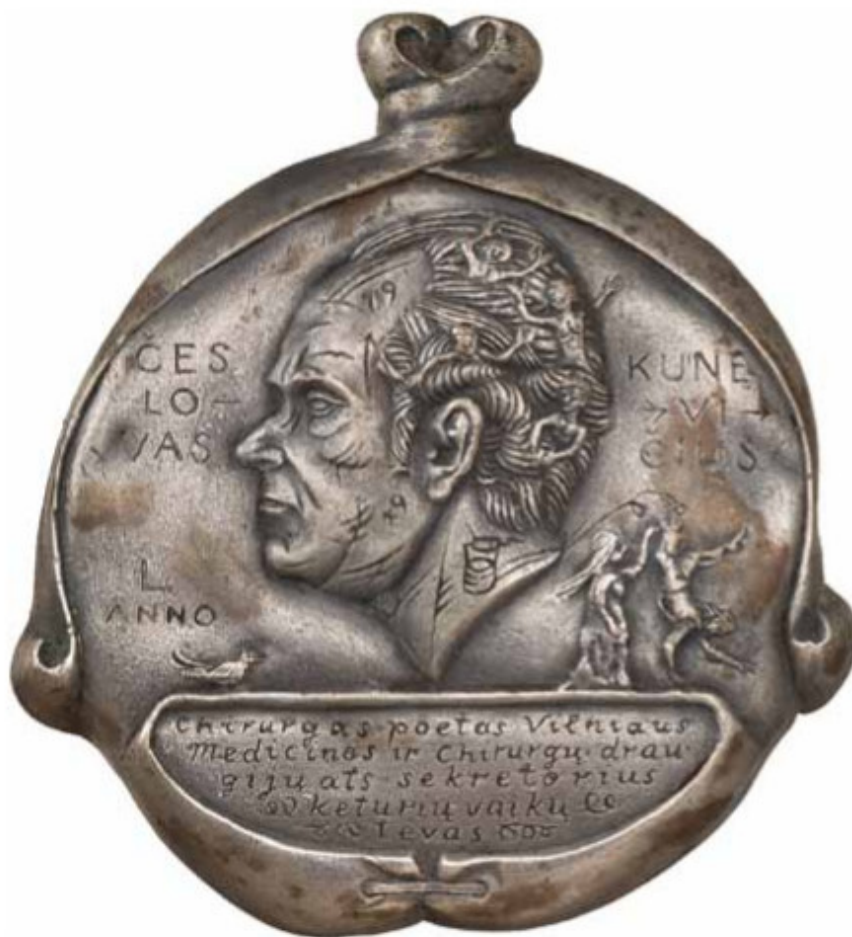
Įrašai: „Česlovas Kunevičius L anno chirurgas poetas Vilniaus medicinos ir chirurgų draugijų ats. sekretorius keturių vaikų tėvas“