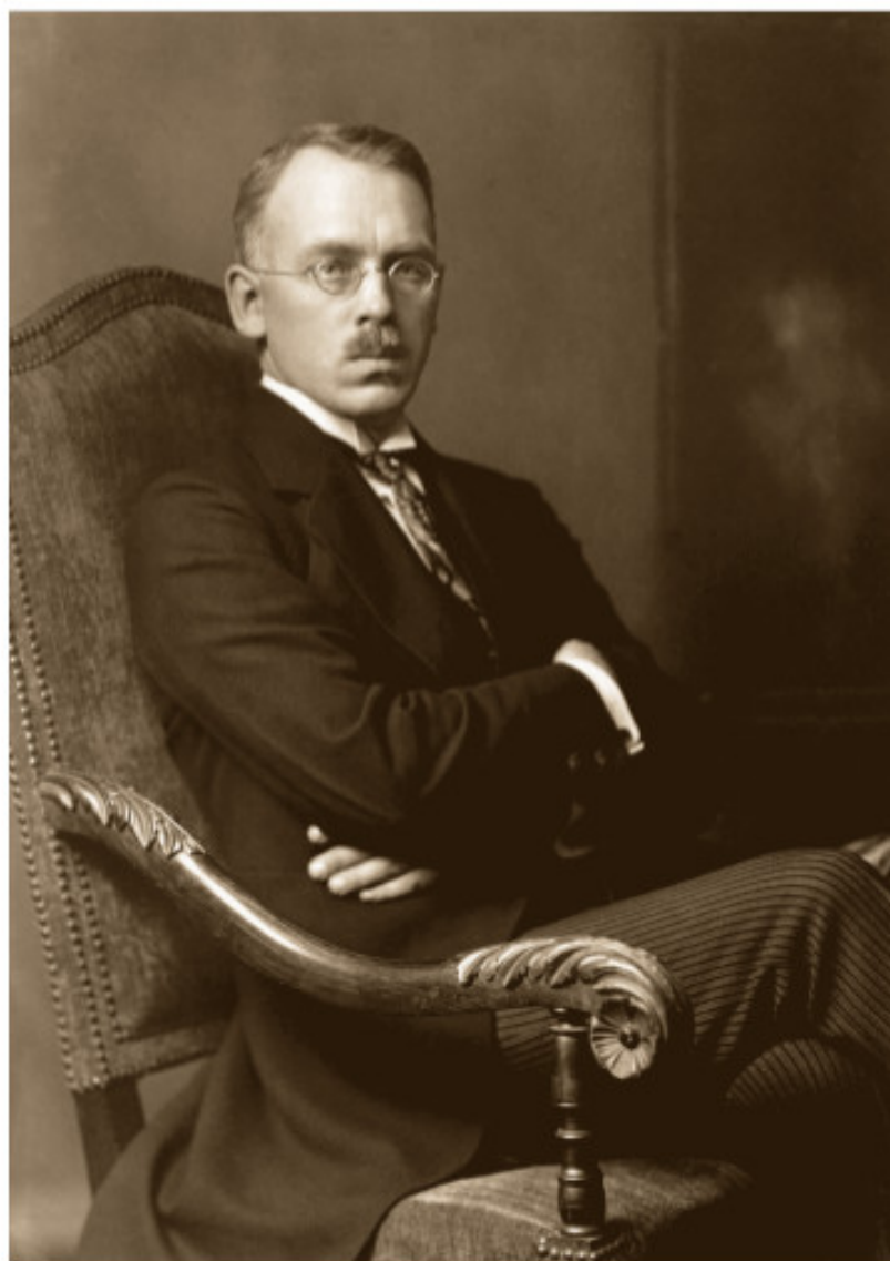
Jurgis Šaulys. Berlynas, apie 1922 m.