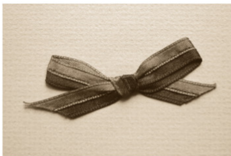
Lietuvių konferencijos dalyvio kaspinėlis – tautinės vėliavos projektas