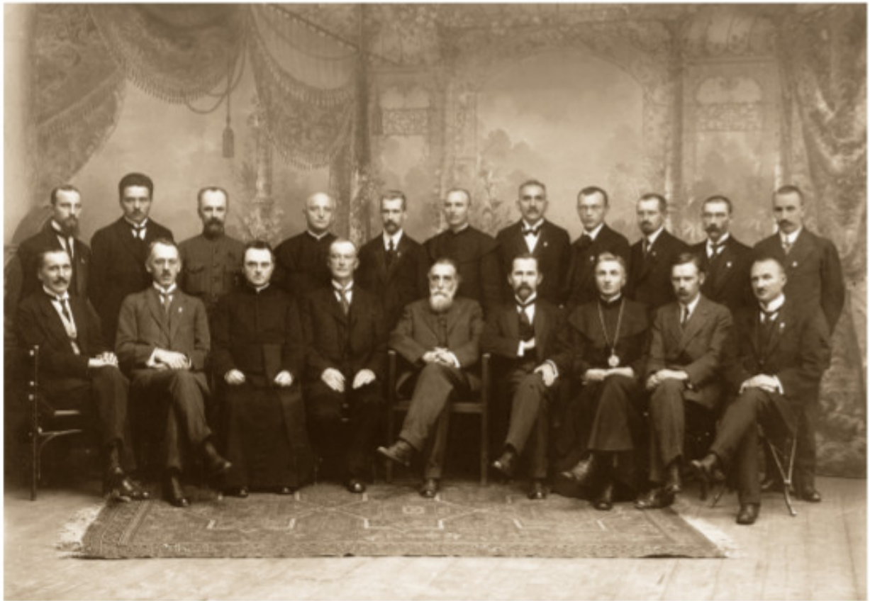
Lietuvos Taryba. Vilnius, 1917 m. rugsėjo 25 d.

Iš kairės pirmoje eilėje: Jonas Vileišis, Jurgis Šaulys, Justinas Staugaitis, Stanislovas Narutavičius, Jonas Basanavičius, Antanas Smetona, Kazimieras Šaulys, Steponas Kairys, Jonas Smilgevičius; antroje eilėje: Kazimieras Bizauskas, Jonas Vailokaitis, Donatas Malinauskas, Vladas Mironas, Mykolas Biržiška, Alfonsas Petrulis, Saliamonas Banaitis, Petras Klimas, Aleksandras Stulginskis, Jokūbas Šernas, Pranas Dovydaitis.