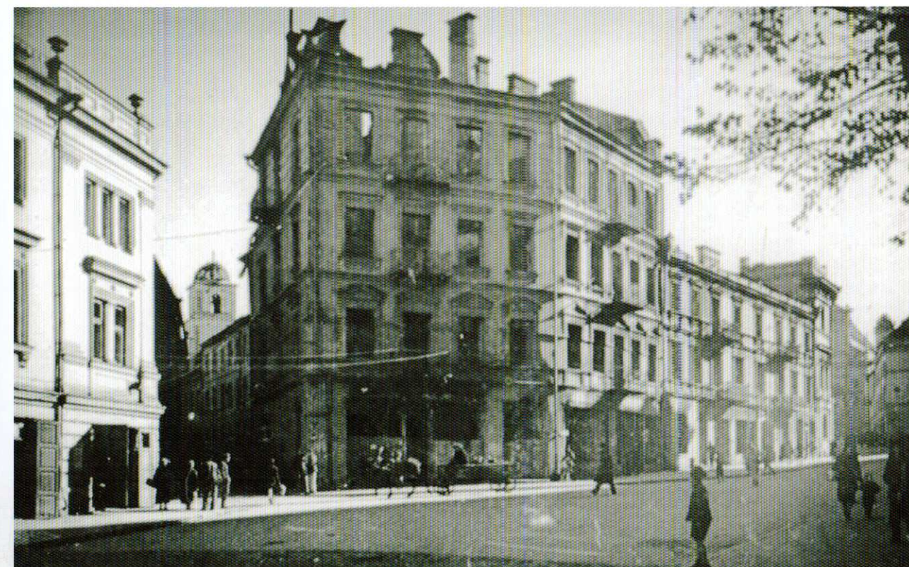
Aušros Vartų g. (dabartinė aikštė priešais Lietuvos nacionalinę filharmoniją) 1944 m., J. Bulhakas