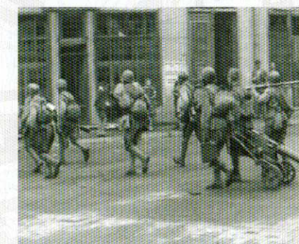
Kadrai iš Sovietinių kino kronikų