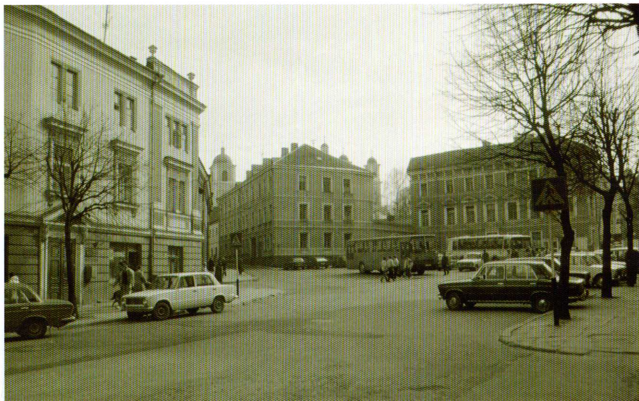
1. Aušros Vartų g. ir Subačiaus g. sankirta 1990 m.