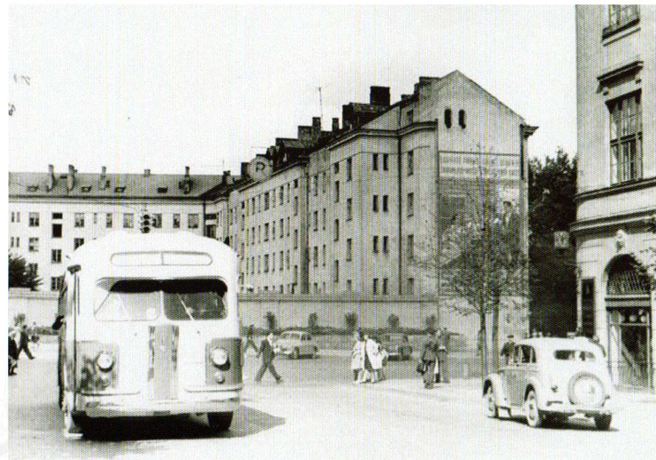
Gedimino pr. 1949 m.