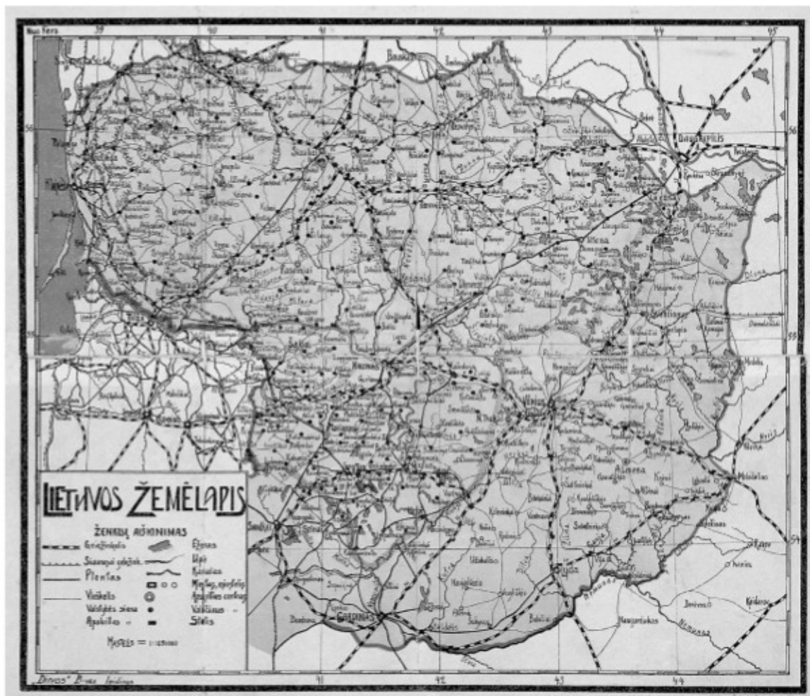
Lietuvos žemėlapis. 1: 1 050 000. Iš leidinio Lietuvos taikos sutartis su Rusija , Marijampolė: „Dirvos“ bendrovė; Kaunas: Lietuvos Valstybės spaustuvė, 1920.

Lietuvos taikos sutartis su Rusija buvo pasirašyta 1920 m. liepos 12 d.