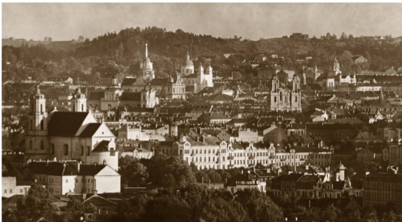
Vilniaus panorama. Apie 1925 m. LMAVBR5