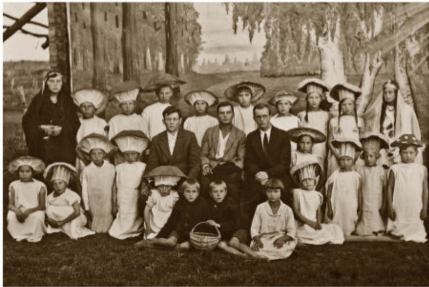
Adutiškio mokyklos mokiniai vaidina grybus