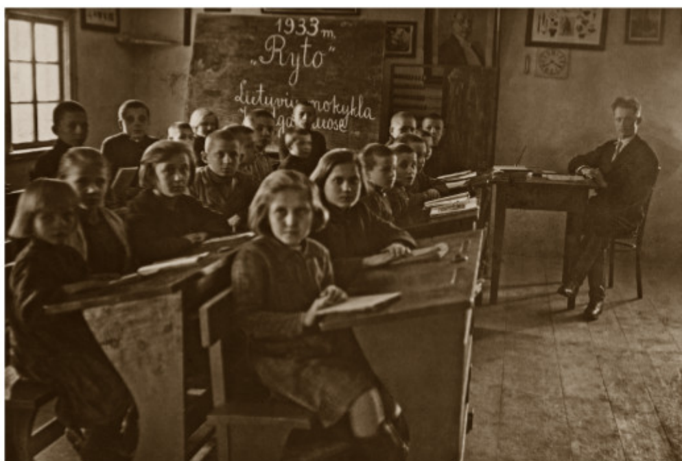
Juodagalvių mokykla. Mielagėnų vls., Švenčionių aps.