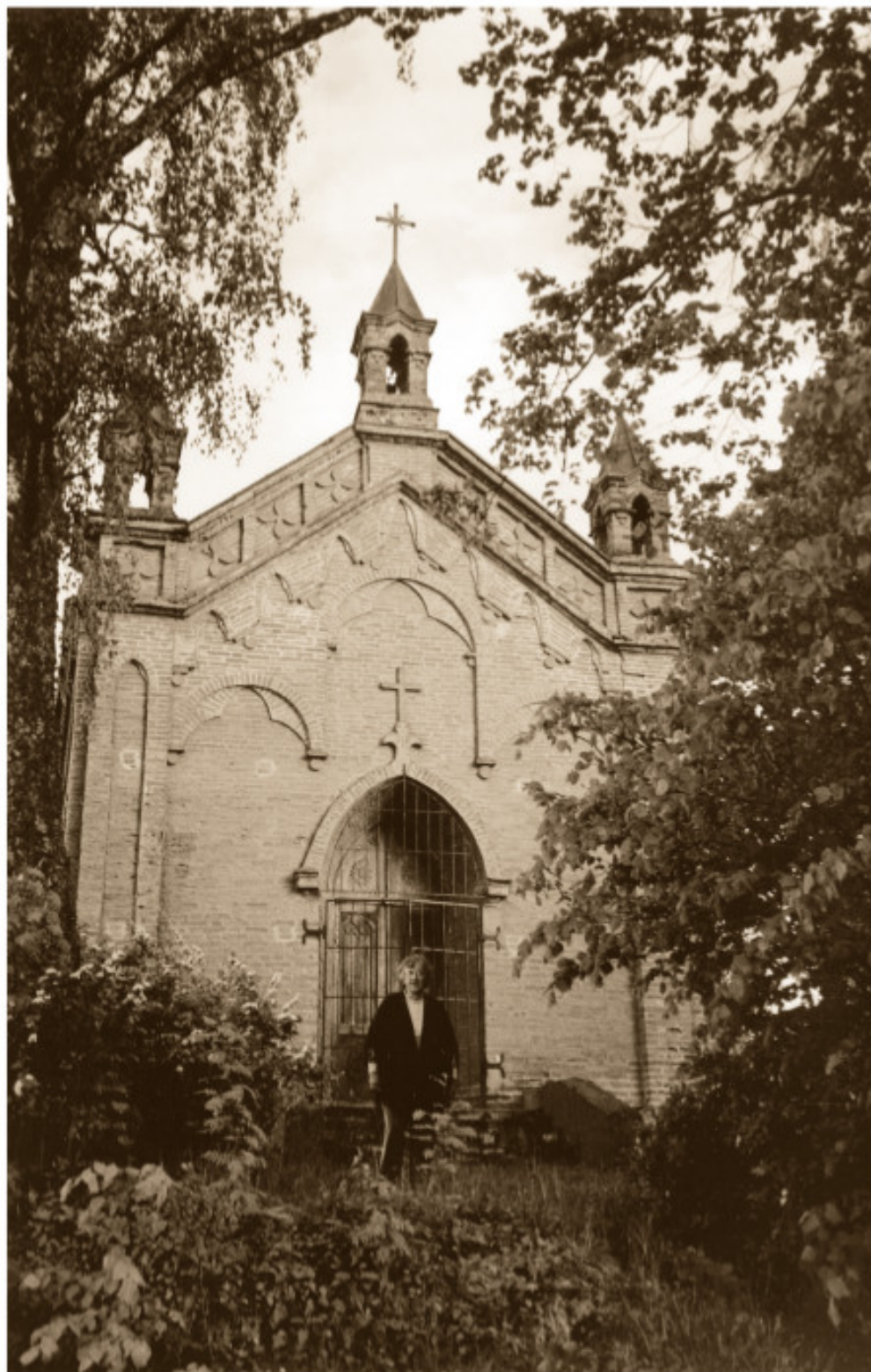
Bukauškių dvaro koplyčia – vienintelis išlikęs dvaro pastatas