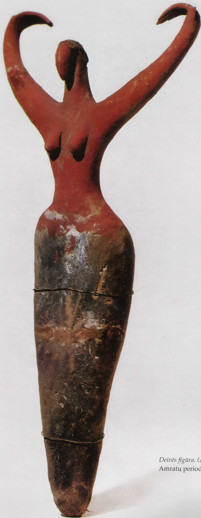
Deivės figūra. (Apie 4000–3500 m. pr. Kr.), Amratų periodas. Brooklyn muziejus, Niujorkas.