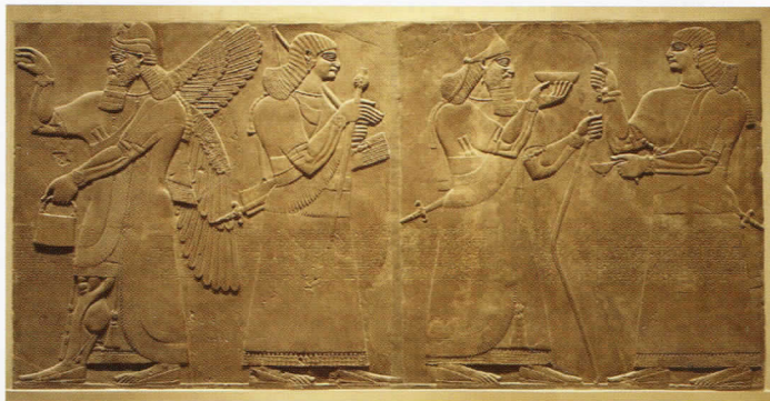
Mesopotamijos reljefas. (883–859 m. pr. Kr.), Metropolitan muziejus, Niujorkas.

Paskutiniai archeologiniai kasinėjimai vyko Vidurinėje Azijoje – Kazachstane, Uzbekistane, Turkmenistane, toliau į vakarus – Kurdistane ir Antaliijoje. Visi šie tyrinėjimai archeologams atskleidžia kur kas tolimesnę praeitį negu šumerų civilizacija.