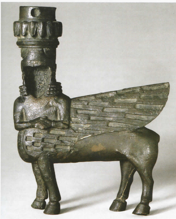
Kentaures figūra. (VII a. pr. Kr.), Britų muziejus, Londonas.