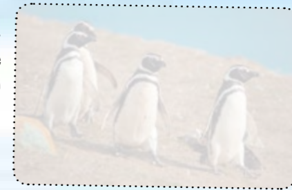
Magelaniniai pingvinai Patagonijoje (Argentina)