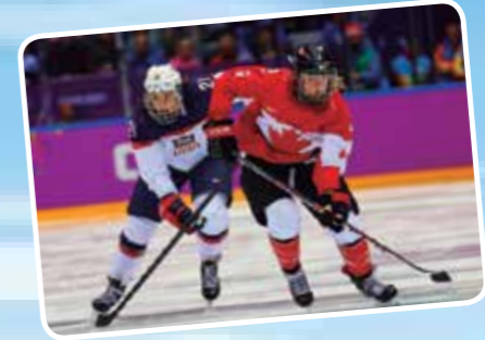
Ledo ritulys JAV ir Kanadoje