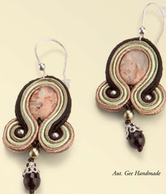
Aut. Gee Handmade