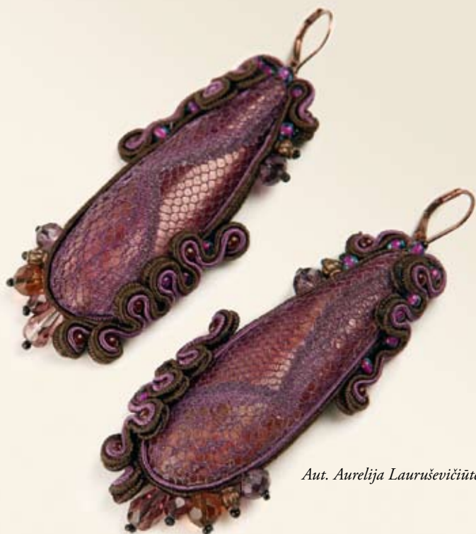
Aut. Aurelija Lauruševičiūtė