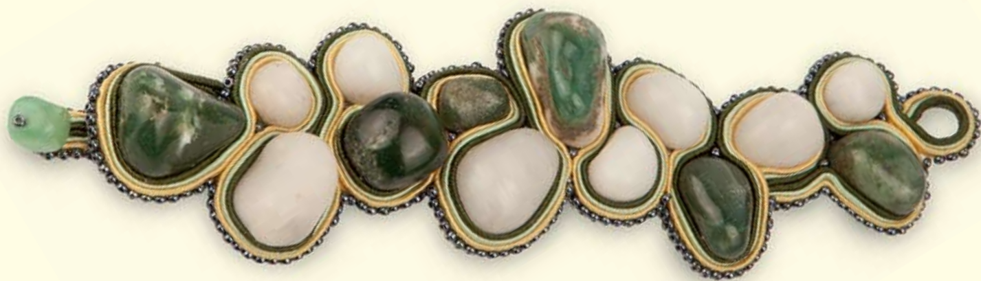
Aut. Kristina Garškienė