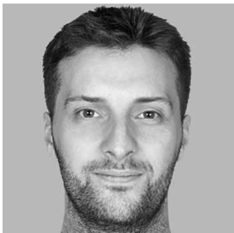
Klifa realiaame gyvenime