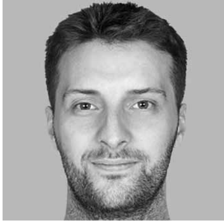
Klifo atvaizdas veidrodyje

O štai kaip Klifas tariasi atrodaš matydamas savo atvaizdą veidrodyje: