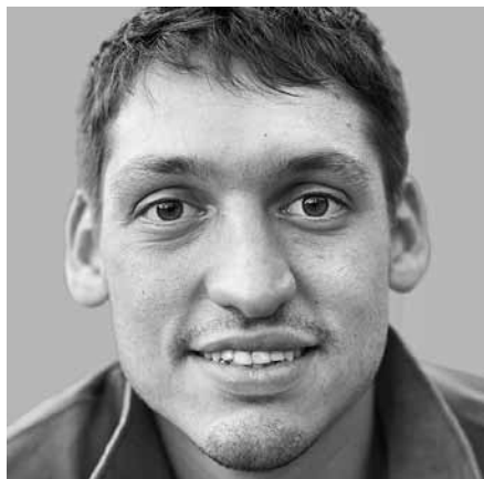
Fredo atvaizdas veidrodyje

Tarp kita ko, nedideli Fredo apykaklės skirtumai iš abiejų kaklo pusių padeda jums tinkamai nukreipti žvilgsnį. Kaip apdairiai vyrukas pasielgė taip apsirengdamas, tiesa?