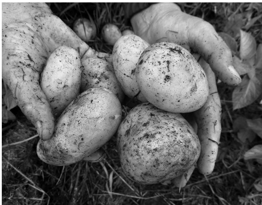
Išsikasiau rankomis; gamtinė žemdirbystė Bilaišiuose.

protėvių tikrai toli, rugio dainos neapbrėpiamos. Ir rugio motyvas – poezijoje. Tai ne šiaip sau, tai nėra atsitiktinis dalykas, o pirminė kantrybės gyventi išmintis. Gyvenimas nėra pramoga ar spektaklis – nusibodo ir išeini, negalvodamas apie tuos, kuriuos palieki. Kam vargintis. O juk negalima tikėtis, kad pragyvensi be vargo, kad neteks kentėti. Teko, tikrai teko. Reikia tam ruoštis. Gyvenimas reikalauja kantrybės. Tą kantrybės gyventi principą reikėtų kloti į šiuolaikinės didaktikos ir moralės pamatus, jį aiškinti, aiškintis, ugdyti. Nebūtina laimėti, svarbiausia išverti – iš R. M. Rilke's supratau šį principą, jau autoritetingai ištartą. Kad suprastum tai, kas jau parašyta, reikia būti iki to priėjus kažkokiu kitu keliu, gal ir savaiminiu. Savaiminiu sielos rūpesčiu pačia savimi, savaiminėmis pastangomis aptikti save pasaulyje, žolės šešėlyje, vaiko žvilgsnyje, tobulame bulvės ovale. Aptikti ir ištartį, nors ir niekam negirdint, – aš esu . Klausimai, kurie kyla mano tyloje, yra tie patys klausimai