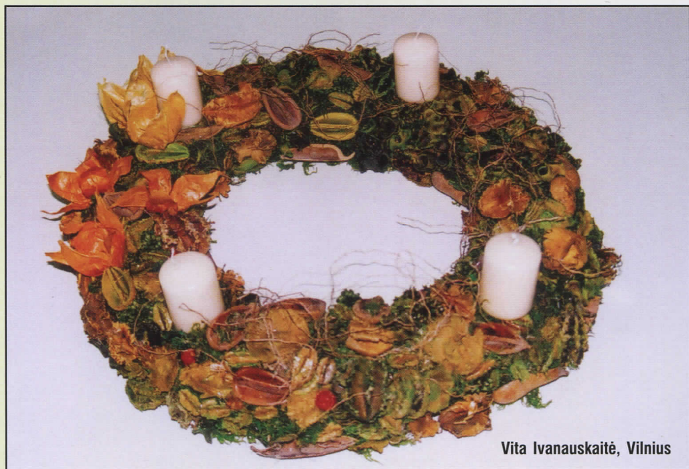
Vita Ivanauskaitė, Vilnius