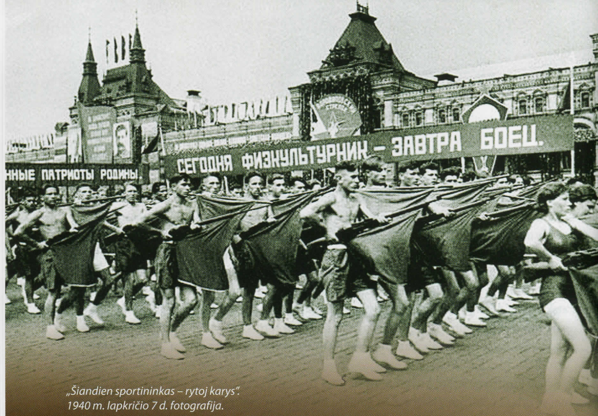
„Šiandien sportininkas – rytoj karys“. 1940 m. lapkričio 7 d. fotografija.