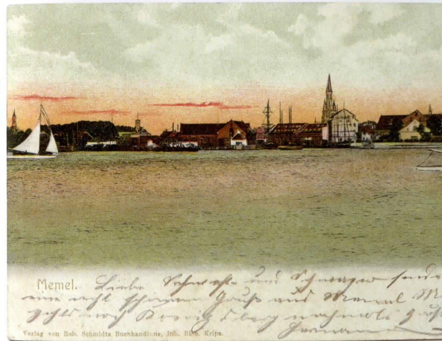
Klaipėda. Miesto panorama iš Smiltynės Memel vom Sandkrug gesehen Klaipėda. Panorama from Smiltynė

H.Reich, Papier- und Buchhandlung – Ansichtskartenverlag, Memel 1918-03-14, Memel