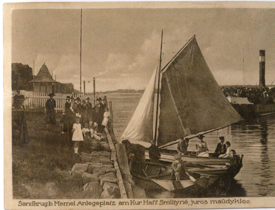
Sandkrug b. Memel. Anlegeplatz am Kur. Haff, Smiltynė, jūros maudyklos

Verlag: Gebrüder Siebert, Inh. Kurt Siebert, Memel