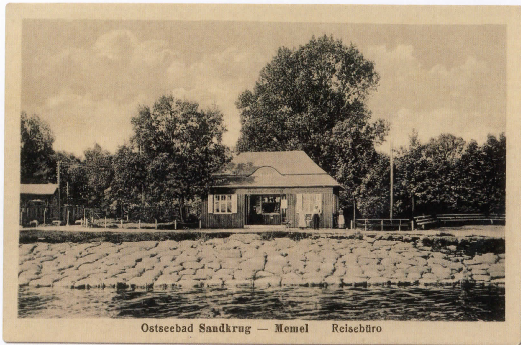
Ostseebad Sandkrug — Memel Reisebüro