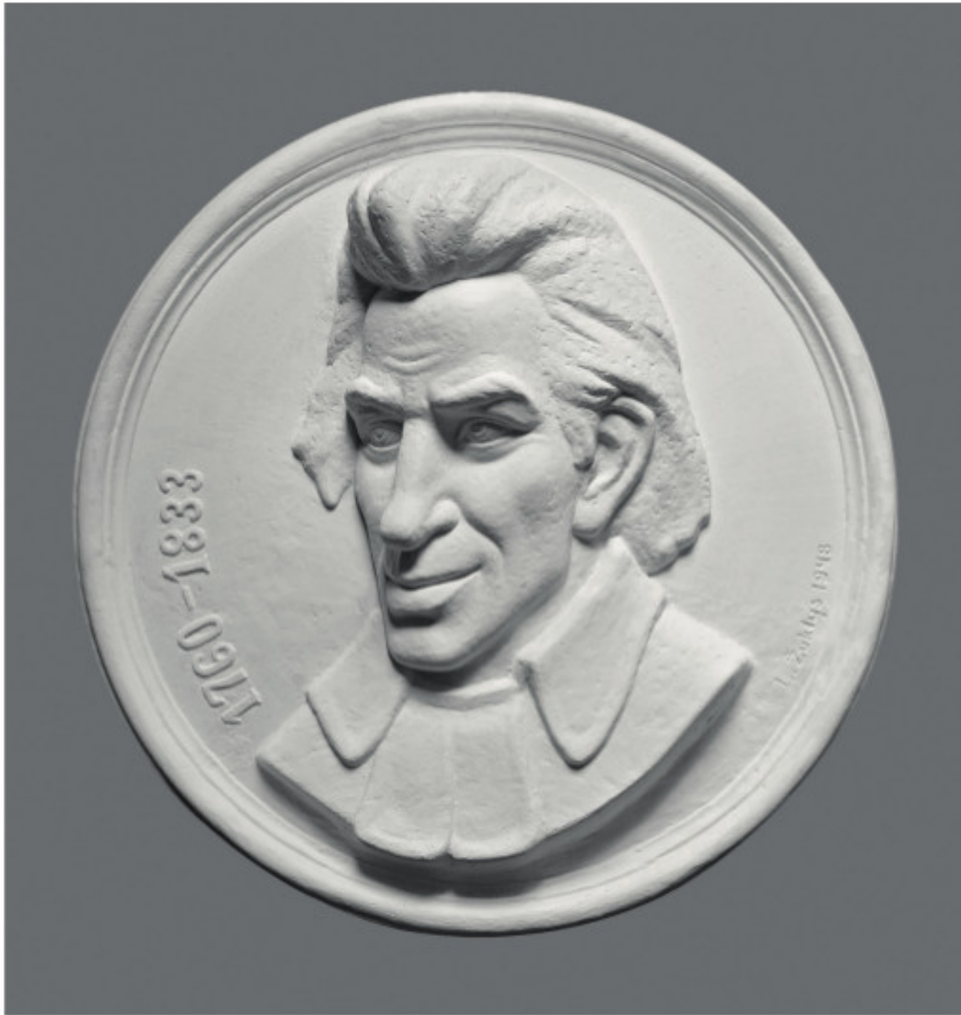
Poetas kunigas Antanas Strazdelis. 1948 Gipsas