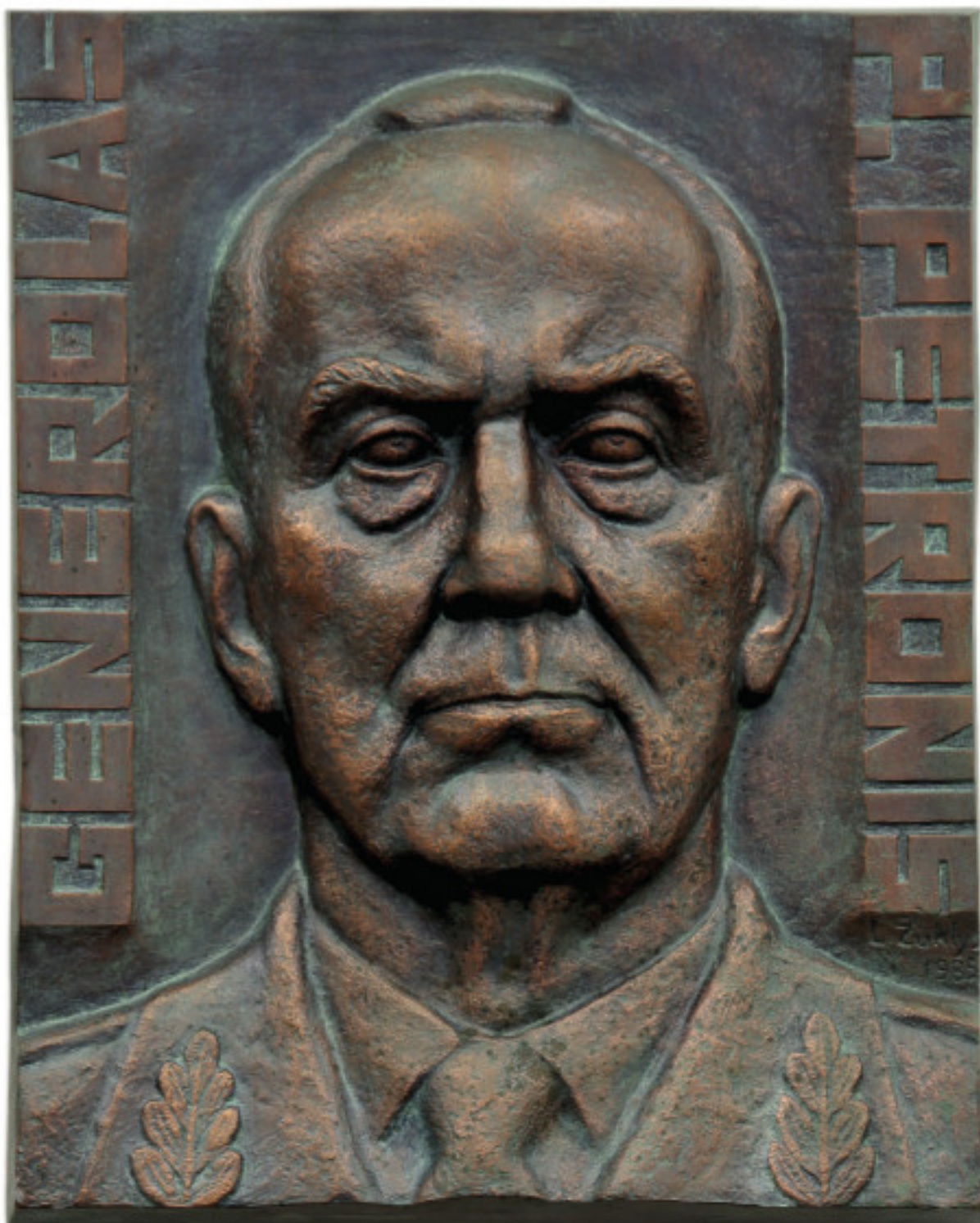
Generolas majoras Petras Petronis. 1985 Variuotas aliuminis