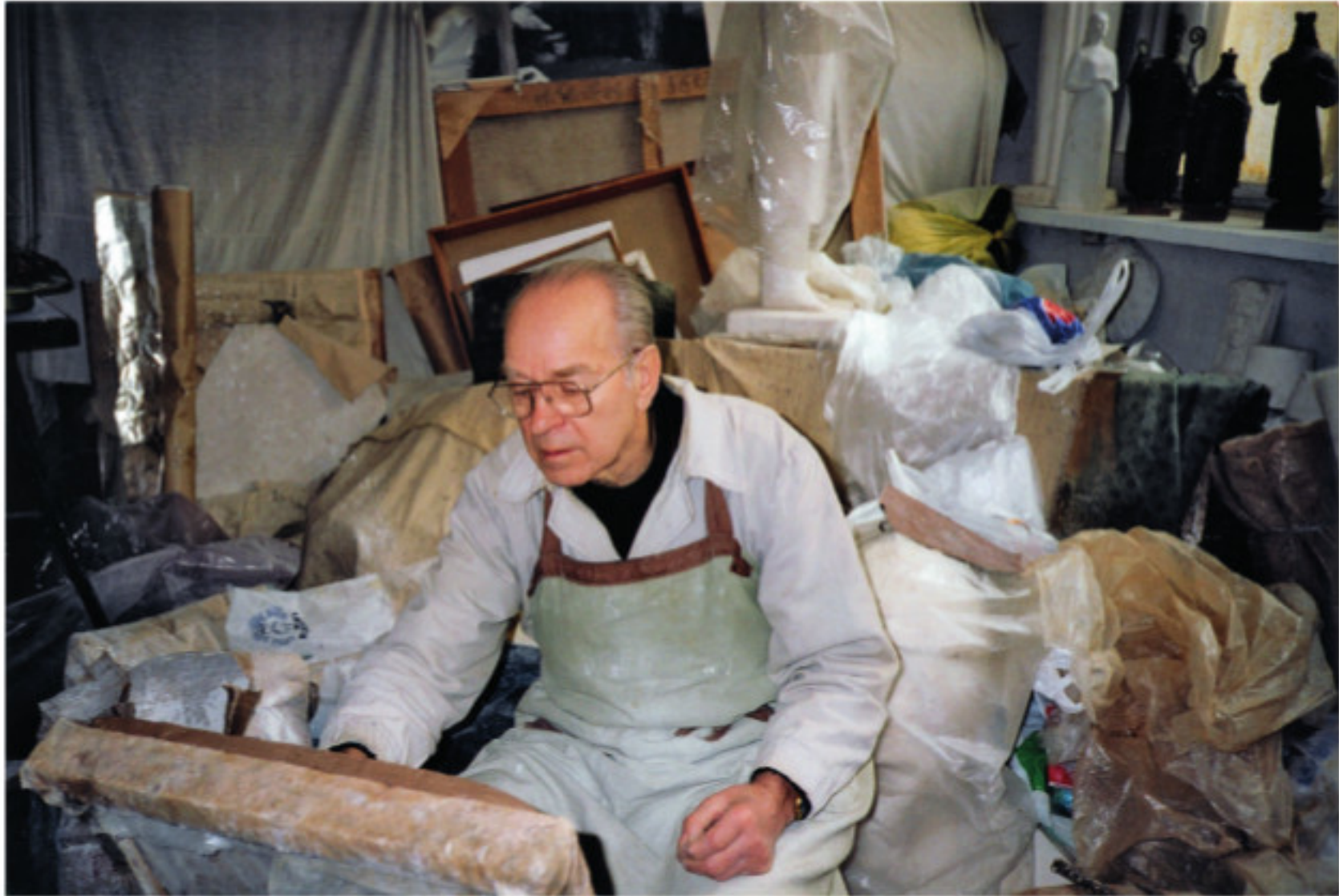
Skulptorius Leonas Žuklys savo studijoje. 2013