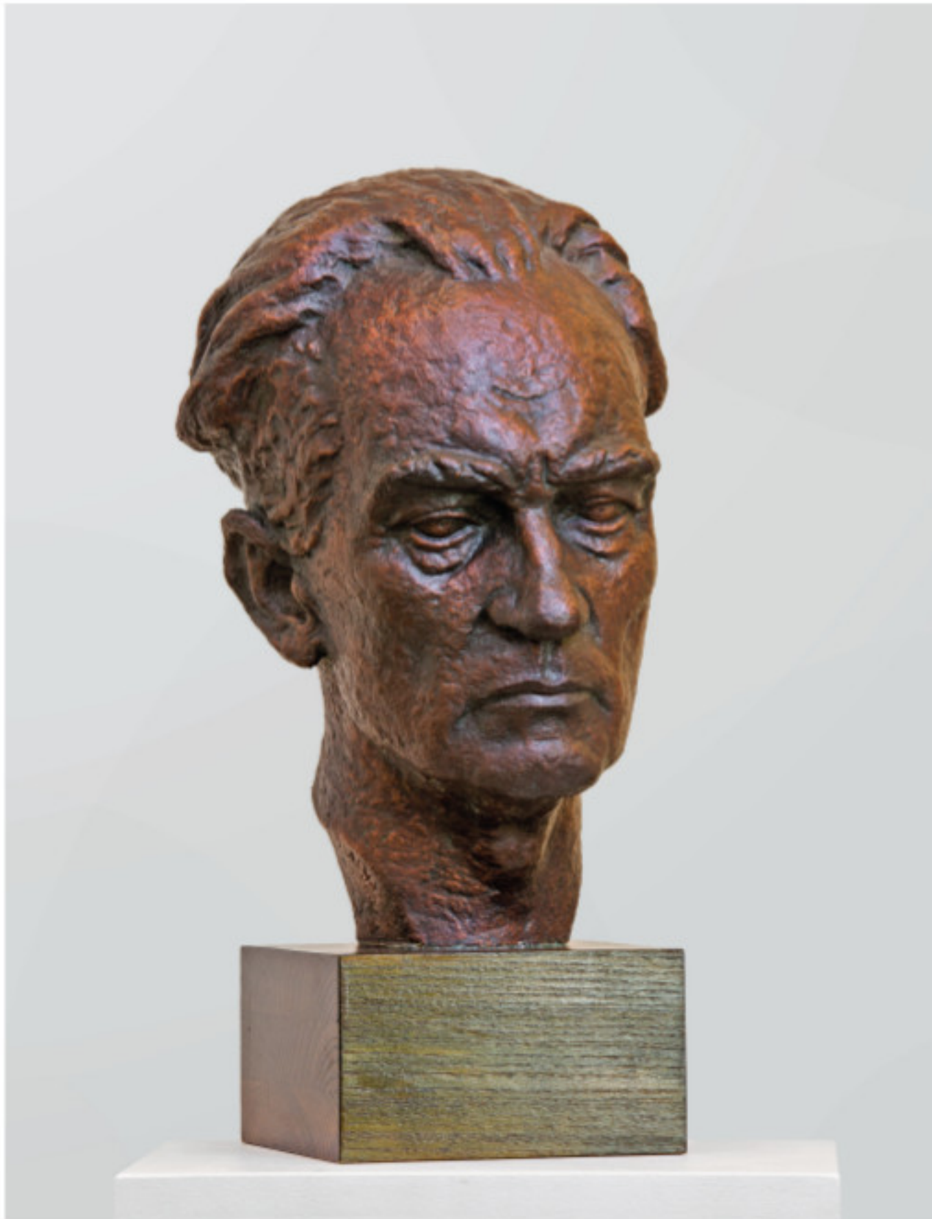
Rašytojas akademikas Vincas Mykolaitis-Putinas. 1958 Variuota terakota