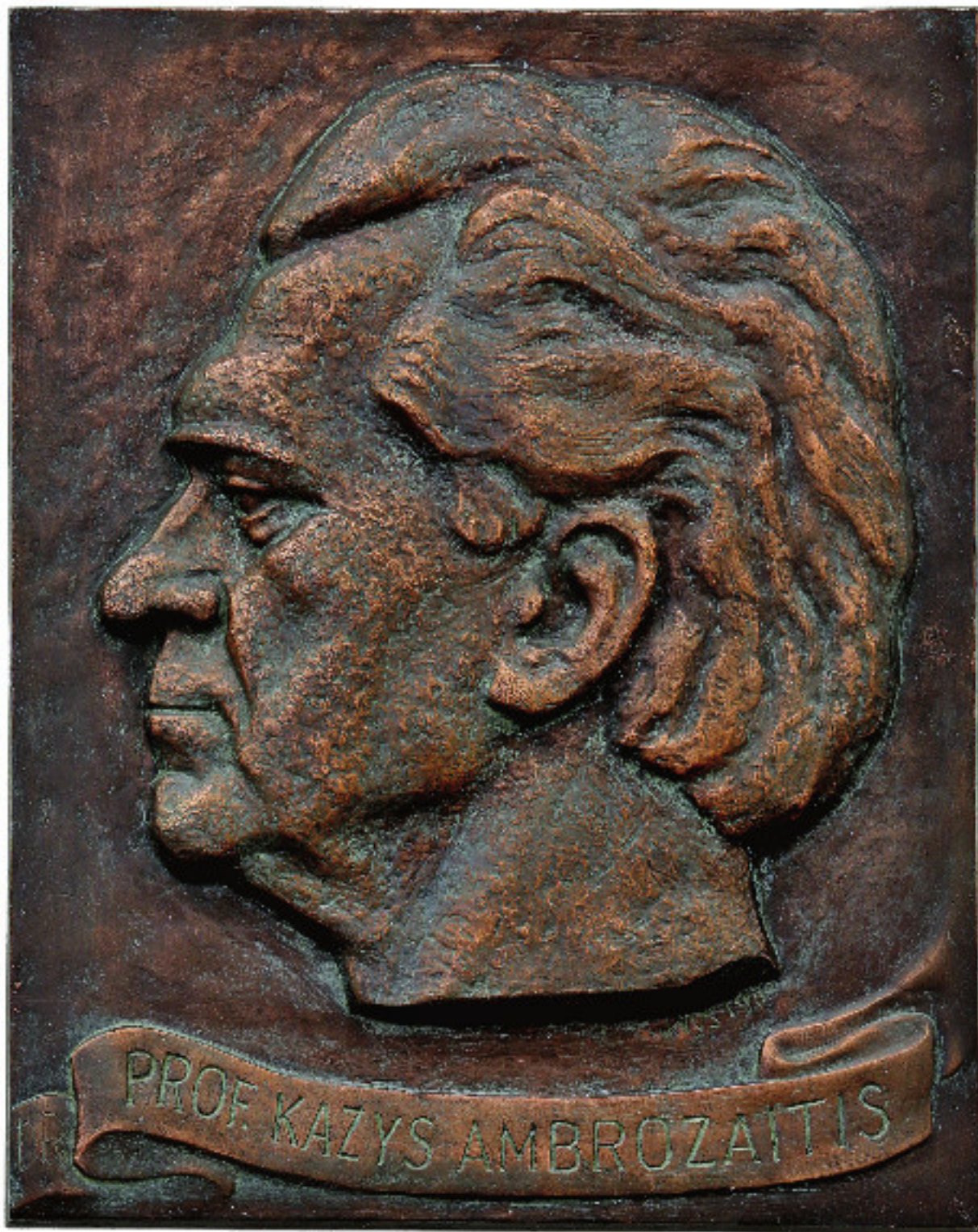
Gydytojas profesorius Kazys Ambrozaitis. 1977 Variuotas aliuminis