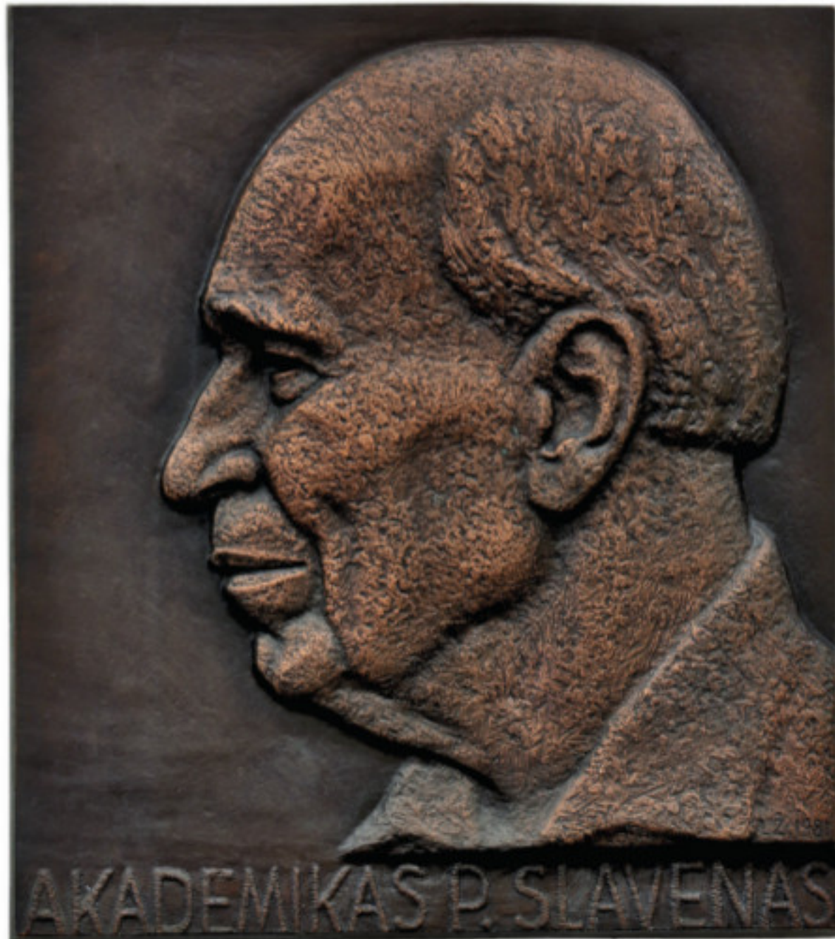
Astronomas, matematikas, akademikas Paulius Slavėnas. 1981 Vairuotas aliuminis