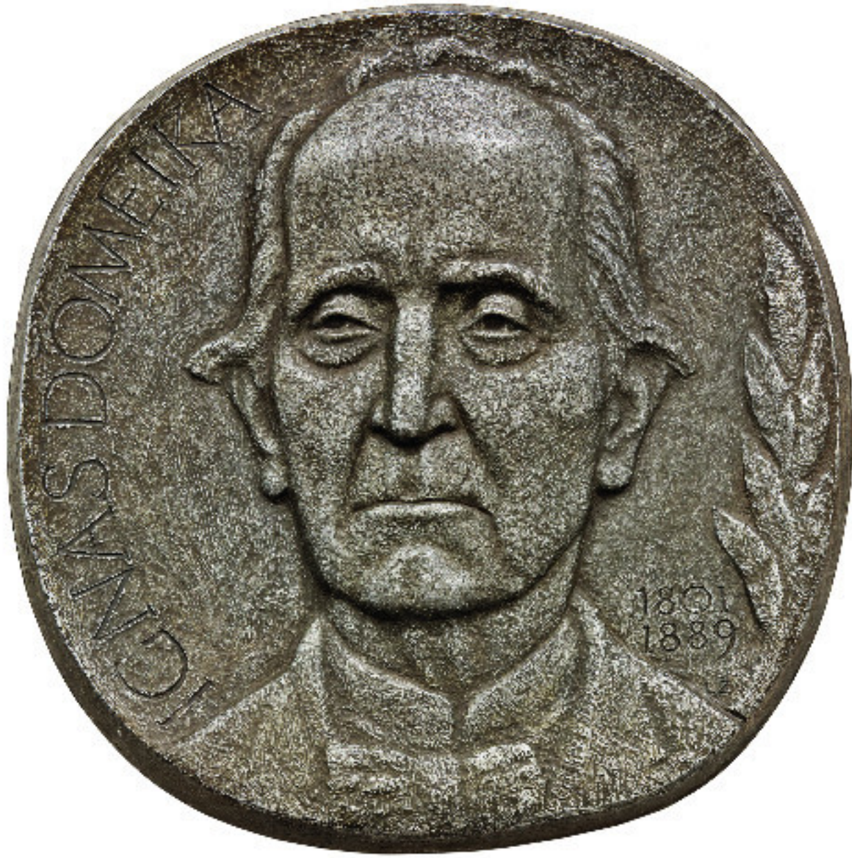
Geologas, etnologas, profesorius Ignas Domeika. 1973 Aluminis