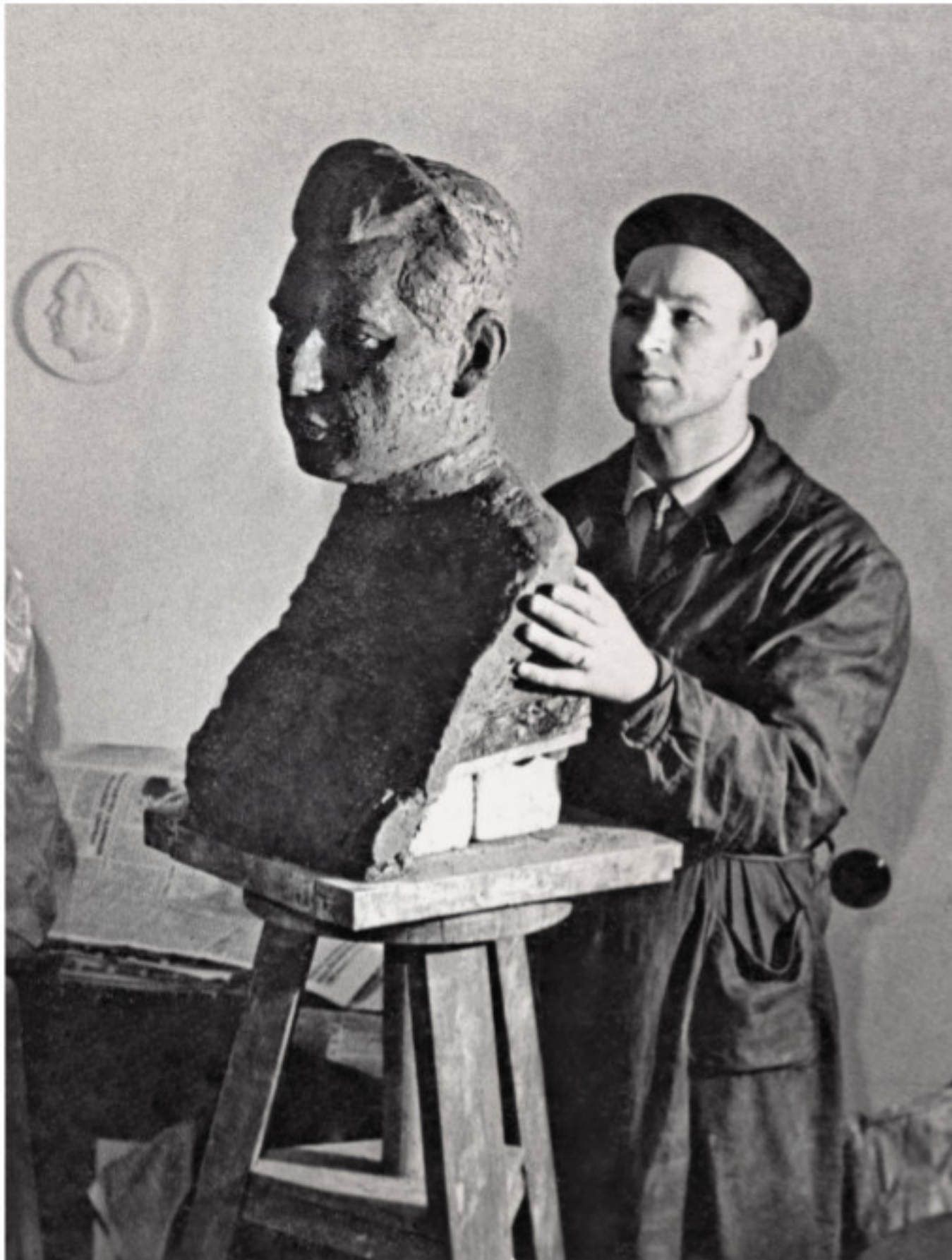
Lipdant profesoriaus A. Pronckaus biustą. 1961